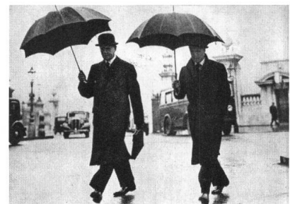
Anstössige Bürgerlichkeit. Edward VIII. in Begleitung (Illustration der Autobiographie, 1951)

Da eine derart auf Distinktion bedachte Gesittung im Zeitalter der Massenmedien kaum aufrecht erhalten werden kann, sollte man – im Interesse der Verständigung – mit dem Tod des Herzogs auch die klassische Wortbedeutung der Urbanität dahinscheiden lassen. Gerade deshalb lohnt es sich aber nicht nur für Urbanisten und Urbanologen stets zu hinterfragen, welchen identitätsstiftenden Raum die Stadt ihren Bewohnern heute und zukünftig bieten kann. Diese Aufgabe fordert zur Kreativität heraus, dem urbanen Lebensgefühl ein verändertes Profil zu geben, sofern man ihm nicht ganz zu entsagen gedenkt.