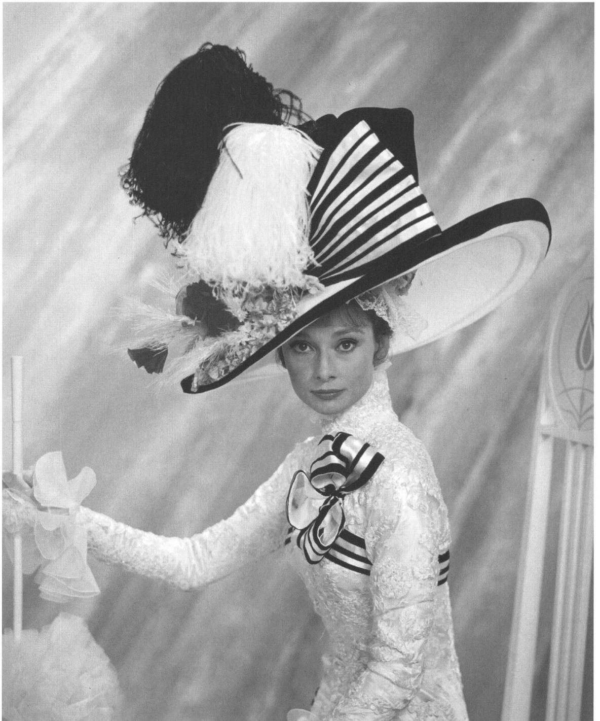
Eleganz als Ausdruck der Urbanität. Audrey Hepburn als Elisa, My fair Lady , 1963