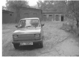
Borsig-Siedlung, Beete und Wege, Zabrze