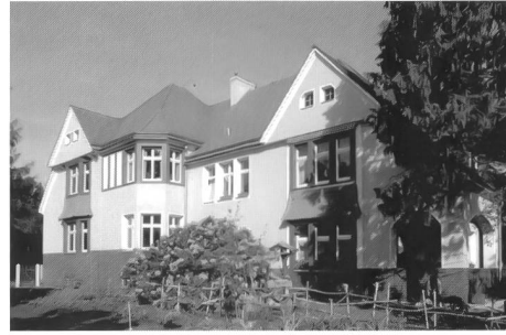
Marga, Gartenstadt, Senftenberg

reagiert werden kann, koordiniert die IBA seit 2003 das Projekt Restrukturierung von Siedlungsbeständen als Teilvorhaben des EU-Projektes REKULA (Restrukturierung von Kulturlandschaften). Im Rahmen des mit der Politechnika Śląska in Gliwice, der ober-schlesischen Stadt Zabrze, der Region Venetien und der Fondazione Benetton Studi Ricerche in Italien durchgeführten Projektes wird der Umgang mit Siedlungsbrachen und Entleerung im Erfahrungsaustausch mit vergleichbaren Regionen im europäischen Raum modellhaft umgesetzt. Die IBA kann damit in der aussergewöhnlichen Situation des raschen regionalen Strukturumbrechens in der Lausitz Lösungsansätze entwickeln, die in den kommenden Jahren auch für andere Landschaften Europas mit entsprechenden Schrumpfungsentwicklungen Modellcharakter übernehmen.