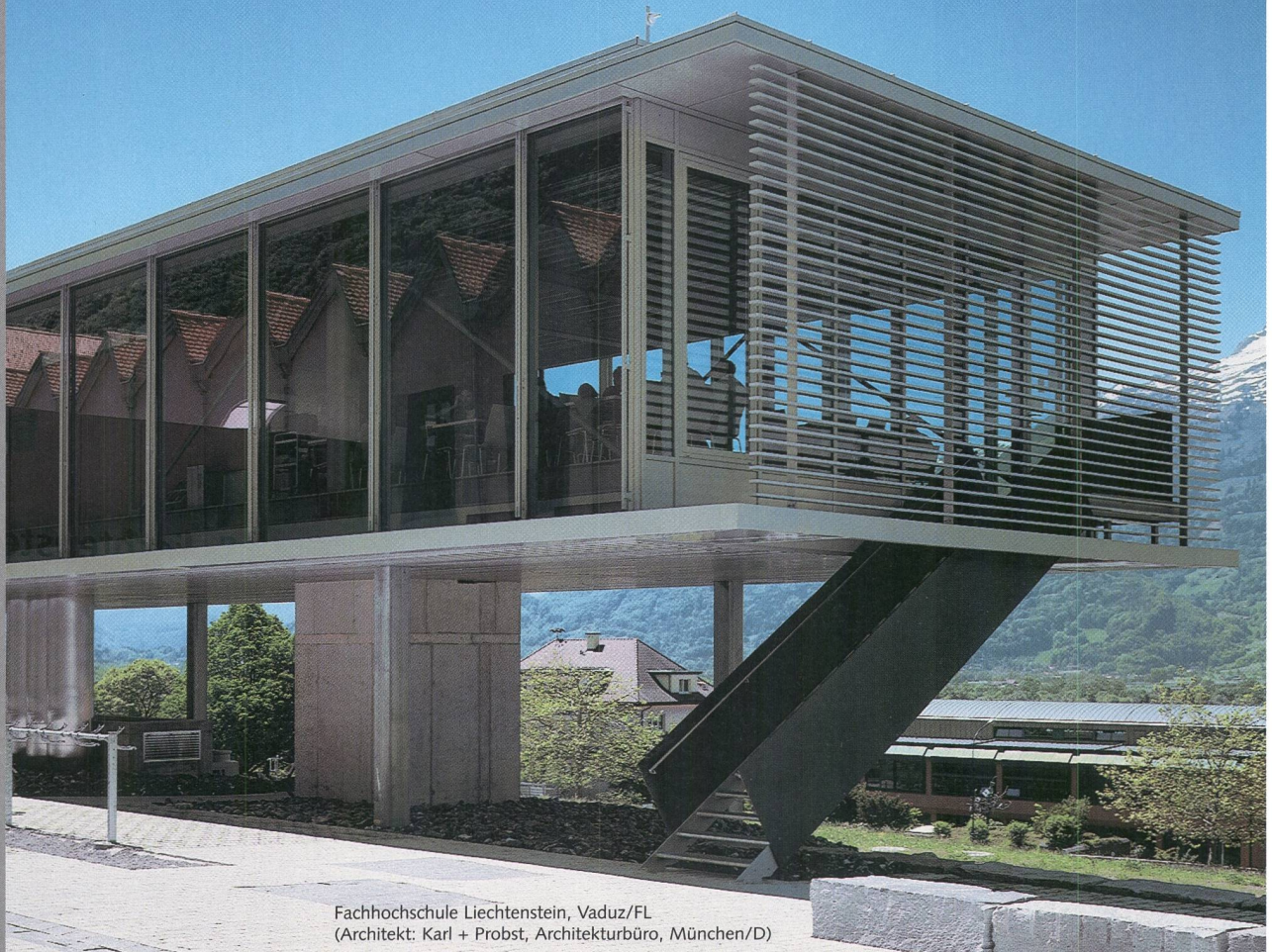
Fachhochschule Liechtenstein, Vaduz/FL (Architekt: Karl + Probst, Architekturbüro, München/D)