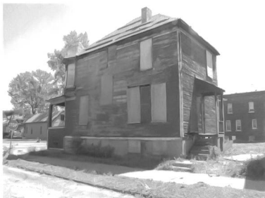
Detroit, Innenstadt, Foto vom Projektbüro Phillip Oswald

Kriege, Naturkatastrophen und Epidemien sind heute wie früher Faktoren, die das Wachstum städtischer Populationen beeinträchtigen. Daneben führen auch Deindustrialisierung, Suburbanisierung, räumliche Polarisierung und demographischer Wandel zum Schrumpfen.