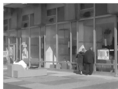
Hotel Neustadt, Espresso bar, Halle Neustadt, Foto von Annett Jummrde, 2003

Das Hotel Neustadt hat gezeigt, dass Theater und Architektur in Problemgebieten, wie schrumpfenden Städten, kreatives Potential wecken können, indem sie Raum als Aktivität begreifen. Benjamin Foerster-Baldenius stellte dazu fest: „Auf der Suche nach neuen Wegen im Städtebau können wir viel mit dem Theater lernen. Von der zeitweisen Realisierung von Visionen können beide profitieren, das Theater bekommt Bodenhaftung und Publikumsnähe und die Stadtplaner können ihre Statistiken und Parkplatzzählereien ablegen und wieder Ideen produzieren. Und der Stadt kann es nur gut tun, wenn man ihr immer wieder zeigt, was mit ihr möglich ist.“