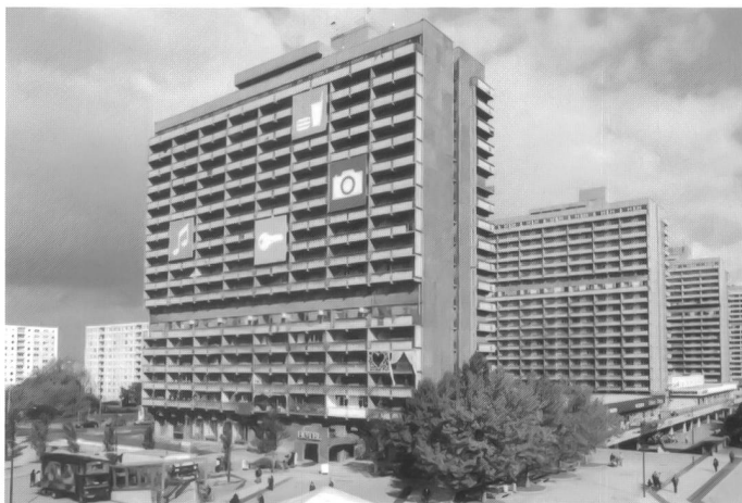
Hotel Neustadt, Halle Neustadt, Foto von Hedi Lusser, 2003

überregionalen Berichten, die auf Halle seit langem mal wieder ein gutes Licht werfen. Leerstand und Schrumpfung sind aktuelle Themen. Abriss eine Möglichkeit. Eine andere ist Häuser für Zwischennutzungen zur Verfügung zu stellen, um so weiteren Verfall zu verhindern. Wie viele Beispiele besetzter Häuser weltweit und auch das Hotel Neustadt zeigen, bedeutet ein leer stehendes Haus nicht unbedingt kein Interesse am Haus, oder kein Bedarf, sondern nur, dass es im Moment nach den marktwirtschaftlichen Bedingungen nicht funktioniert. Ein bereit stellen und öffnen der Häuser für Interessenten, wie zum Beispiel Jugendliche, kann eine Aufwertung für das Haus, wie auch die umliegenden Häuser bedeuten, für mehr als einen Sommer.