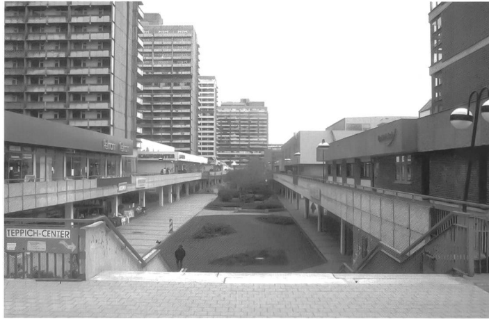
Halle Neustadt, Zentrum

Interessant ist, dass schrumpfende Städte oft kulturelle Hochburgen sind, in denen sich aus Subkulturen Hochkulturen entwickeln, die global bekannt werden, und rückwirkend positiv zum Image der Städte beitragen. Beispiele sind Detroit, Manchester und Liverpool, die vor allem in der Musik Wegweisendes geschaffen haben. Doch von der Musik allein kann keine Stadt existieren. Es gilt, Potentiale schrumpfender Städte zu erkennen und zu nutzen. Wachstum und Schrumpfung sind Phänomene, die sich abwechseln, die heute sogar innerhalb einer Stadt parallel laufen, und die weder nur positiv noch nur negativ sind.