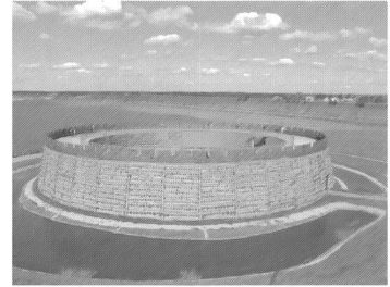
Slawenburg Raddusch, Vetschau, Foto von High-Picture

ziehen. Und Kulturlandschaft entsteht nach meiner Auffassung nun einmal durch ein produktives, möglichst kulturvolles Wechselverhältnis zwischen Mensch und Natur, das die kurz- und langfristige Reproduktion und Weiterentwicklung beider Seiten umfasst.