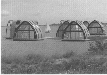
Ecke Design, Schwimmend Wohnen , Entwurf einer Marina Schwimmender Häuser, Geierswalde, Collage