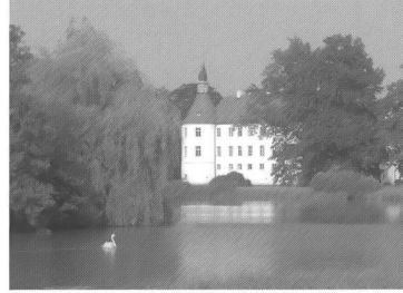
Schloss und Park Fürstlich Drehna