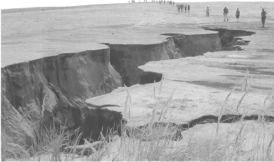
Sinnliche Tagebauwanderung , ehemaliger Tagebau Meuro, Grossräschen