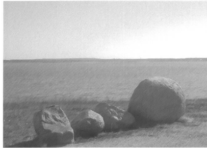
Gräbendorfer See, ehemaliger Tagebau Gräbendorf, Greifenhain, Foto von Diana Stuckatz