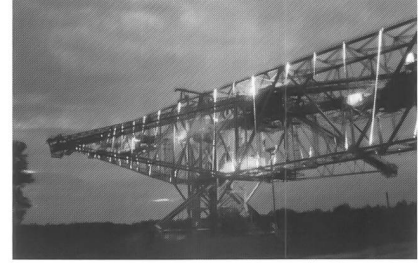
Licht- und Klangkunstwerk Besucherbergwerk F60 , Lichterfeld bei Finsterwalde