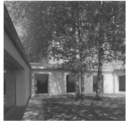
Hofansicht Einfamilienhaus Meggen nach Umbau, 2001

trans: Das Thema weiterbauen wurde von Ihnen in vielfältiger Weise bearbeitet. Betrachtet man den Stallumbau in Bergün: Ist dies ein klarer dialektischer Umgang, wie kam es zu dieser Lösung?