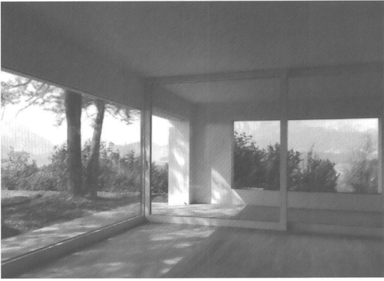
oben: Innenansicht Einfamilienhaus Meggen nach Umbau, 2001 rechts: Grundriss: Einfamilienhaus in Meggen, 2000