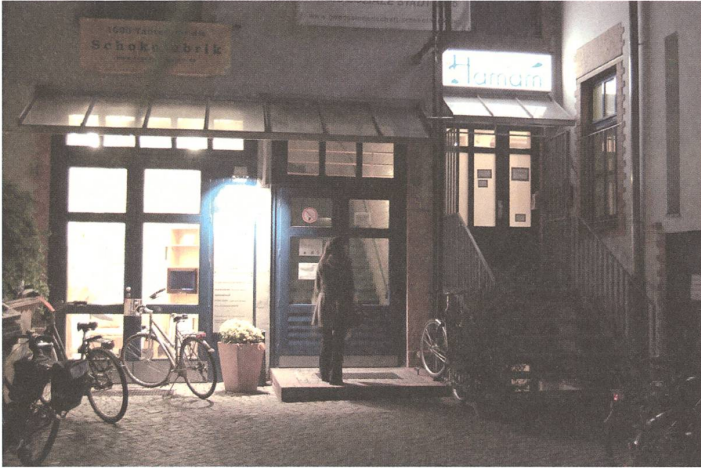
fig. c Ansicht der Schokofabrik