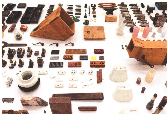
fig. b Ausstellung IN LOVE TO, 2011 Aus der Reihe Formel X im DAZ Berlin, photo © Dawin Meckel / OSTKREUZ.

So kamen und kommen beständig neue Sachen hinzu und verändern das Bild unseres Archivs. Mittlerweile haben neben den analogen, greifbaren Dingen, auch digitale ihren Platz gefunden. Dabei ist die Botschaft, die