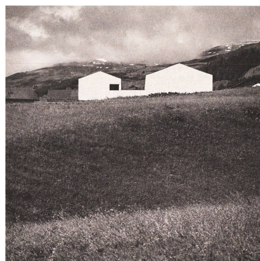
fig. a, b, c Schulhaus Vella – Val Lumnezia.