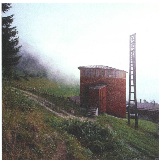
fig. d, e, f Kapelle Sogn Benedetg – Sumvitg.

ihn beispielsweise durch angeschnittene Formen imaginär über den Bildrand hinaus fortsetzen und erweitern.