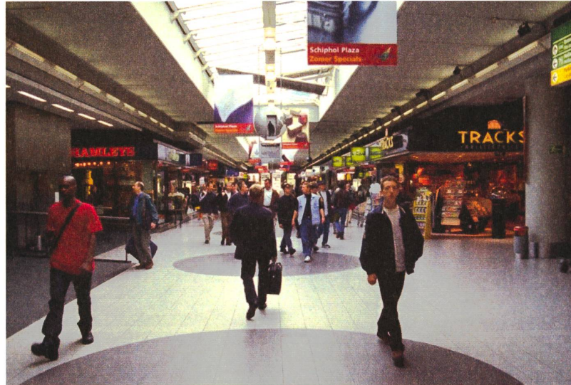
fig. c Schiphol Airport, Amsterdam © Benthem & Crouwel.

Mindestens ebenso sehr wie durch die elektronischen Kommunikationsmittel wird unser Alltag durch Verwendung von Verkehrsmitteln geprägt – mit erheblichen Auswirkungen auf das öffentliche Leben. Einerseits wächst das Einzugsgebiet öffentlicher städtischer Räume, die dank effizienter Verkehrsmittel von immer mehr Menschen erreicht werden können. Andererseits verbringen wir einen wesentlichen Teil unseres Alltags in diesen Verkehrsmitteln und den dazugehörigen Räumlichkeiten. In diesem Sinne hat die Mobilität ihre eigenen