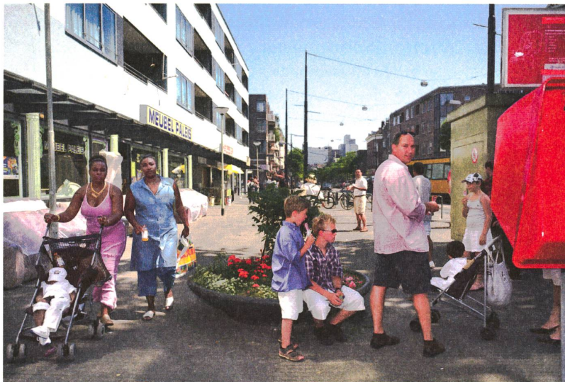
fig. a Rotterdam, © Otto Smeek.

In Architektur und Städtebau wird unter dem Begriff «öffentlicher Raum» meist auf eine historisch begründete Raumtypologie zurückgegriffen: auf Strassen und Plätze, Promenaden und Passagen, Parks, Salons und Kaffeehäuser – eben jene Räume, in denen sich das junge Bürgertum seit dem 18. und 19. Jahrhundert als politische und kulturelle Kraft etablieren konnte. Häufig wird mit dem Begriff «öffentlicher Raum» auch auf eine juristische Definition Bezug genommen. In diesem Sinne gelten all jene frei zugänglichen Räume als öffentlich, die im Eigentum einer Körperschaft des öffentlichen Rechtes sind und von ihr betrieben werden. Dieser Status garantiert allen Bürgern die Ausübung ihrer Grundrechte, wie das