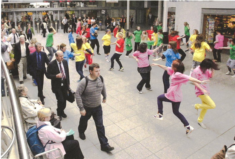
fig. b Flashmob

Die zunehmende Bedeutung des Internets für das öffentliche Leben hat nicht zwangsläufig zur Folge – wie häufig befürchtet – dass andere Sphären des öffentlichen Lebens an Bedeutung verlieren. Es gibt keinen Nachweis dafür, dass die Stadt an Öffentlichkeit verliert, weil immer mehr Öffentlichkeit im virtuellen