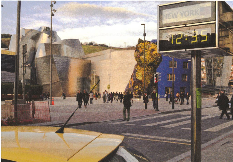
fig. e Guggenheim-Museum, Bilbao an extract from the research 'Stararchitecture' by Michele Nastasi © Michele Nastasi.

Nichtsdestotrotz haben diese Bauwerke bisweilen einen erheblichen Einfluss auf ihr lokales Umfeld. Als Attraktionen von internationaler Strahlkraft erzeugen sie touristischen Publikumsverkehr, bestehend aus Schaulustigen und Besuchern aus aller Herren Länder. Infolgedessen ist auch das städtische Umfeld einem Veränderungsdruck ausgesetzt, inklusive der Bewohner, die unter Umständen der Druck der Gentrifizierung weichen müssen. Die lokale Öffentlichkeit wird von einer touristischen Öffentlichkeit überlagert.