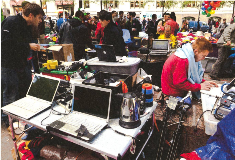
Fig. 9 Occupy Wall Street, Zuccotti Park, New York