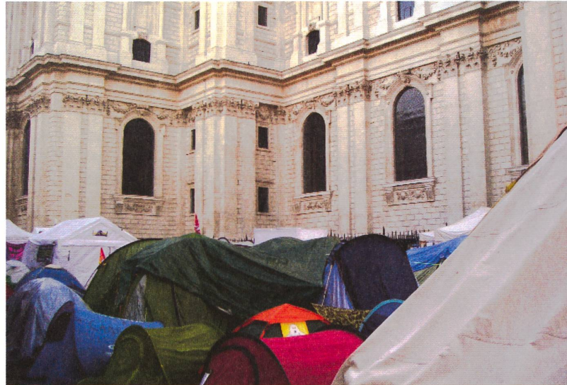
fig. 1 Occupy London Stock Exchange, St Paul's Cathedral, London © Thomas Fischer Architekt.

Aber die Proteste in Stuttgart und die <Occupy>-Bewegung waren mehr als ein bürgerlicher Reflex. Sie stützten ihre Aktionen nicht nur auf die Möglichkeiten des öffentlichen Raumes und auf das bürgerliche Ideal der Kleinstadt. Für ihren öffentlichen Protest machten sie sich auch Techniken zunutze, die diesen Idealen