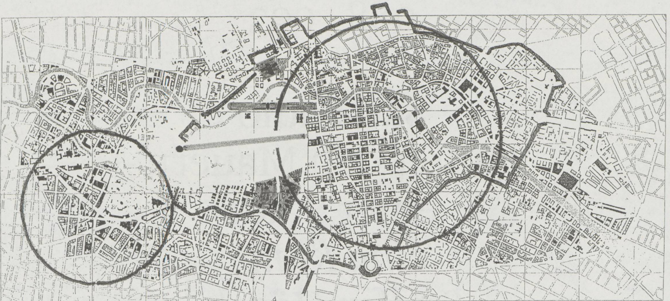
fig. b Das Zusammenwachsen der nach 1945 selbständig gewordenen Zentren Ost und West im geteilten Berlin zur gemeinsamen Mitte der neu vereinten Stadt Berlin als der Bundeshauptstadt Deutschlands – mit Hauptbahnhof, Band des Bundes, Festmeile, Kulturforum und Potsdamer Platz. Planunterlagen: Senat Berlin; Einzeichnungen: B. Flierl

wirklichen, weil dafür das Geld fehlte – ist aber politisch noch nicht endgültig vom Tisch!