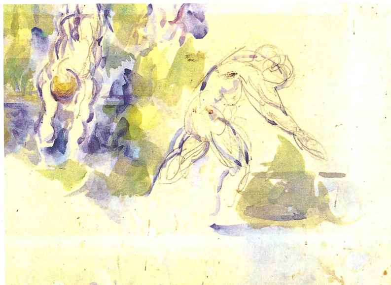
Zwei tauchende Badende, 1895-1900 Paul Cézanne

pm: Das ist aber eine ziemlich billige Rückversicherung, so entlässt man sich aus der Verantwortung! Für mich ist wichtig, dass man erst mal eine Skizze macht. Dann misst man und hat einen ungefähren Wert. Und dann kann man genau zeichnen, ein bisschen drunter, ein bisschen drüber, oder dazwischen – bis die Wirkung eben so gut ist wie auf der Skizze. Das muss man mit