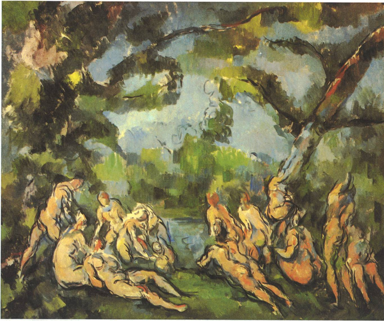
Badende, 1900-05 Paul Cézanne

habe lieber ein Projekt, dass da oben rechts soviel unglaublich Gutes hat, und da unten hat es Fehler drin, aber ich vertraue dem da oben rechts – lieber so, als wenn alles mitelmässig ist. Sie müssen während Ihrer Ausbildung an der Hochschule ganz viel Eigenes leisten, sonst ist es wie in der Volksschule, in der alles, was richtig ist, doppelt unterstrichen werden kann. Aber das Doppeltunterstreichen gibt es nicht bei unserem Beruf, das ist das Wunderbare daran. Die absolute Gewissheit hat man nicht mehr. Es ist alles offen und reicher nach oben.