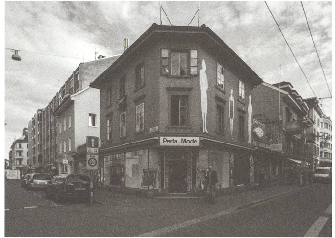
fig. c Perla-Mode, 2014.