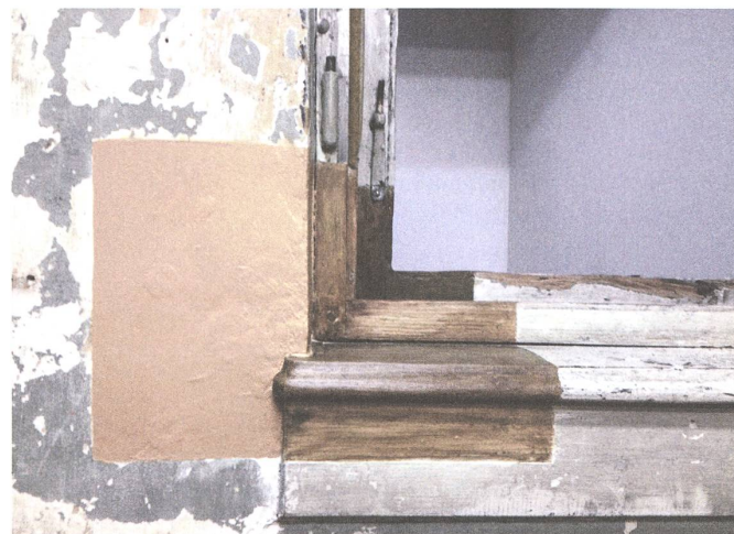
fig. j Sebastian Utzni, «Kleine Heilung 1», «Perla-Mode», 2014.

durch seine Interventionen und seinen körperlichen Einsatz verändert und neu erfahren (fig. g).