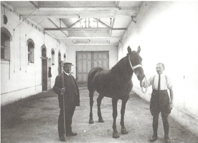
fig. d Guggenheim Pferdehandlung, Innenraum, um 1913/14.