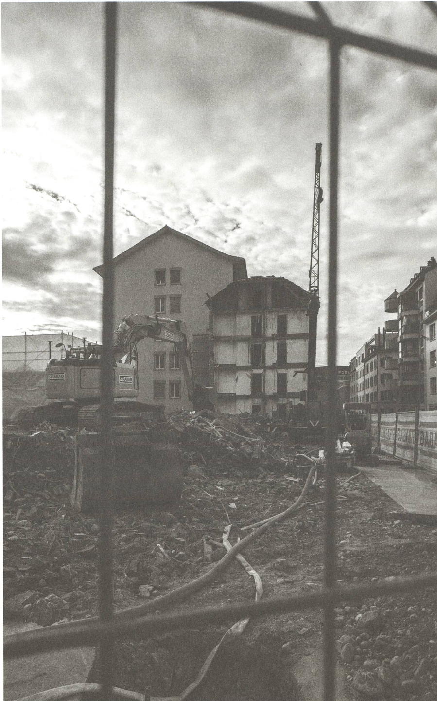
fig. a Zürich, Zweierstrasse, Zustand 8. Mai 2014.

«It is an empty desolate place, and I'm sure it is this desolation that makes dungeness so utterly attractive: that in its emptiness it can become so full.» 1