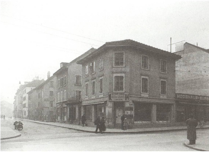
fig. b Schuh-Haus Chline Lädeli, 1946.