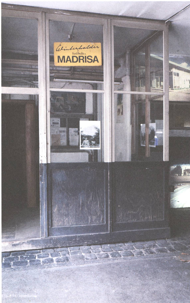
fig. h Installationsansicht, Winterhalder-Areal, 2014.