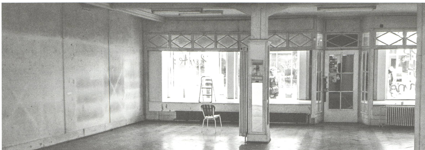
fig. f «Perla-Mode», Innenraum, 2014.

ein zentraler Standort, andererseits oft von Zwischenfällen gestört. Die Frage, wie an diesem Ort Kunst platziert und ausgestellt werden kann, ist ständiges Thema. Der Hauptraum des «Perla-Mode» ist ein Verkaufsraum mit asymmetrisch grossen Fenstern zur Langstrasse hin, die auf die Präsentation nach und die Wahrnehmung von aussen ausgerichtet sind. Im Untergeschoss befindet sich das ehemalige Lager des Modegeschäfts: ein düsterer, niedriger Raum, der ebenfalls als Ausstellungsraum genutzt wird.