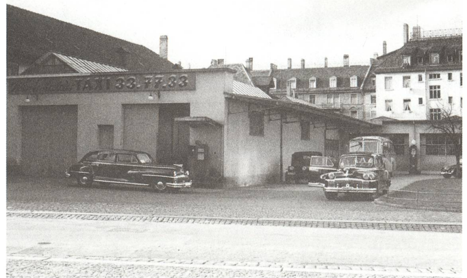
fig. e Winterhalder Taxi, 1945.

vom 10. bis zum 31. Mai 2014 in Zürich im «Perla-Mode» und gleichzeitig im «Winterhalder-Areal» stattfand. 21 KünstlerInnen wurden eingeladen, sich mit der Geschichte, Umgebung und den Räumlichkeiten der Häuser auseinanderzusetzen. Die Mikrogeschichten und Wirklichkeiten der Orte wurden dabei beobachtet, erforscht und archiviert. Die Geschichten und Funktionen der beiden alten Häuser und ihrer Umgebung wurden bei der Konzeption mitgedacht, da sie ein ganzes Quartier, dessen Tradition und Bild mitprägten.