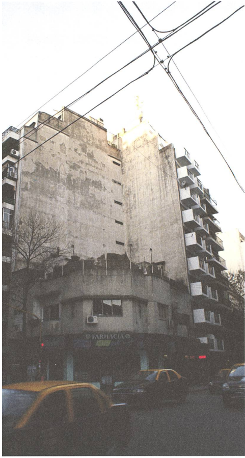
Charcas 3000. Fotografie: Lorenza Donati, 2012.