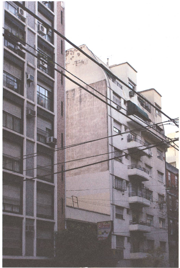
Colonel Diaz 1800.