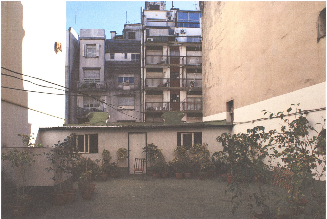
Billingshurst 1867.

Es folgte 1948 das Gesetz ‹La ley de propiedad horizontal›: Die peronistische Regierung 2 erlaubte das Errichten von 8- bis 12-geschossigen Wohnhäusern auf den Parzellen. Umgehend wuchs die Stadt in die Vertikale und der Boden verteuerte sich. Mit der Reorganisation der Wirtschaft aufgrund der grossen Enttäuschung über das peronistische Wirtschaftsmodell und dem Fall von Argentiniens Präsident Juan Domingo Perón Sosa flossen immer mehr ausländische Gelder nach Buenos Aires. Die zunehmende Spekulation veränderte die Wirtschaft drastisch und steuerte von nun an die Entwicklung der Stadt. Noch bevor überhaupt Reglemente und andere Planungsinstrumente eingeführt werden konnten, erfasste ein grosser Umbau die Stadt. Einzelne Eigentümer, die aus ihrem Grundstück Gewinn ziehen wollten, steuerten diesen: So wurde zum Beispiel ein zweistöckiges Haus aus dem 19. Jahrhundert abgerissen, um zwischen den zwei Brandmauern Platz für einen Wohnturm zu schaffen.