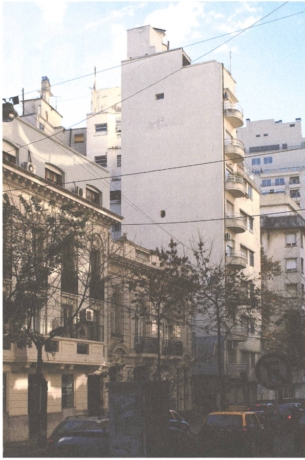
Austria 1800. Fotografie: Lorenza Donati, 2012.