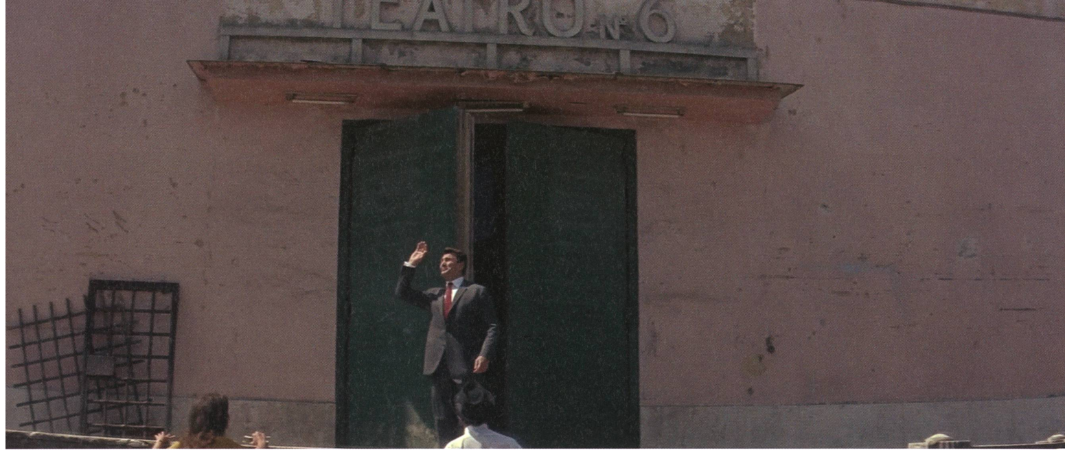
fig. e Des US-Filmproduzenten Jeremy Prokoschs erster Auftritt.

steigens, ist es das zu verhüllende Potential des Mauersegels auf dem Dach, das filmisch inszeniert wird (fig. d). 35 Verborgen und entborgen wird die nackte, sonnenbadende Camille sowie Fritz Langs Filmcrew; damit auch die letzte Einstellung beider Filme (fig. f): Doppelt gefilmt wird Odysseus' Erblicken seiner Heimat Ithaka. Das Ende des griechischen Film-Epos zeigt den Helden in Rückenansicht, mit dem wir die Sicht aufs Meer teilen. Anders als beim ersten theatralen Auftritt Prokoschs zu Beginn des Filmes (fig. e), sehen wir den Schauspieler im neuen Medium in Rückansicht. Die Ausrichtung der attischen Bühne im Theater, mit der «Skene» als gebauter Hintergrund, hat sich zugunsten jener im Film um 180 Grad gedreht. Alle Erregung legt sich mit dem triumphalen Blick aufs Meer.