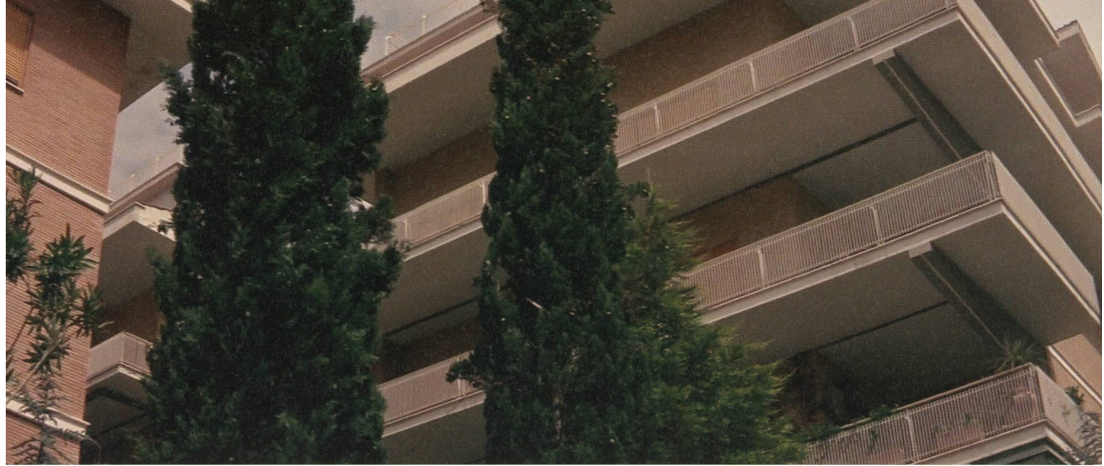
fig. a Der Neubau, in dem Camille und Paul kürzlich ihre Wohnung bezogen haben.