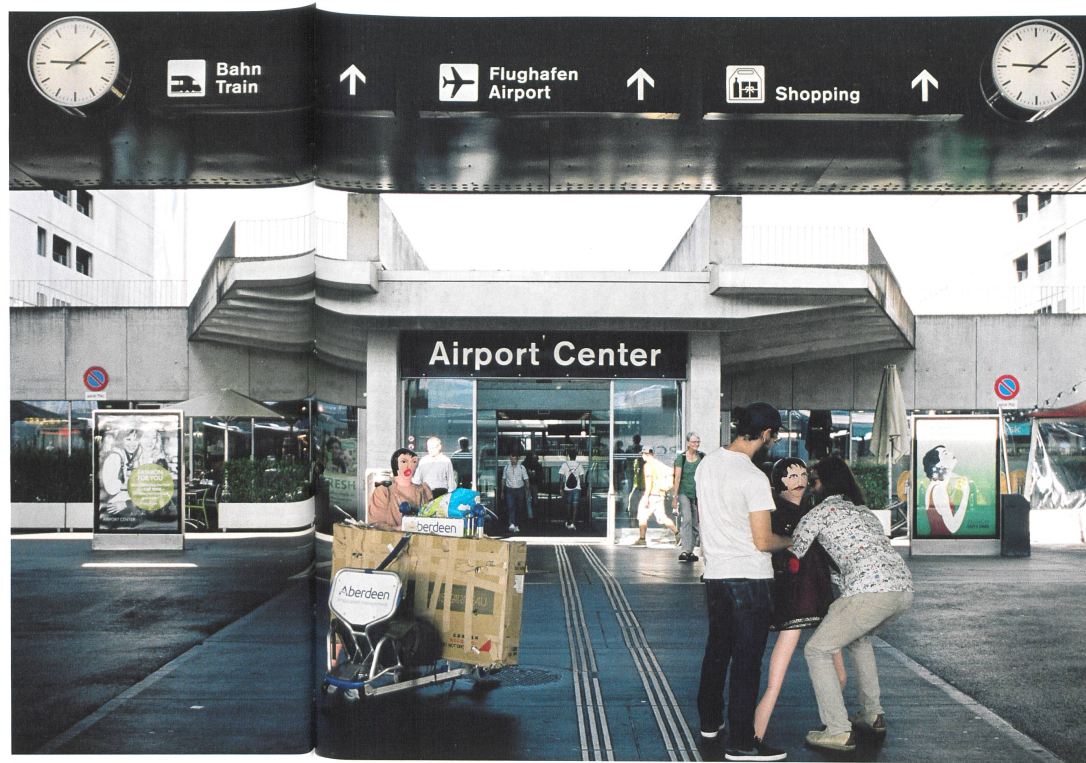
#131 Zürich, Switzerland, Bus Station Airport 01.09.2017