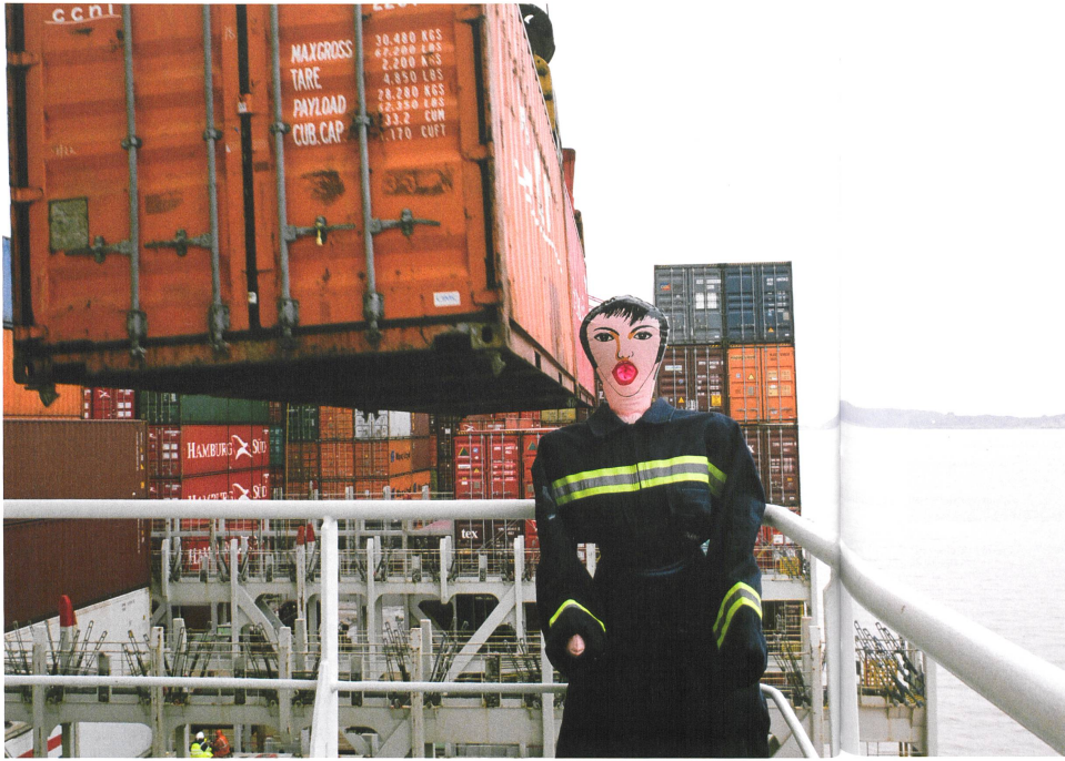
#47 Mejillones, Chile, Dock of Puerto Angamos 21.01.2017