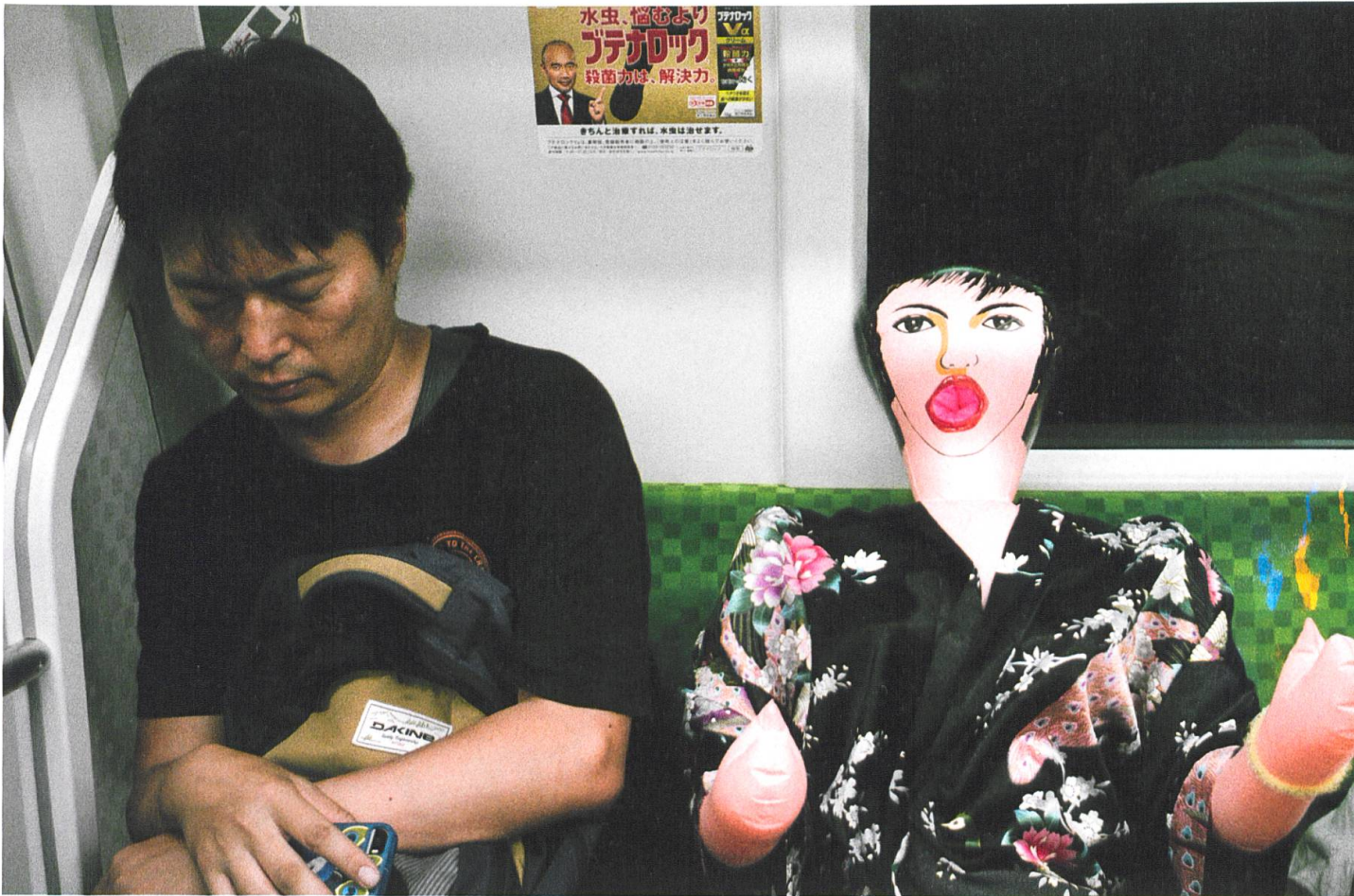
#79 Tokyo, Japan, Metro for Yokohama 28.05.2017