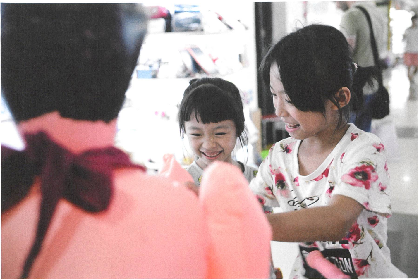
#221 Yiwu, China 19.08.2017