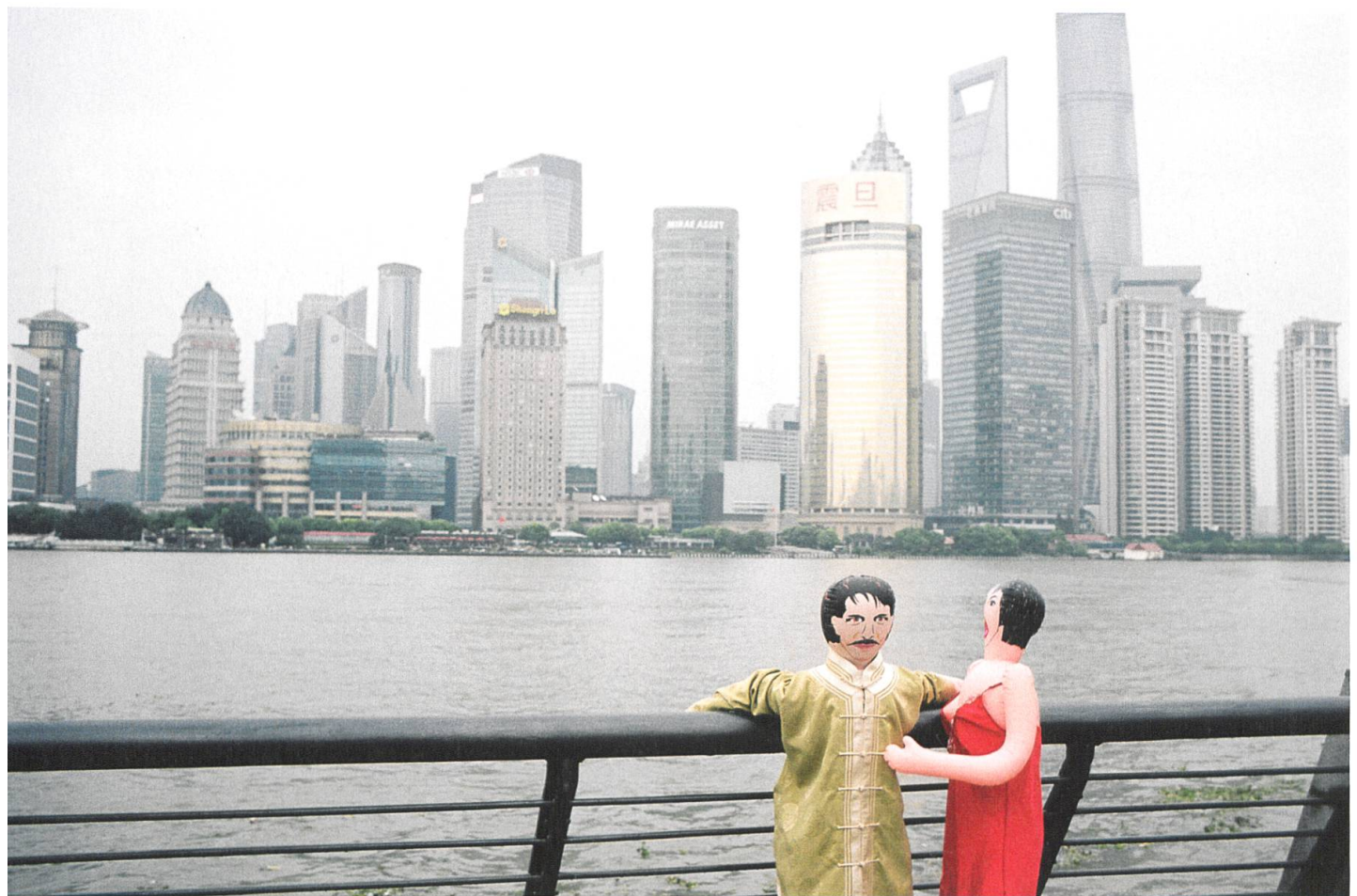
#122 Shanghai, China, View of Pudong 25.08.2017