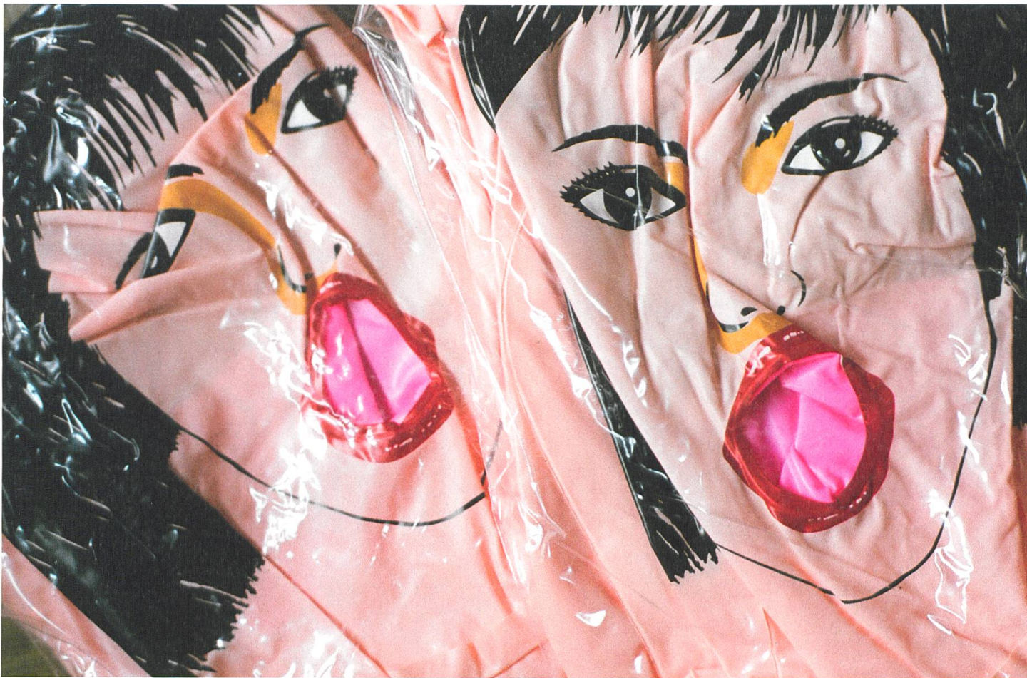
#116 Yiwu, China, Yiwu Mart Toys Factory 24.08.2017