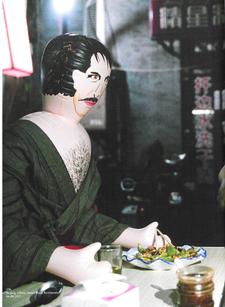
#96 Beijing, China, Street Food Restaurant 06.08.2017