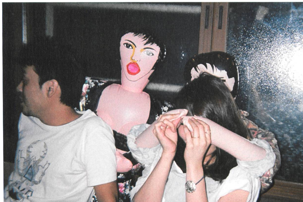
#78 Tokyo, Japan, Shinjuku 28.05.2017