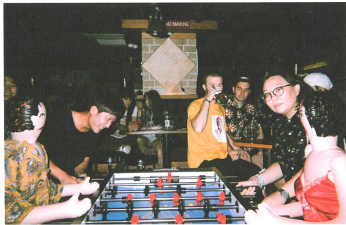
#94 Seoul, South Korea, Scogyo-Dong district 29.07.2017