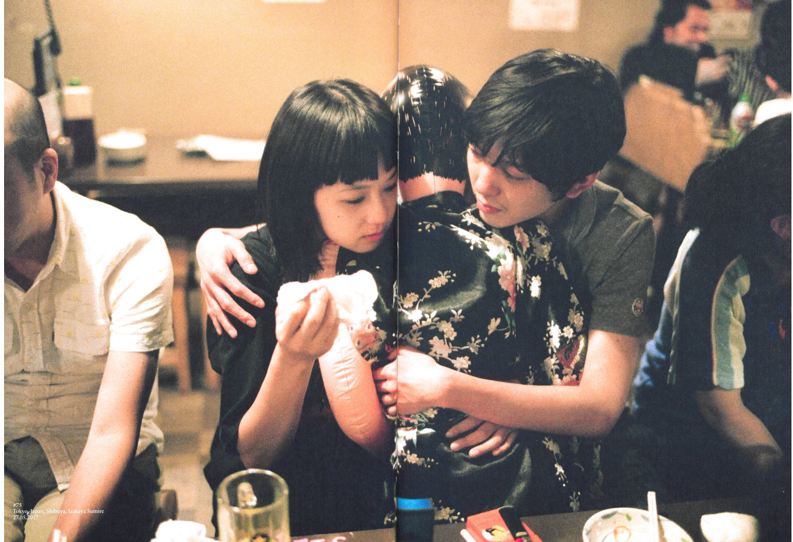
#75 Tokyo, Japan, Shibuya, Izakaya Sumire 27.05.2017