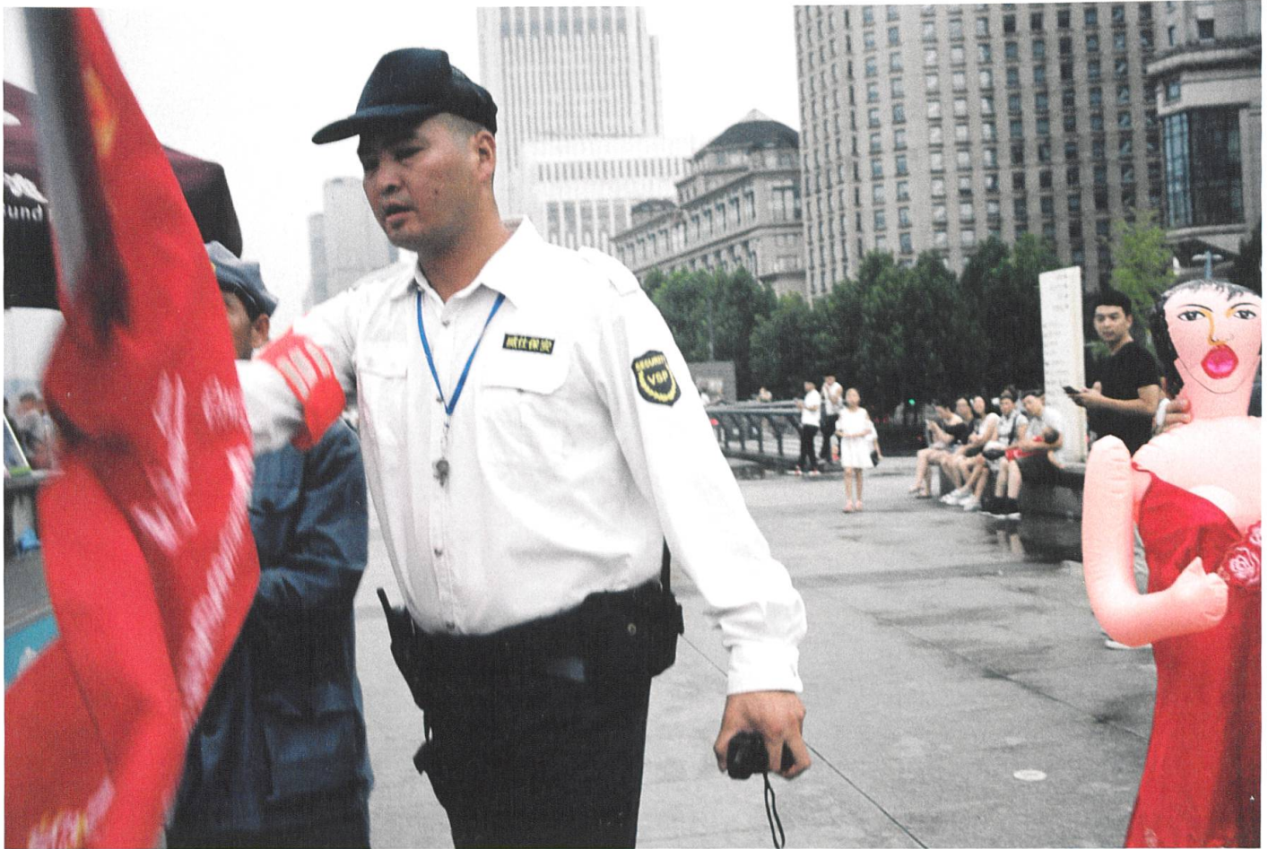
#120 Shanghai, China, The Bund 25.08.2017