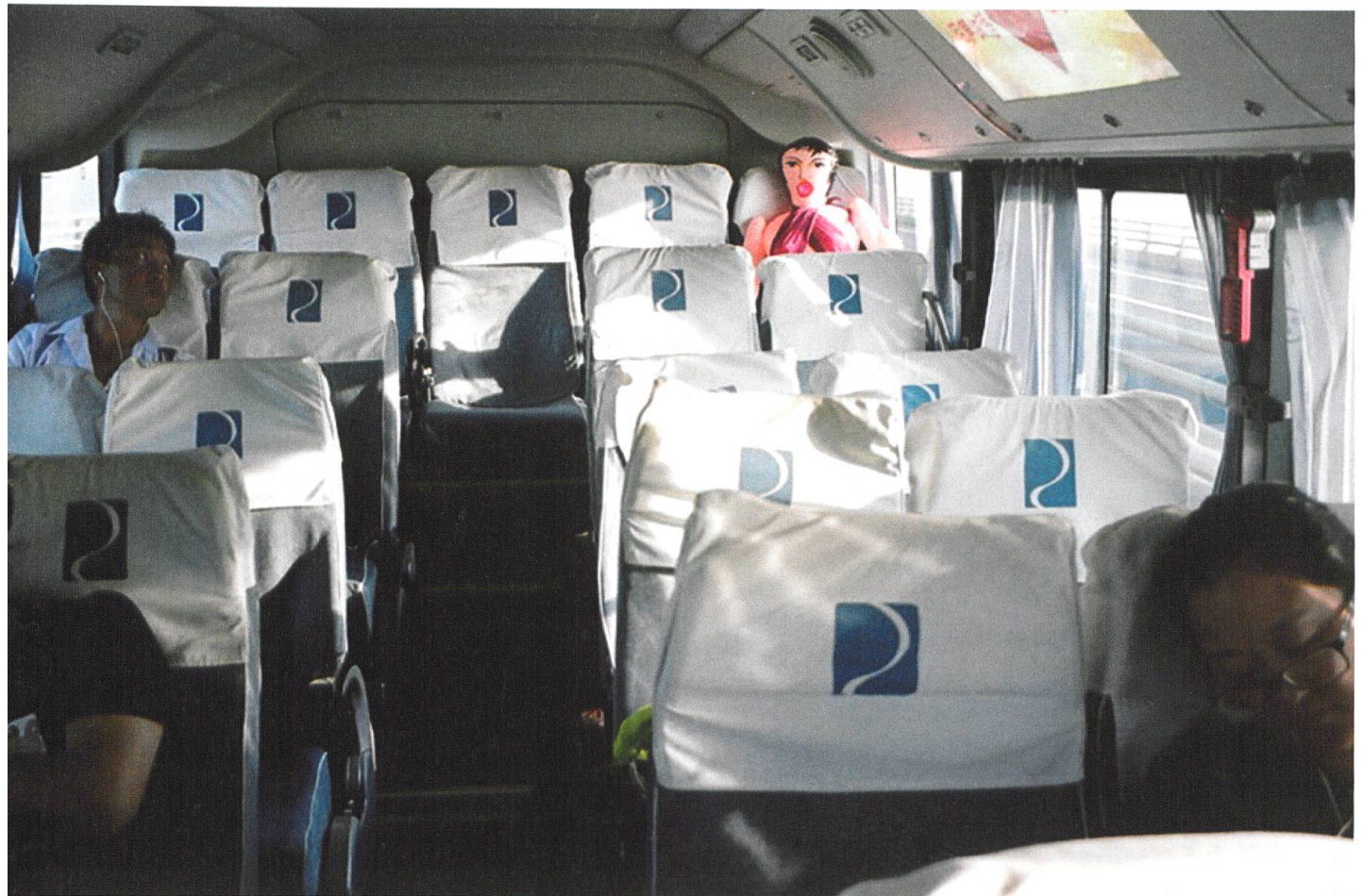
#122 Shanghai, China, Bus for Yiwu 21.08.2017