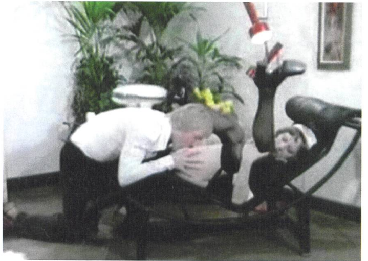
Lexi Bloom, Stuffed Petite 6 , 2011 Danielle Rodgers, The Passion of Heather Lear , 1990 Julea London, Slut Puppies , 2005 Melody Jordan, Deep Anal Drilling 4 , 2012 Lynn Stone, Virtualia 4: The Dark Side 2 , 2001 Unknown, Teenage Sex Film no. 712 – Young Flesh , 1978