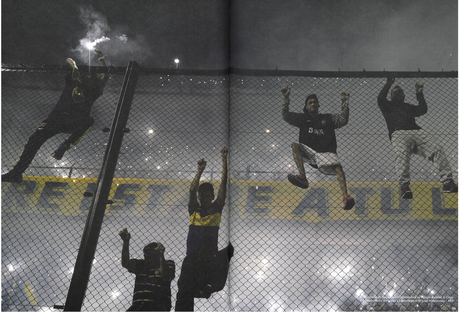
Fig. 1. Simulacro de evacuación y extinción a su Grupo alumnar la Caja de Fuegos en el estadio La Bombonera.