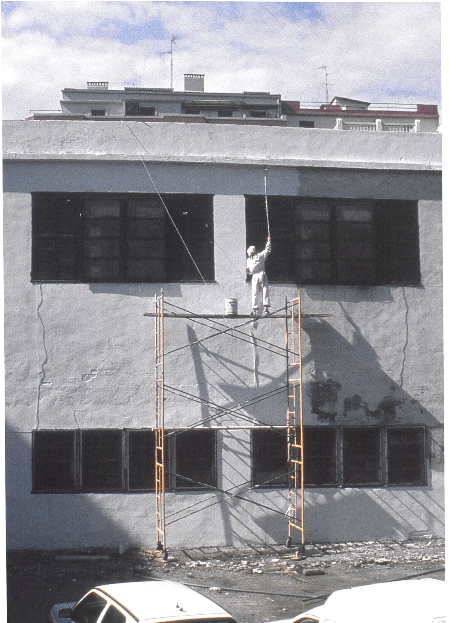
Lara Almarcegui: Restaurando el Mercado de Gros unos días antes de su demolición , 1995 © Lara Almarcegui