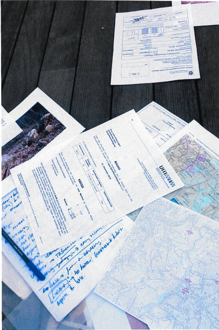
Lara Almarcegui: Mineral Rights , 2015, Forschungs- und Vertragsunterlagen.