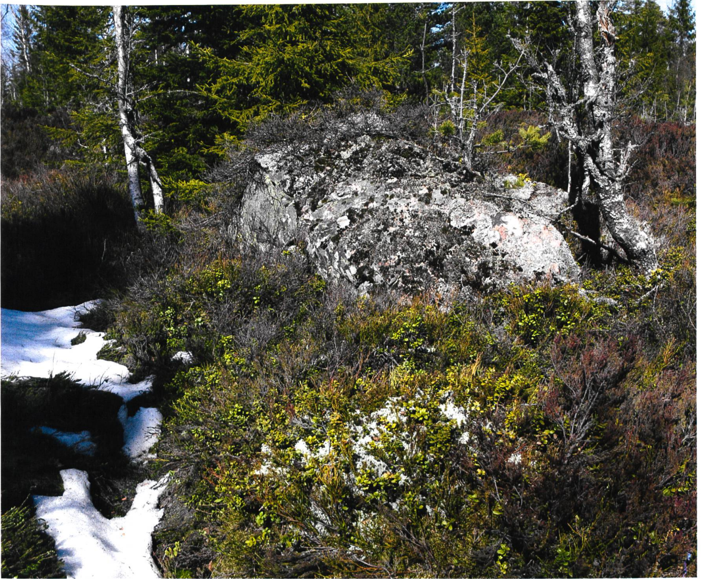
Lara Almarcegui: Mineral Rights , Tveitvangen, 2015. © Lara Almarcegui

Shell nicht. Sie können dort nicht abbauen. [...] Das ist mein Plan: ich beschütze das Mineral.» Und weiter: «Natürlich beschütze ich auch die Bäume, die Felsen, den Schnee und all das, wovon sich träumen lässt und was zerstört würde, wenn hier jemals abgebaut würde.» 29 Bewunderung und Ausbeutung scheinen sich gegenüber zu stehen. Im weiteren Gespräch beschreibt Lara Almarcegui die «wahnsinnige Schönheit» der Vegetation, der Farbe der Felsen und der Erde jenes Geländes, unter dem ihre Eisenvorräte liegen. In ihr liegt der eigentliche, viel umfassendere Schatz, dessen Hüterin sie dank der vertraglich gesicherten Explorationsrechte an Eisen geworden ist. In Ausstellungen werden Videoaufnahmen und Fotografien des Grundstücks projiziert. Wenn es zu Wertschöpfung aus Almarceguis Rohstoffvertrag kommt, dann allenfalls durch die Zirkulation von Dokumenten und Bildern im Kunstkontext. Wieder aber wird im Verlauf des Arbeitsprozesses kein Material entnommen und verwertet, sondern Aufmerksamkeit und Wissen hinzugefügt.