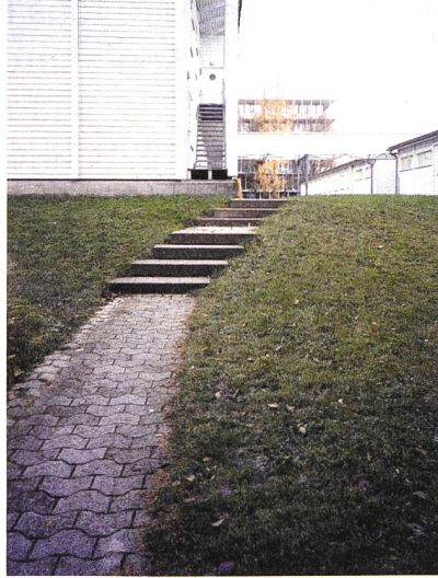
There is a formal entrance to the estate, but the fox prefers to take the shortcuts.