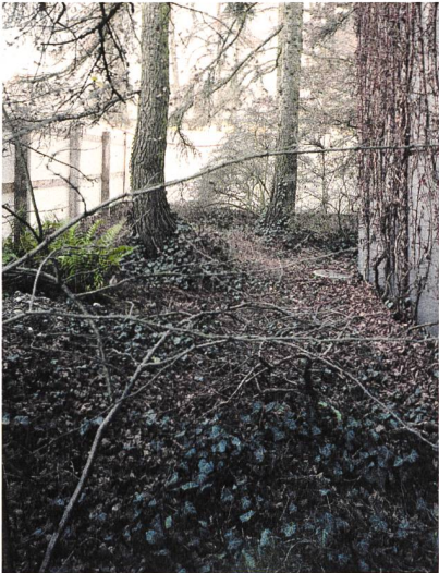
On a busy Tuesday morning, the fox likes to rest on these soft leaves.