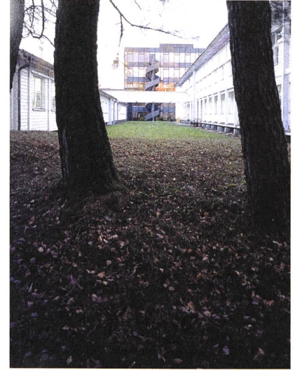
There are some aesthetically pleasing moments on the estate, but the fox probably doesn't care.