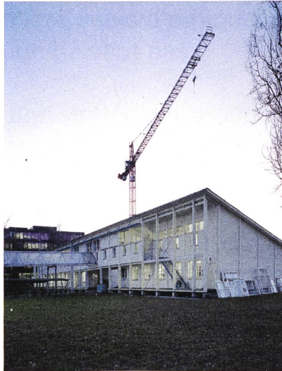
Compared to the new big thing the fox suddenly feels small.