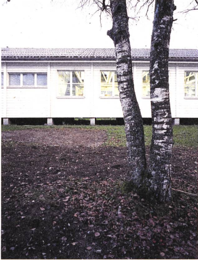
This is where the fox lives.