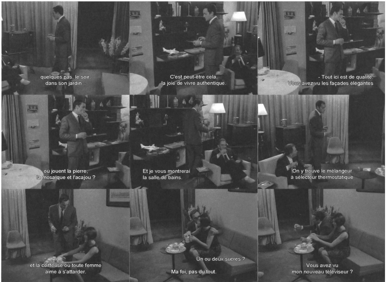
(Abb. a) Szene in der Art eines Werbespots für das Wohnen in «Elysée 2», 1964.