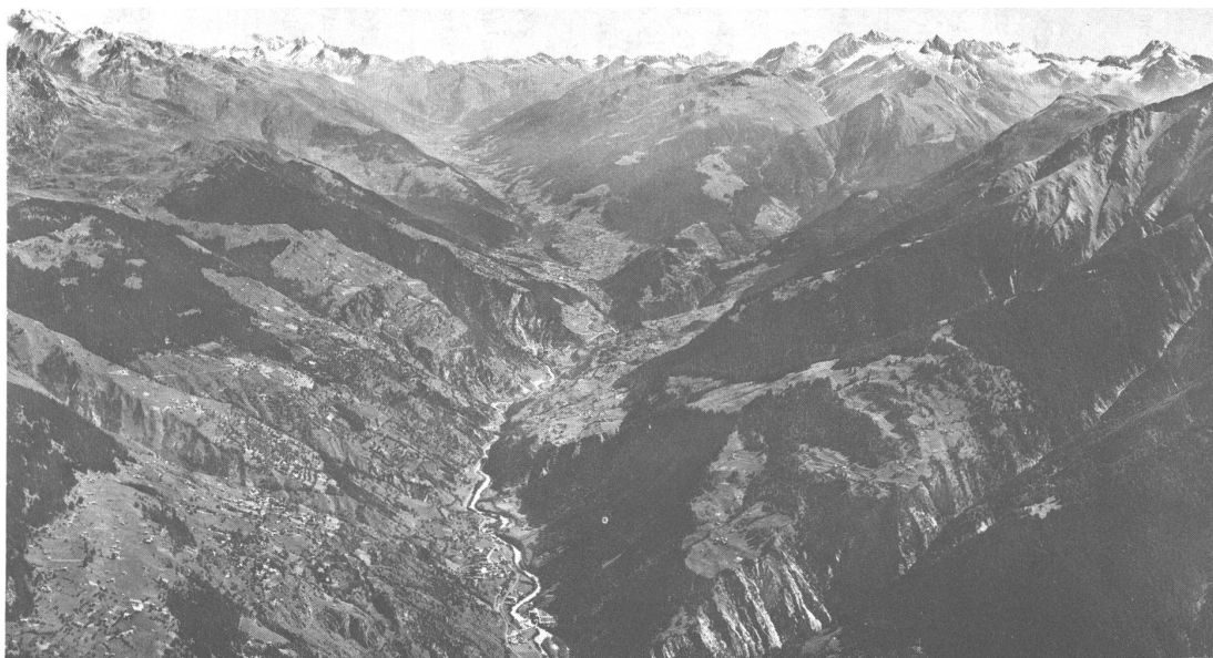
La Vallée du Rhône et le Haut-Valais Documentation: Pleinciel