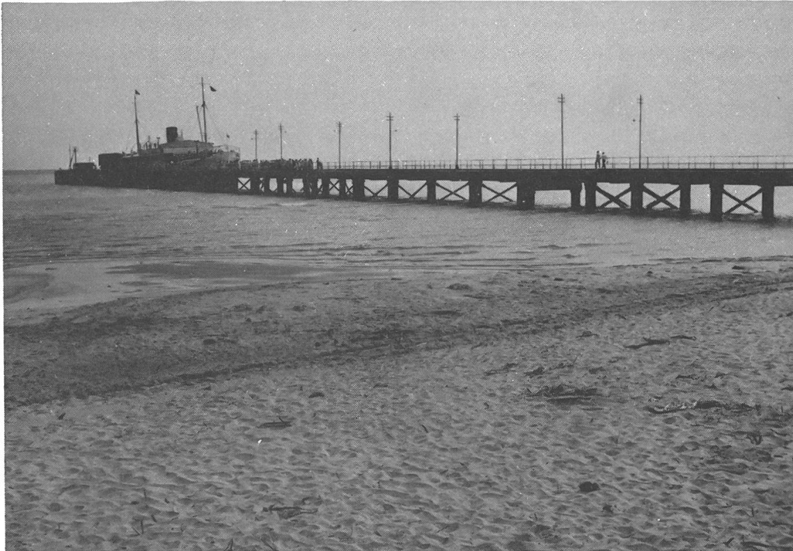
Die Fähre in Talaimannar