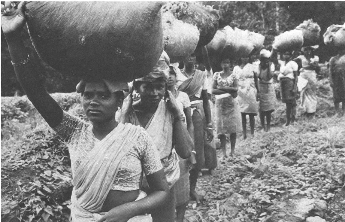
Teepflückerinnen bringen die Teeblätter zum Wägen (Bild HELVETAS)

Die Teeplantagenwirtschaft schuf im Hügelland eine weitgehend eigenständige, vom übrigen Ceylon isolierte Enklave. Jede Plantage ist eine in sich geschlossene soziale, kulturelle und wirtschaftliche Einheit. Das Produkt, der Tee, wird nach den Bedürfnissen eines internationalen Marktes produziert. Die Arbeitskräfte, die den Tee pflücken, verarbeiten und die Büsche pflegen, stammen aus dem Ausland. Sie sprechen eine andere Sprache und wurzeln in einer andern Kultur, als die Mehrheit der ceylonesischen Bevölkerung. Eine Integration der tamilischen Plantagenarbeiter in die singhalesische Gesellschaft wurde bewusst verhindert. Die Teearbeiterfamilien sind in mehrfacher Hinsicht an ihre Plantage gebunden. Die Plantage stellt ihnen Unterkünfte, Lebensmittel, medizinische Versorgung und in neuerer Zeit auch Schulen zur Verfügung. Der Zweck dieser Einrichtungen besteht darin, die tamilischen Arbeitskräfte am Leben zu erhalten und ihre Reproduktion zu sichern. Leistungen, die über diesen Zweck hinausgehen, wie z.B. Berufsbildungsmöglichkeiten für Plantagenkinder usw. werden nicht geboten. Das Angebot der Plantage deckt nur das absolut notwendige Minimum und dies oft noch in schlechter Qualität und zu übersetzten Preisen (Kemptner 1981 : 84–92).