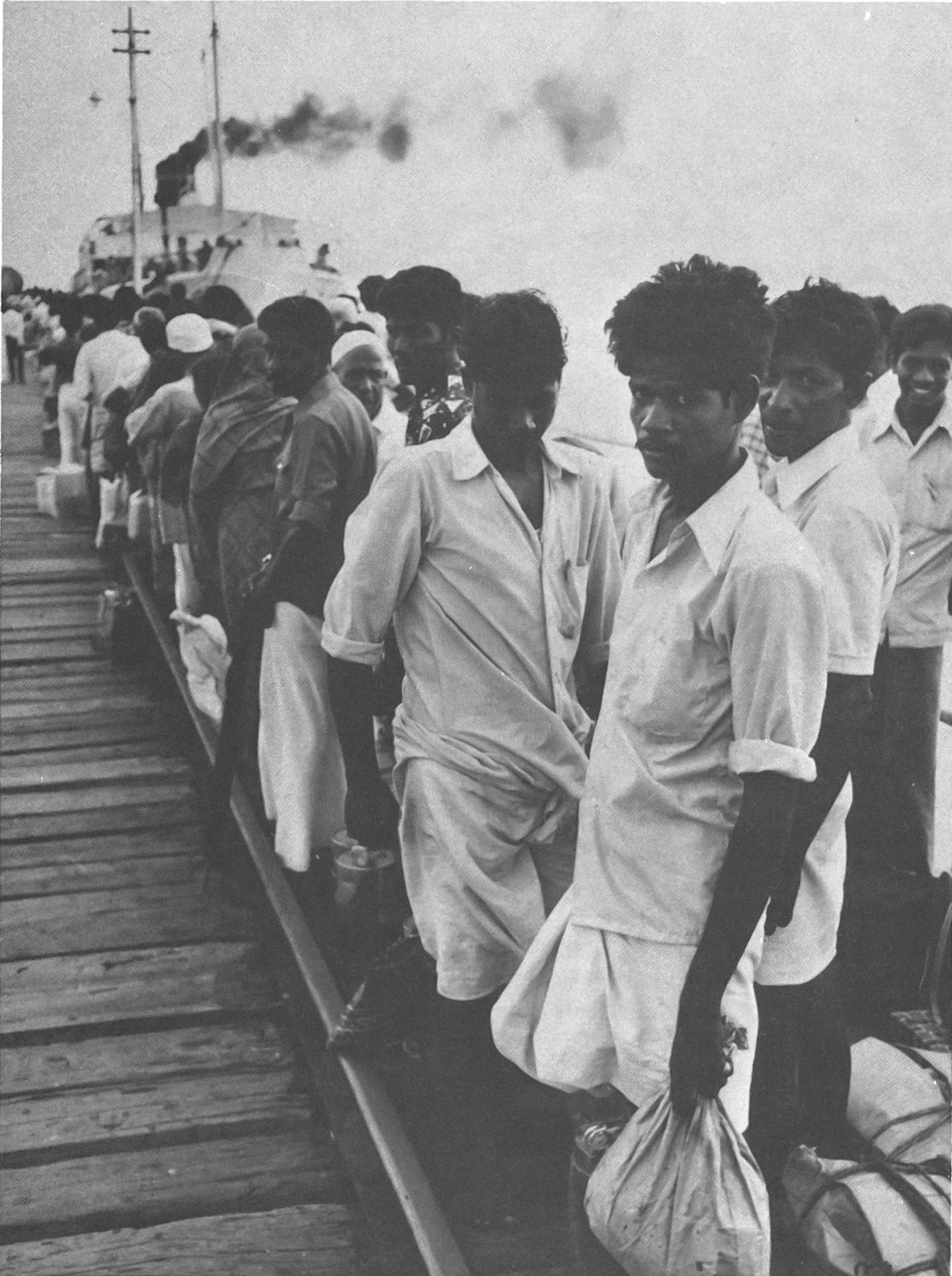
Rückwanderer warten darauf, die Fähre besteigen zu können