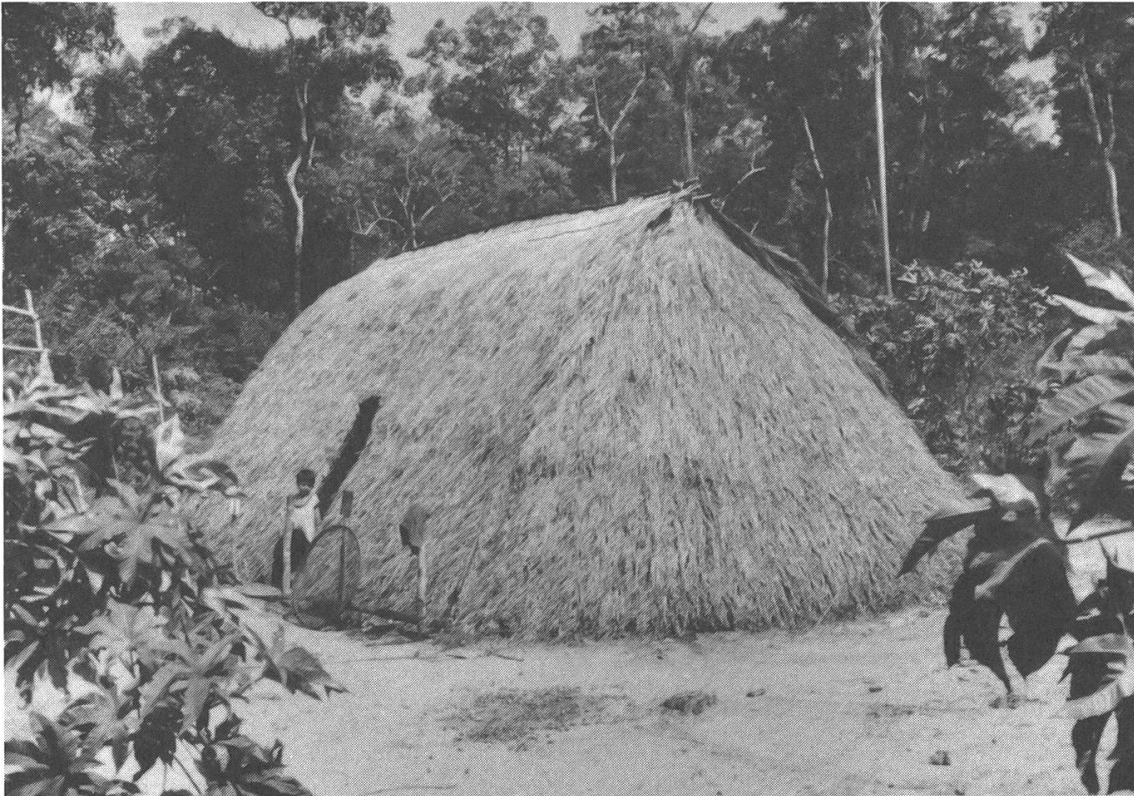
Das traditionelle Langhaus der Paĩ.

men sowohl Männer als auch Frauen und Kinder teil, solche, die im mba'e pepy mitgearbeitet haben, und auch solche, die es, aus welchen Gründen auch immer, nicht taten. Das mba'e pepy ist eine einfache Form zur Leistung gemeinschaftlicher Arbeit, wie sie auch in anderen Kulturen beobachtet werden kann. Obwohl in erster Linie wichtig für die Rodungsarbeiten, wird das mba'e pepy ebenfalls angewendet für die nachträgliche Reinigung der Felder, für den Hausbau und in neuerer Zeit ebenfalls für die jährliche Reinigung der Grenzlinien der Kolonien und für das Öffnen von neuen, befahrbaren Wegen.