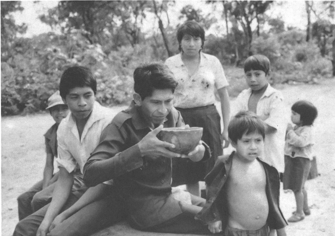
Der junge mburuvixa von Cerro Ñkangue trinkt kanguĩ (Maisbier).

Teilnehmenden der Gruppe bekannt, wieviel Neuland er gerodet und wieviel Brachland ( kokuere ) er gereinigt haben will. Einige benötigen vielleicht nur eine halbe Hektare, die meisten um die zwei Hektaren. Beim mburuvixa können es bis zu fünf Hektaren sein. Die Arbeitsgruppe bleibt nun während der Rodungszeit zusammen und geht von Haus zu Haus, um die geplanten Arbeiten nach und nach auszuführen. Meistens steht den Arbeitenden dann in den jeweiligen Häusern auch Maisbier zur Verfügung, das von den Frauen zubereitet wurde. Nach der Rodungszeit löst sich die Gruppe auf und jede Familie bestellt und erntet ihre Felder selbst. Meistens wird dann auch ein Teil des Ertrages unter der Leitung des mburuvixa gemeinsam verkauft, da sich dadurch bessere Preise erzielen lassen. Die im Haus des politischen Führers gesammelten Reis-, Mais- und Bohnensäcke sind jedoch individuell gezeichnet, so dass jedermann auch nur das verkauft, was er produziert hat.