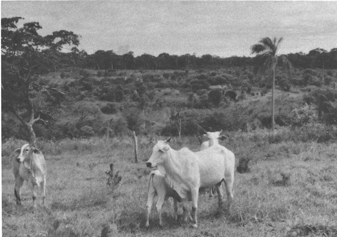
Weniger Jagd, dafür mehr Haustiere. Kühe in Cerro Ākangue.