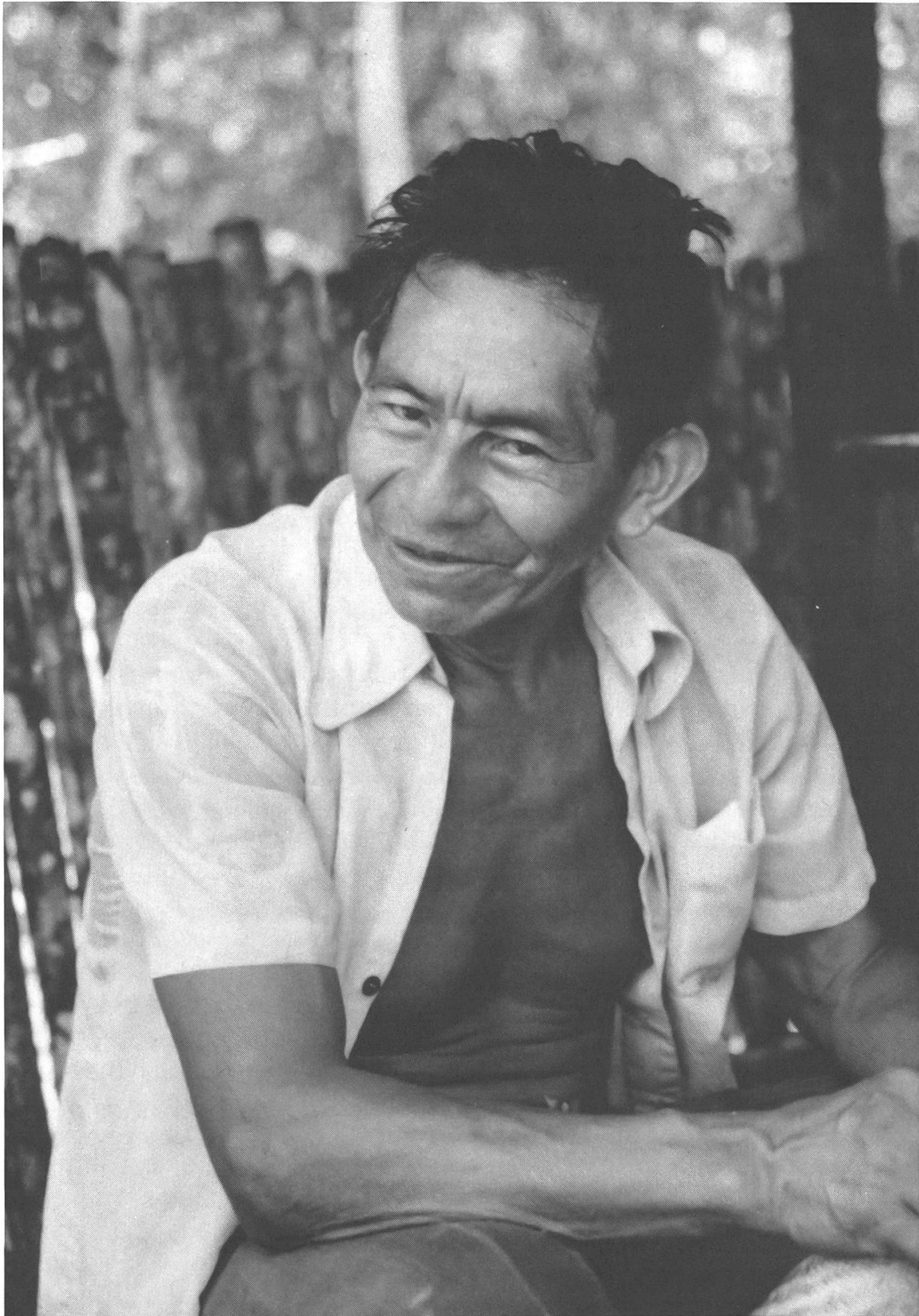
Der politische Führer der erst 1986 entstandenen Kolonie Pikykua.