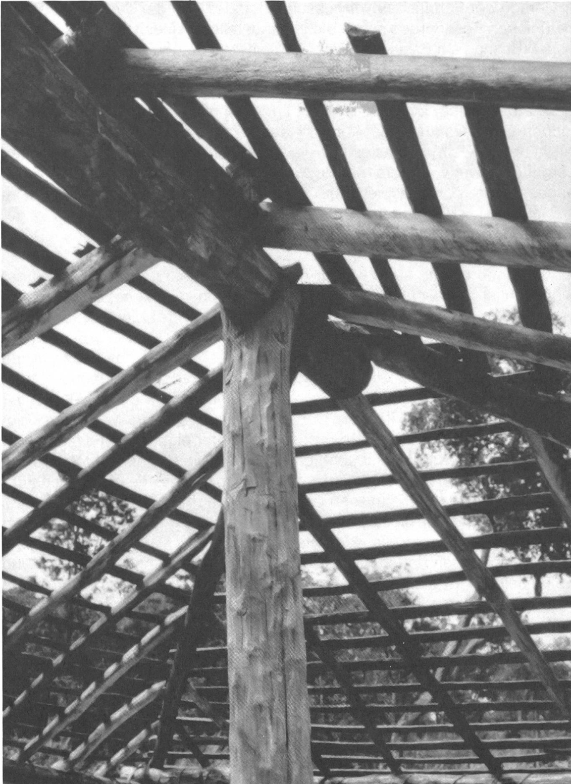
Nach mehr als dreissig Jahren bauen die Paĩ von Cerro Ākangue wieder ein Initiationshaus.