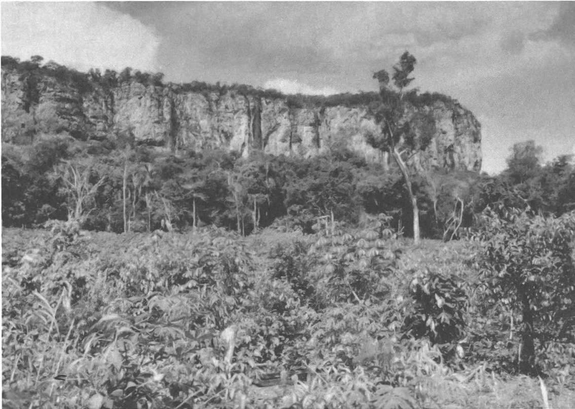
Maniokfeld der Paĩ. Im Hintergrund der Cerro Aratã .

beispielhaft für andere Gruppen, während andere Kolonien über mehrere Jahre hinweg in sozialen Konflikten verfangen blieben, ohne den richtigen Weg zu finden. Ziel der Rekonstruktionsphase war durchgehend die Schaffung von stabilen sozio-ökonomischen Strukturen, die erst eigentlich eine effektive Landnahme garantierten, indem sie die Verletzlichkeit der Gemeinschaften gegen aussen herabsetzten. Erfahrungen zeigten sehr bald, dass nur eine einigermaßen homogene und gut geführte Gemeinschaft sich gegen nach wie vor stattfindende Übergriffe von aussen (Stichwort: klandestine Besiedlung durch Weisse, Holzraub, Wirken von Händlern) schützen konnte.