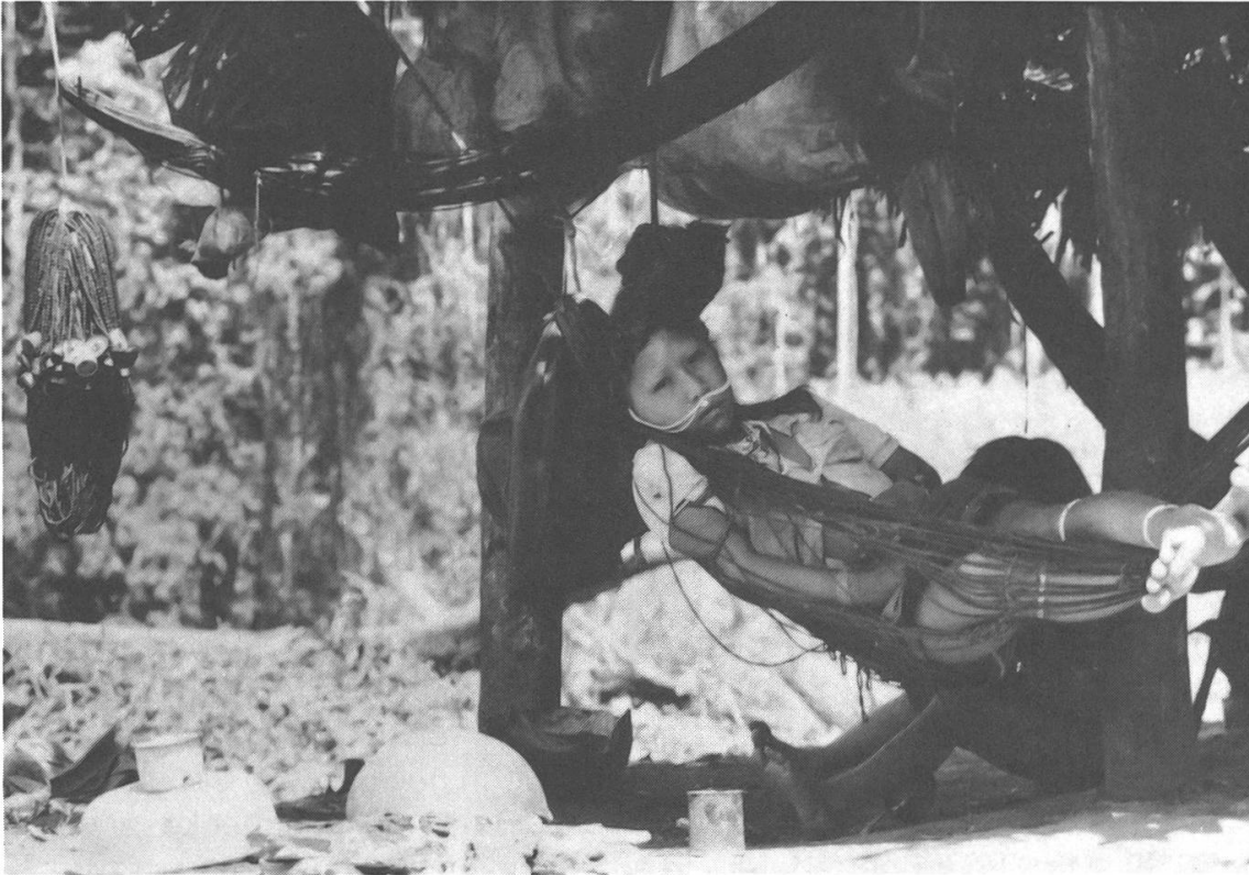
Abb. 2. Krankes Yura-Mädchen in seiner Hängematte (Putaya, September 1986).

Überrumpelt flohen die Yura in die Wälder, wobei sie Pfeil und Bogen zurückliessen. Die Strafexpedition fasste zwei Yura-Männer, die von Gewehrkugeln in den Beinen getroffen worden waren. Erst dann realisierten die Mastanahua-Yaminahua-Männer, dass ihre Sprache mit derjenigen der Yura identisch war. Auf Befehl des patróns, riefen sie in den Wald, um die fliehenden Yura unter dem Versprechen von Geschenken zur Umkehr zu bewegen. Etwas später erschien eine kleine, erschreckte Gruppe von Yura. Dies war ein entscheidender Augenblick, der sich als für die Yura fatal erweisen sollte.