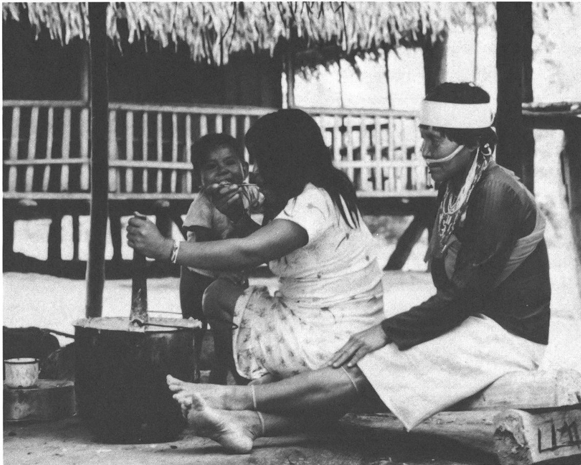
Abb. 1. Zwei Yaminahua-Frauen auf einer Bank sitzend. Die ältere Frau (rechts im Bild) trägt den traditionellen Bambus-Kopfreif (Paititi, September 1986).

takte mit den Mastanahua und zogen deshalb in die Nähe von Esperanza. Etwa um 1975 verliessen einige Mastanahua-Familien das Purús-Gebiet und begaben sich auf die Missionsstation von Sepahua. Ende 1950 anfangs 1960 hatten Dominikanermissionare Kontakt zu den zahlreichen Gruppen vom Mapuya aufgenommen, welche dauernd die bereits kontaktierten Amahuaca-Siedlungen überfielen. Eine kleine und erst kürzlich kontaktierte Yaminahua-Gruppe liess sich im Sepahua nieder, wurde aber von den dort siedelnden Amahuaca fast völlig aufgerieben.