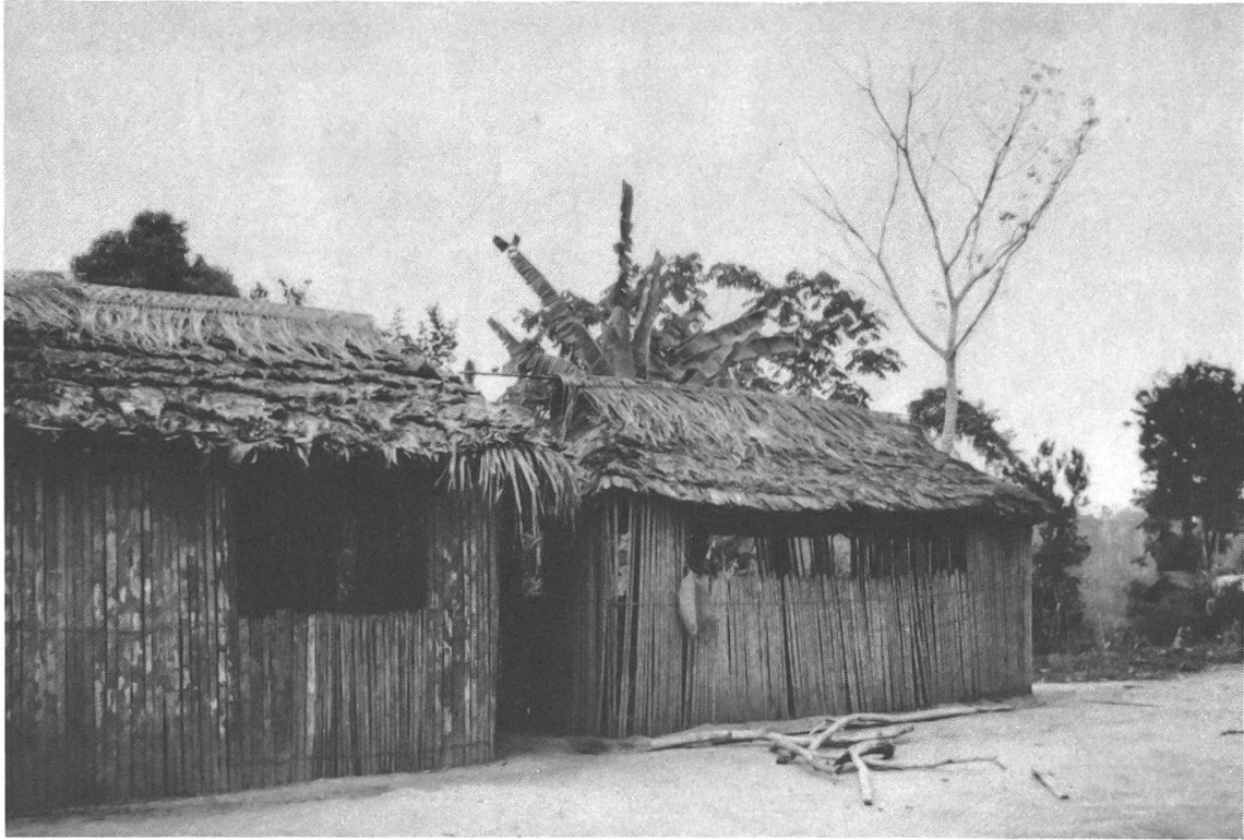
Häuser in Chokori'ari .