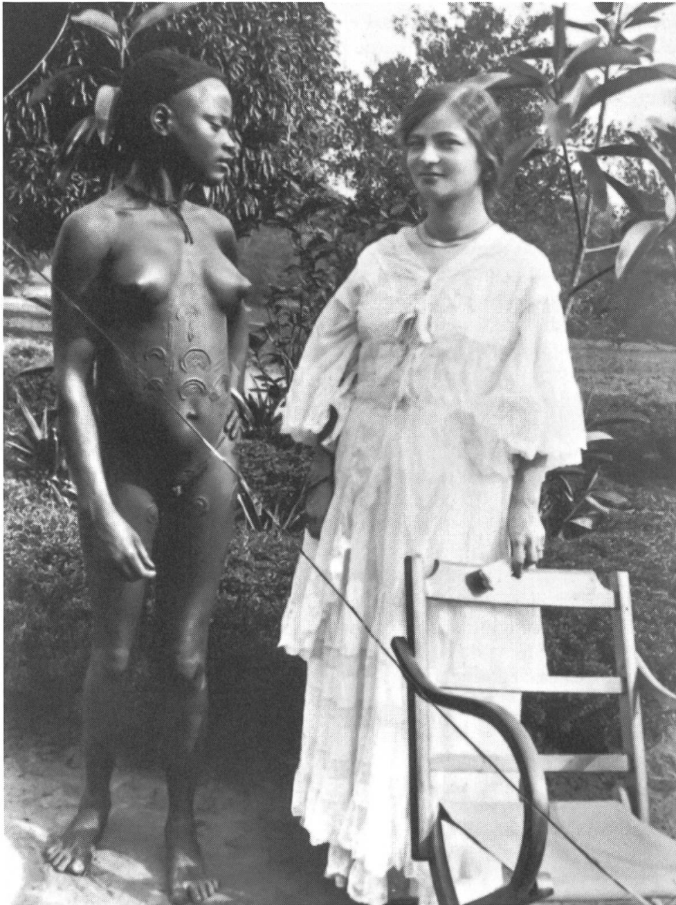
Francesco Milani, Congo belge, vers 1910, tirage moderne d'après plaque, 24 x 30 cm. Musée de l'Elysée, Lausanne.

Par la confrontation de cultures, beaucoup de photographies de caractère ethnographique ont une charge symbolique très grande.