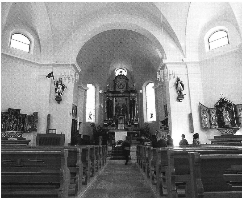
Autel du XVe siècle