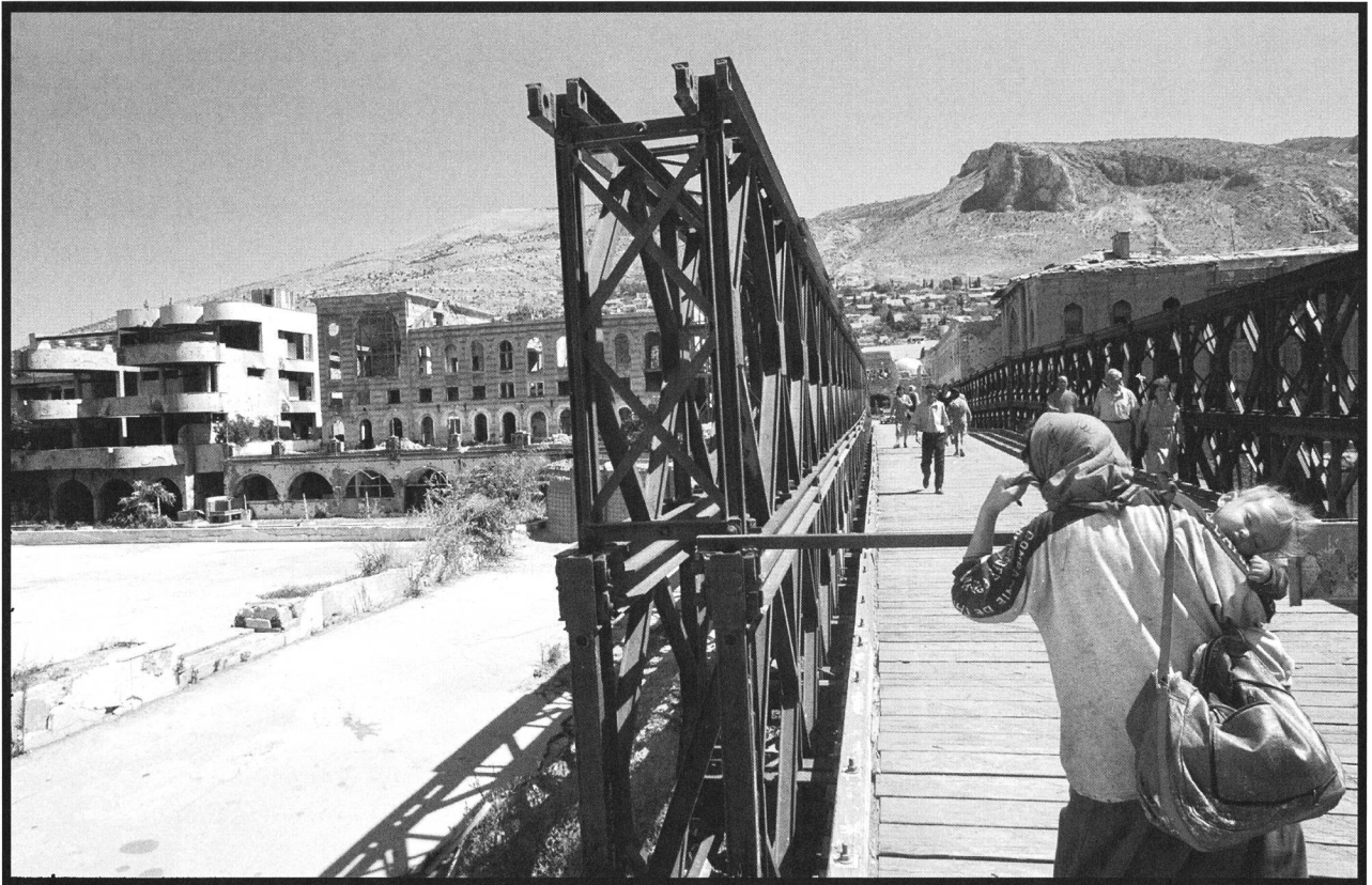
Partie est (musulmane) de Mostar, août 1998