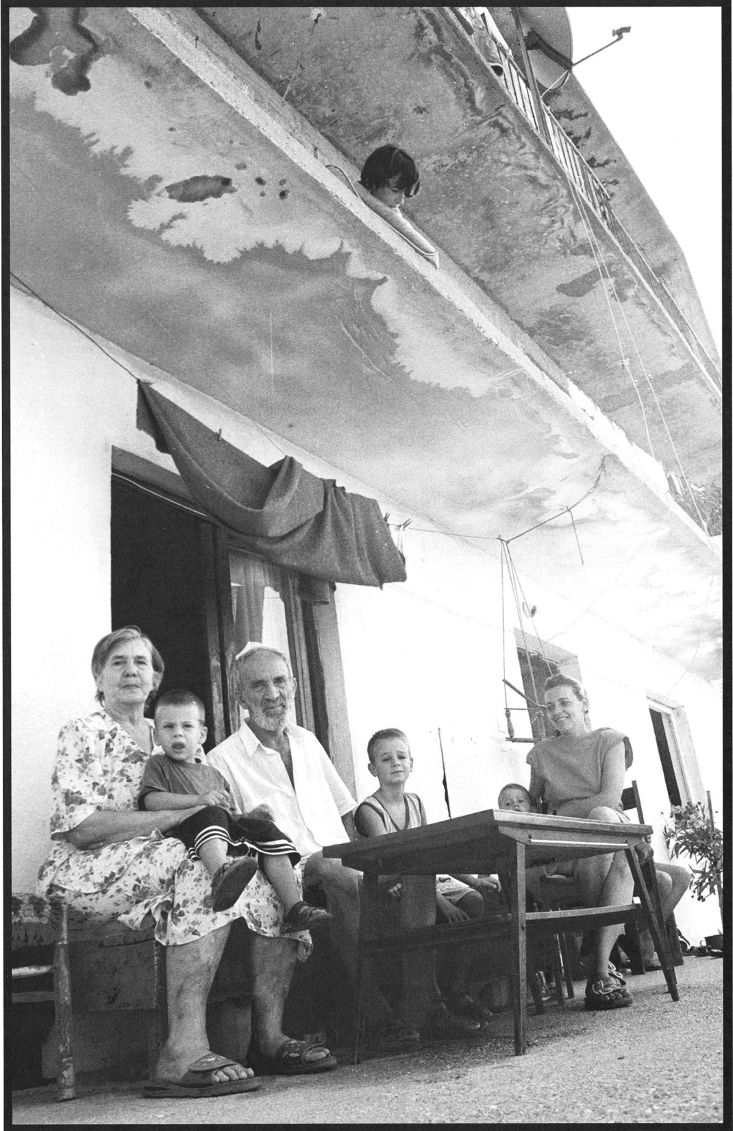
Famille déplacée, Mostar, août 1998