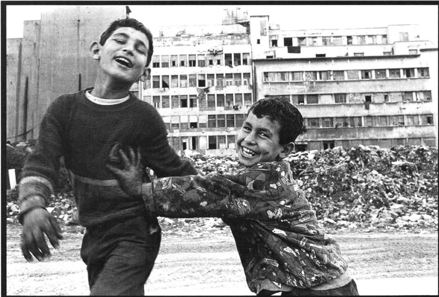
Beyrouth, Liban, décembre 1994