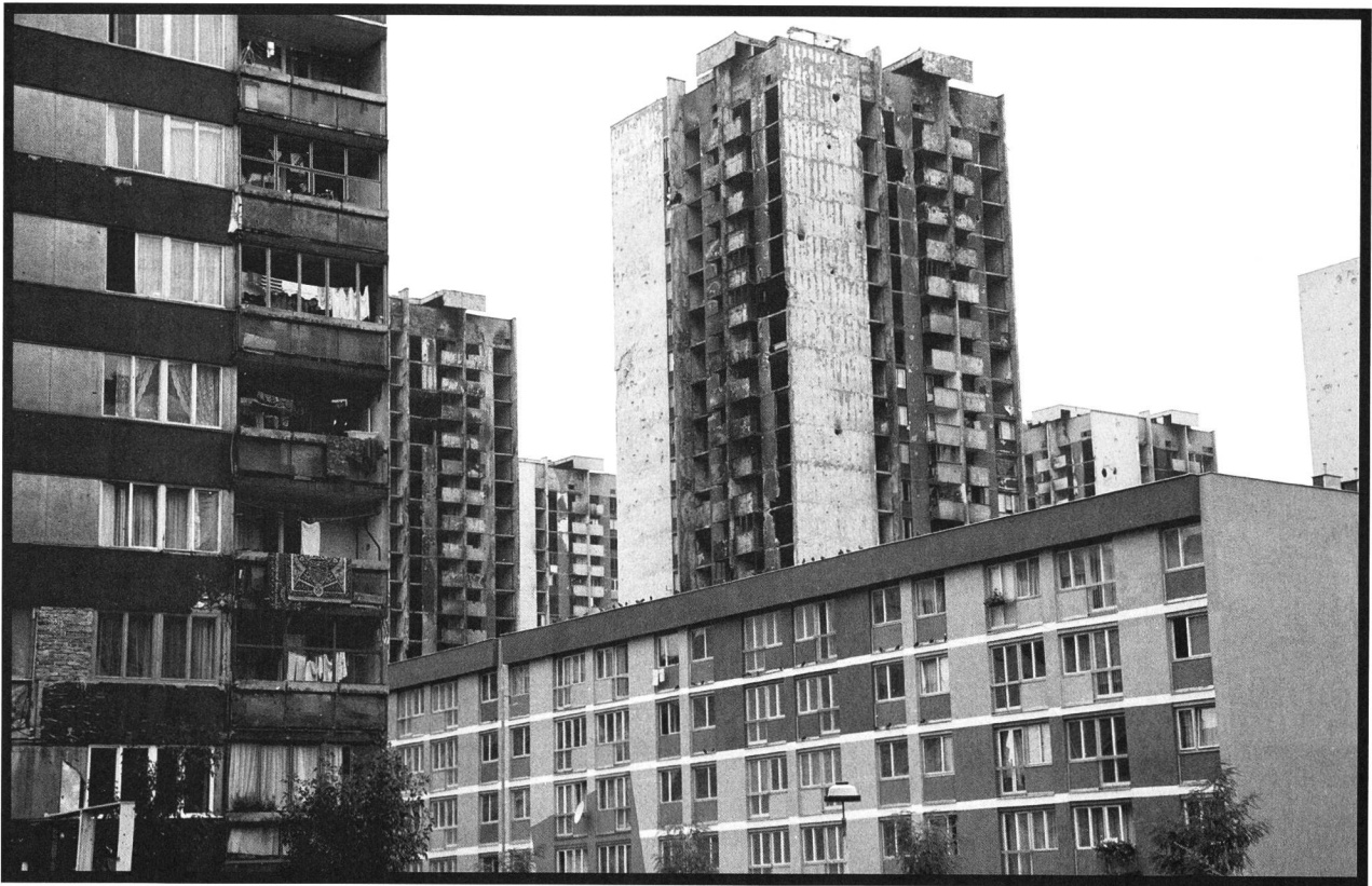
Sarajevo, centre de la ville, août 1998