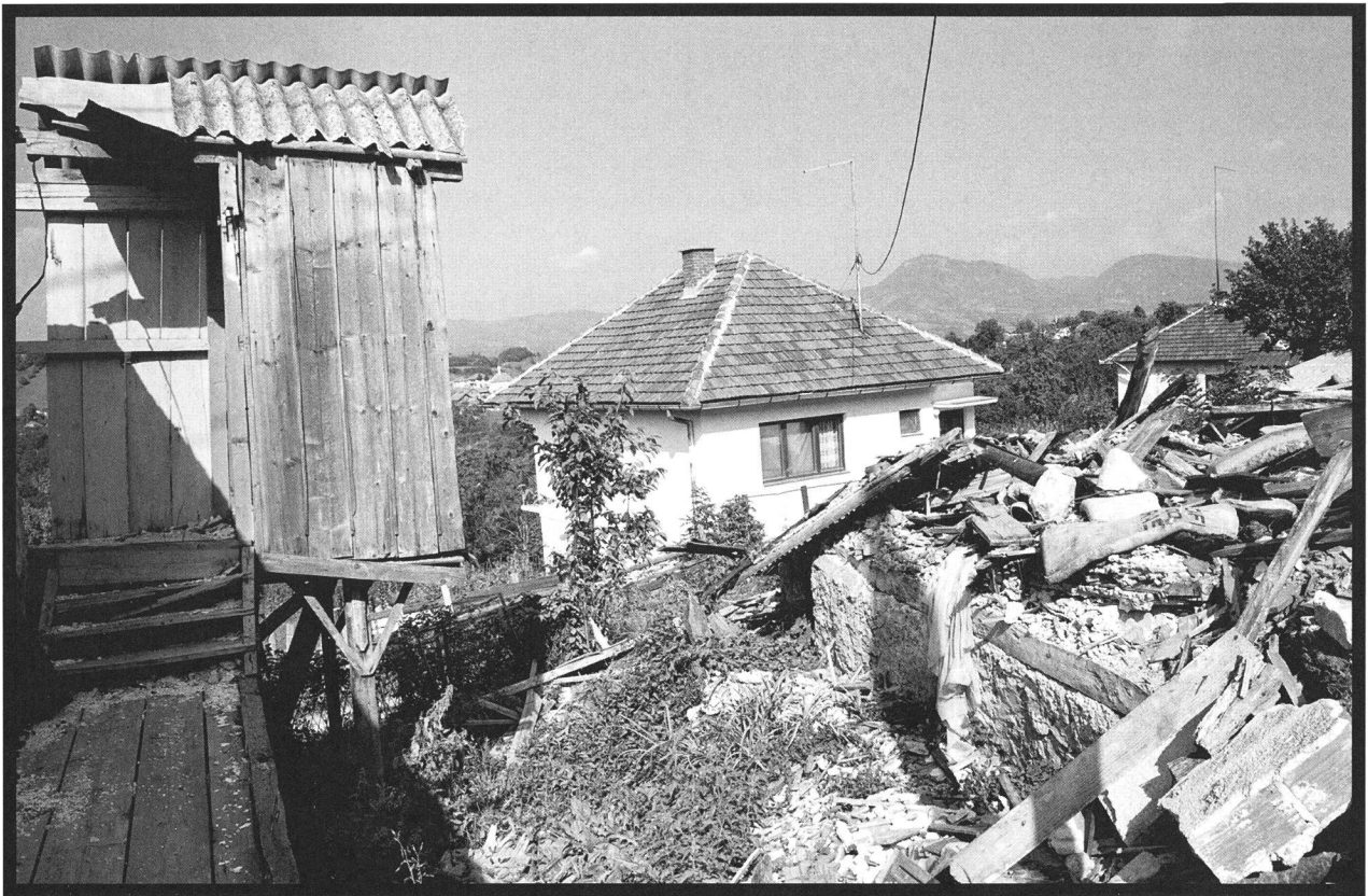
Village de Prusac, près de Donji Vakuf, août 1998