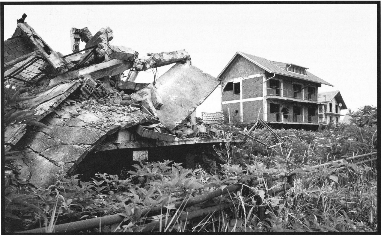
Ilidza, banlieue de Sarajevo, août 1998