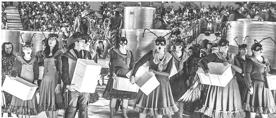
Figure 2 : fourmis choristes

des cors des Alpes. Le metteur en scène refusant les micros posés sur scène, les sondier·ère·s re-conçoivent l'équipement et fixent des micros sur les instruments, mais, ne disposant plus de micros sans-fil, les musicien·ne·s doivent s'adapter et emmener avec eux câbles, micro et cor lorsqu'ils entrent et sortent de scène.