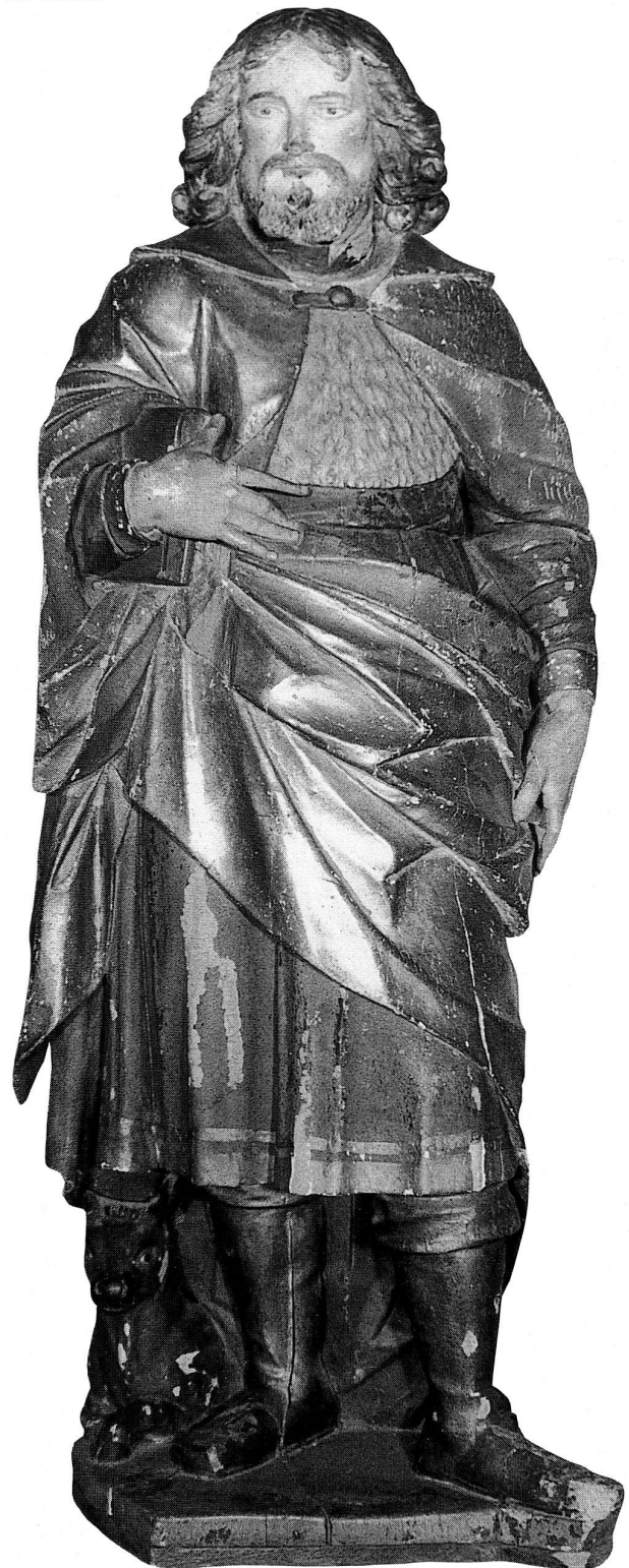
Abb. 3 Hl. Lukas

Nussbaumersche Sammlung (alt Regierungsrat Silvan C. Nussbaumer sel. und Verwandte), bestehend aus 30 zinnernen und 2 kupfernen Gegenständen sowie 4 Silberlöffeln und 1 vergoldeten Silberlöffel.