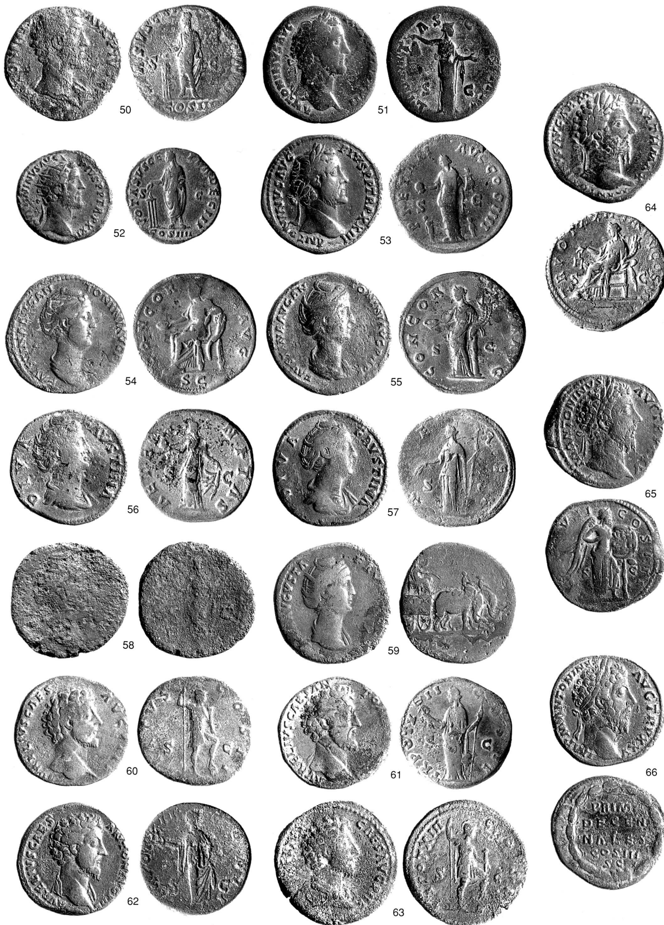
Taf. 3 Römische Fundmünzen aus dem Kanton Zug. 50–66 Risch-Ibikon. Massstab 1:1.