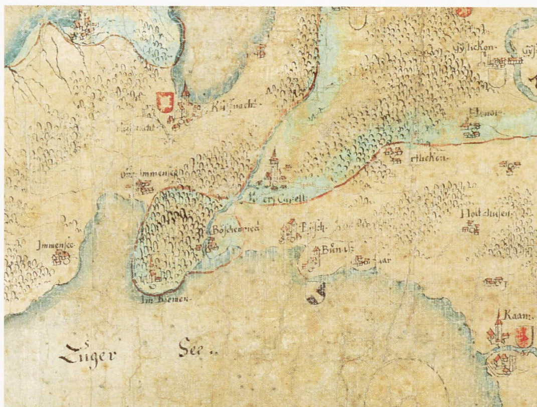
Abb. 1 Buonas und das Fahr um 1600. Ausschnitt aus der Luzernerkarte von Hans Heinrich Wägmann und Renward Cysat.