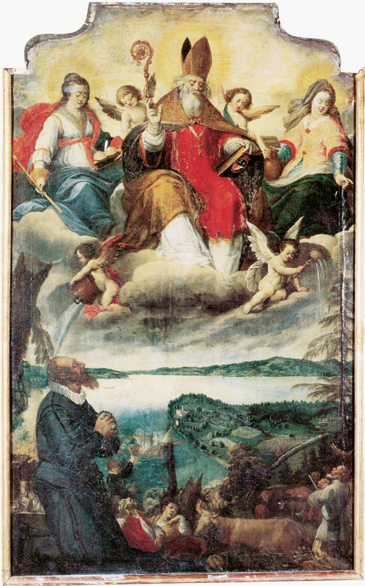
Abb. 10 Buonas, Kapelle St. German. Hauptgemälde des Hochaltars. Der hl. German mit dem Stifter. Um 1633/1690.