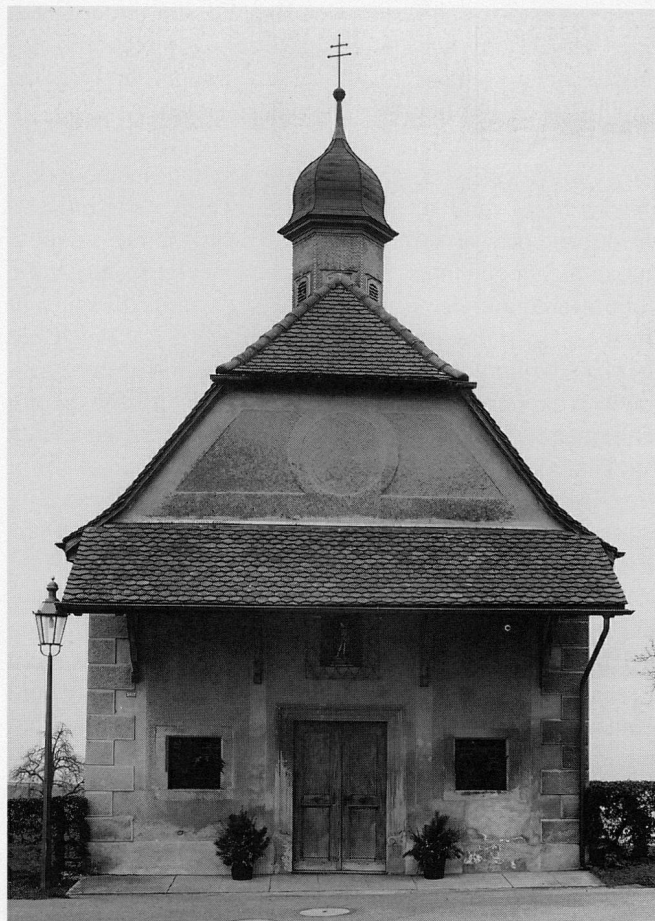
Abb. 3 Buonas, Kapelle St. German. Ansicht der Hauptfassade von Westen, vor der Restaurierung, 1992.

Eine weitere Renovation fand 1889 unter der Leitung des Zuger Architekten Dagobert Keiser des Älteren statt. 24 In dieser Zeit erhielt die Kapelle das historistische Aussehen, das sie bis in die Gegenwart beibehielt. Die Fassaden wurden mit einem Besenwurf verputzt, die Dachuntersichten holzverschalt, ein neues Vordach entstand, grau-grün marmorierte Altäre mit roten Füllungen standen auf einem grauen, gemusterten Zementbelag. Das Krallentäfer an den Seitenwänden ersetzte ein älteres und sollte die wegen des äusseren Zementputzes stark eindringende Feuchtigkeit abhalten. Der Dachreiter dürfte in seiner heute sichtbaren Form ebenfalls in dieser Bauperiode entstanden sein. Für das Jahr 1916 sind neue Dachkännel erwähnt.