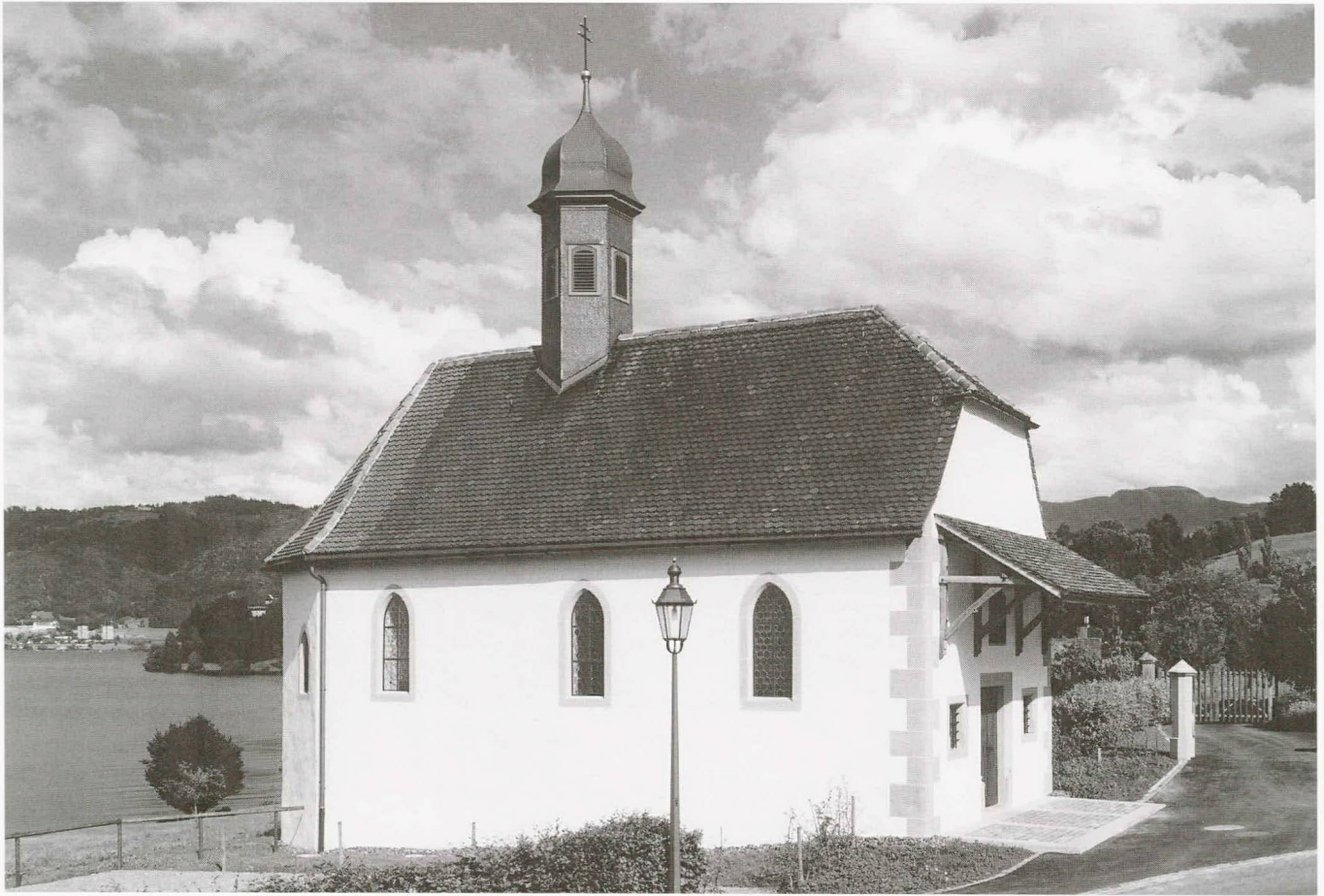
Abb. 4 Buonas, Kapelle St. German. Die Kapelle von Nordwesten nach der Restaurierung, 1993.