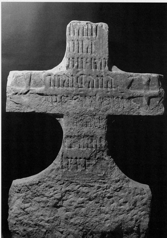
Abb. 7 Buonas, Kapelle St. German. Gedenkkreuz von 1480 nach der Restaurierung.

nachweisen. Der Stipes war durch verschiedene, auswechselbare Antependien geschmückt. Für 1658 ist die Anschaffung eines weiss gemalten, für 1690 ein Lederantependium überliefert.