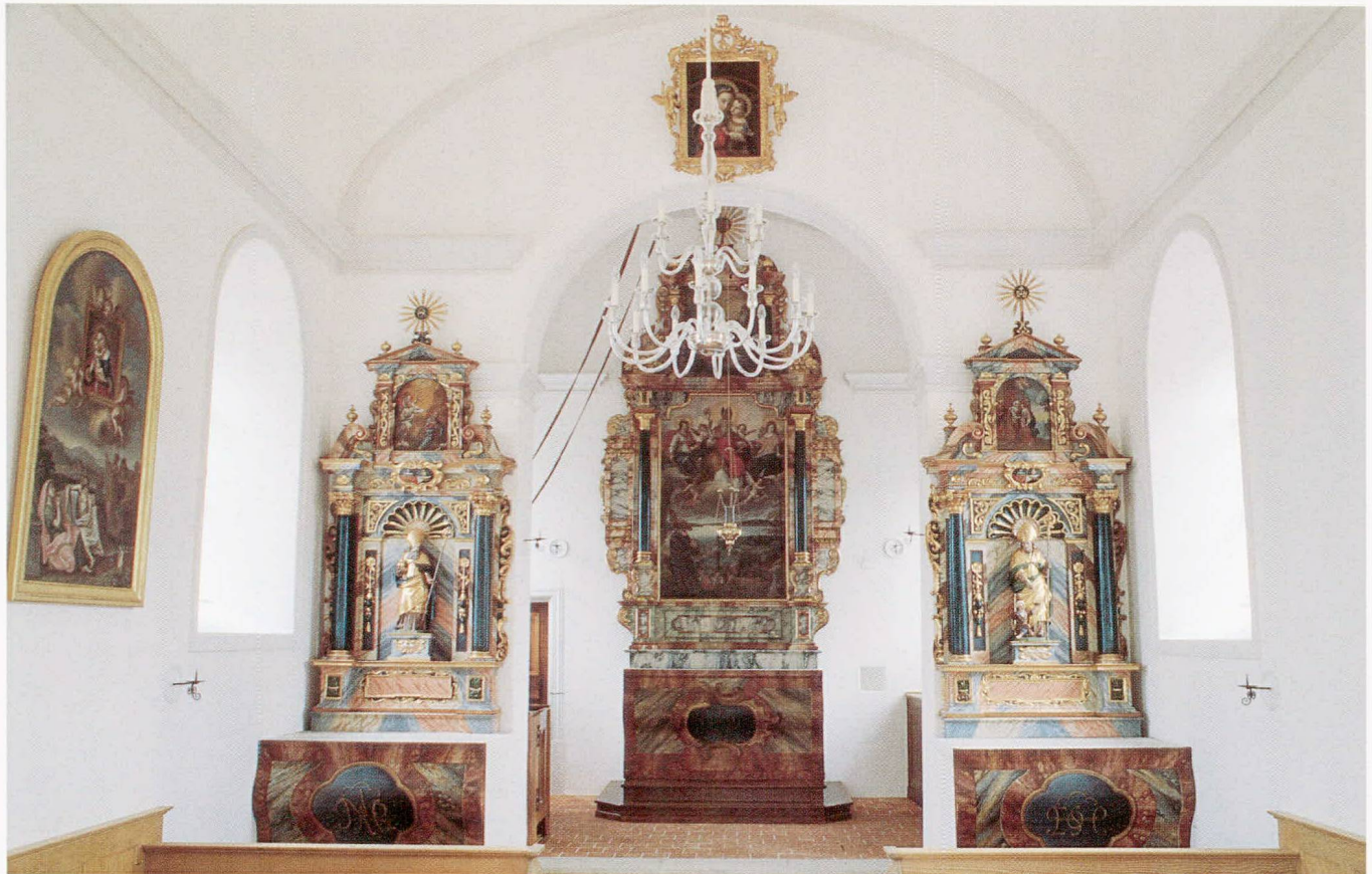
Abb. 5 Buonas, Kapelle St. German. Ansicht Richtung Chor nach der Restaurierung, 1993.