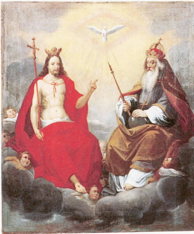
Abb. 11 Buonas, Kapelle St. German. Obstückgemälde des Hochaltars. Die hl. Dreifaltigkeit. Um 1633.

stein-Cloos, wie die Seitenaltäre. Im Obstück thront die Heilige Dreifaltigkeit inmitten von Engeln auf einem Wolkenkranz (Abb. 11). Das Hauptbild gibt den Blick frei in die weite Landschaft am Zugersee, überhöht zwar, aber so,