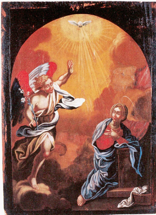
Abb. 9 Buonas, Kapelle St. German. Obstückgemälde des linken Seitenaltars. Verkündigung an Maria. Um 1670.

ler schreibt, sondern als Tonne ausgebildet sogar über das aktuelle Gewölbe hinwegzog, konnte der Hochaltar durchaus schon zur Bauzeit in der Kirche aufgestellt gewesen sein.