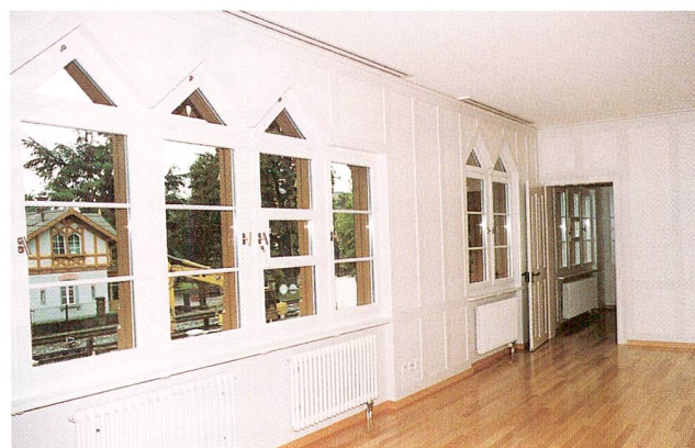
Abb. 3 Cham, Gärtnerhaus, Blick in den Mittelraum des I. Obergeschosses nach der Restaurierung 1995.

Ganz ähnliche Riegelgebäude waren damals als «Schweizerhäuser» populär. Ein solches liess Arnold Staub, dessen Vater aus der Schweiz nach Baden-Württemberg übergesiedelt war, auf dem Areal seiner mechanischen Baumwollspinnerei und Weberei Staub & Co. Kuchen, zwischen Göppingen und Geislingen in Baden-Württemberg errichten. 4 Es entstand 1864 ausdrücklich als «Schweizerhaus» und enthielt vier symmetrisch angelegte Wohnungen für kleinere Arbeiterfamilien, mit je einem Wohnraum im Erdgeschoss, der ebenfalls als Entrée diente