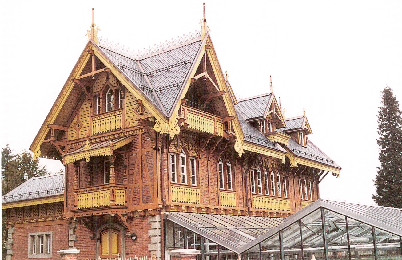
Abb. 2 Cham, Gärtnerhaus, Ansicht von Südwesten nach der Restaurierung 1995.

Architekturexport nach England und Architekturrückimport aus Frankreich sind vielfältig zu spüren. Offensichtlich hat sich der Architekt nicht nur vom zeitgenössischen Holzbaustil inspirieren lassen, er hat sich auch in Paris umgesehen, jedenfalls war ihm das Chalet von Haret, das dieser an der Exposition universelle 1867 in Paris gezeigt hat und das von César Daly 1872 publiziert worden war, bekannt. 2 Noch genauer hielt er sich an die Tafel 16 im Buch von Léon Isabey und Le Blan, wo die beiden Architekten einen «cottage anglais» vorstellen, «qui, au lieu d'être tout à fait moderne, est assez ancien, presque gothique encore, et à sa construction, où le bois a été davantage employé; seulement, ici, les colombages sont en briques... et des croix de Saint-André occupent tous les intervalles des poteaux. La couverture, exécutée aussi dans un goût ancien, est en ardoises de deux tons, disposées de manière à figurer des chevrons héraldiques. Ce genre de maisons, ainsi que nous avons eu soin de l'indiquer sur notre planche, produit son