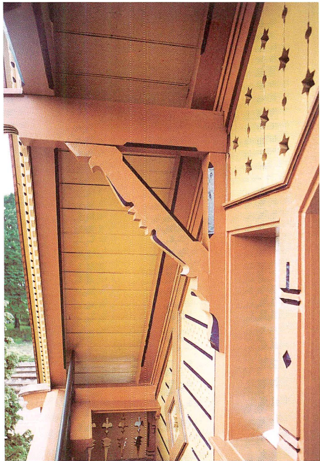
Abb. 5 Cham, Gärtnerhaus, Detail des polychrom bemalten Holzwerks nach der Restaurierung 1995.

delliert werden, wenig wurde in Bolliger-Sandstein ersetzt. Der Gebäudesockel wurde mit Randschlag gekrönelt.