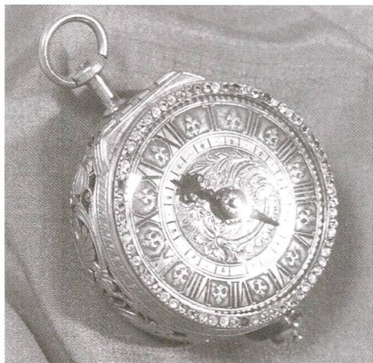
Abb. 4 Einzeigerige Taschenuhr, erste Hälfte des 17. Jahrhunderts, vermutlich von Johann Bengg.

bedeutende Zuger Uhren erwerben. Die einzeigerige Taschenuhr besteht aus einem runden feuervergoldeten Kupfergehäuse, das zur Gänze ornamental ziseliert ist. Die Wandung wird durch Blumenmotive durchbrochen, die Lünette ist mit Steinen besetzt. Römische Stundenzahlen alternierend mit der Lilie schmücken das silberne Zifferblatt, der Stundenzeiger ist aus Eisen. Im Werk aus feuervergoldetem Messing sorgt die Schnecke, durch eine Kette mit der Federtrommel verbunden, dafür, dass die Uhr stets mit gleichem Antrieb läuft. Mit ihrer Glocke schlägt sie zu jeder Stunde. Sie ist auf der Rückplatte mit «JB Zug» signiert. Eine Uhr mit der gleichen Signatur ist im British Museum in London ausgestellt. Das Monogramm J.B. könnte das von Johann Bengg, dem Sohn des Uhrmachers Paul Bengg, von dem im Museum eine Halsuhr ausgestellt ist, sein. Von ihm ist zwar nicht bekannt, ob er den gleichen