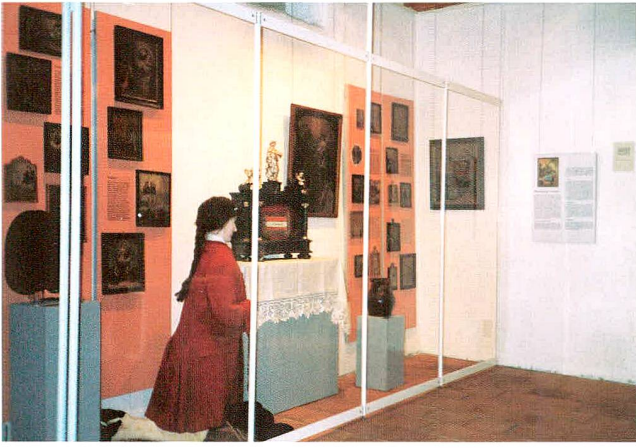
Abb. 1 Ausstellung «Die heilige Verena und ihre Votivbilder in Zug».

St.-Verena-Kapelle oberhalb von Zug gebracht wurden. Die Bilder sind nicht nur Zeugen menschlicher Sorgen und Nöte, sondern geben auch wertvolle Informationen zur Kostüm-, Sozial- und Medizingeschichte.