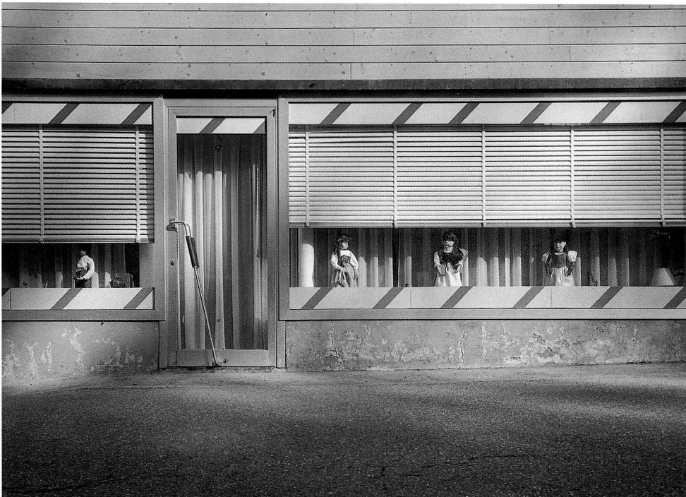
Abb. 2 «Im Schluenloch». Die ehemalige Post von Alosen.