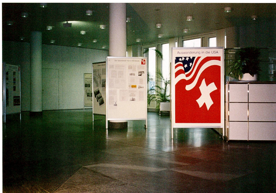
Abb. 2 Die grosse, dem Staatsarchiv unmittelbar vorgelagerte Eingangshalle des Verwaltungsbauwerkes «An der Aa» bietet sich für Ausstellungszwecke geradezu an. 1995 gestaltete Urspeter Schelbert am Beispiel der sechs Geschwister Iten, genannt Grab-Beters, die 1855 und 1866 von Unterägeri nach Minnesota gezogen waren, das Thema «Auswanderung in die USA».

Jegliche Geschichtsschreibung ist nur auf der Grundlage erschlossener Archive möglich. Und umgekehrt führt die natürliche Beziehung zwischen Archiv und Geschichte gerade in Nicht-Universitätskantonen wie Zug dazu, dass das kantonale Archiv subsidiär die Rolle des regionalen historischen Forschungszentrums übernimmt. Vor diesem Hintergrund wird es verständlich, dass das Staatsarchiv in Bezug auf seine Verpflichtung, die zugerschen Gemeinden in Archivfragen zu beraten, den Schwerpunkt zunächst einmal auf die Ordnungs- und Erschliessungsarbeit im historischen Archivbereich legte. Seit 1985 wurden oder werden die in vereinzelt Fällen bis ins 13. Jahrhundert zurückreichenden Bestände von mehr als einem Dutzend gemeindlicher Archive in Zug, Baar, Cham, Hüenberg und im Ägerital geordnet, neu verpackt, signiert und durch detaillierte Verzeichnisse für die rasche Informationssuche aufbereitet. Am erfolgreichsten verlaufen diese Arbeiten, wenn das Staatsarchiv als Projektleiter und nicht nur als punktueller Berater auftreten kann: Das Staatsarchiv gibt eine verbindliche Zeit- und Kostenschätzung ab, vermittelt einen Bearbeiter, führt diesen Bearbeiter und stellt sein eigenes methodisches Wissen und seine Infrastruktur