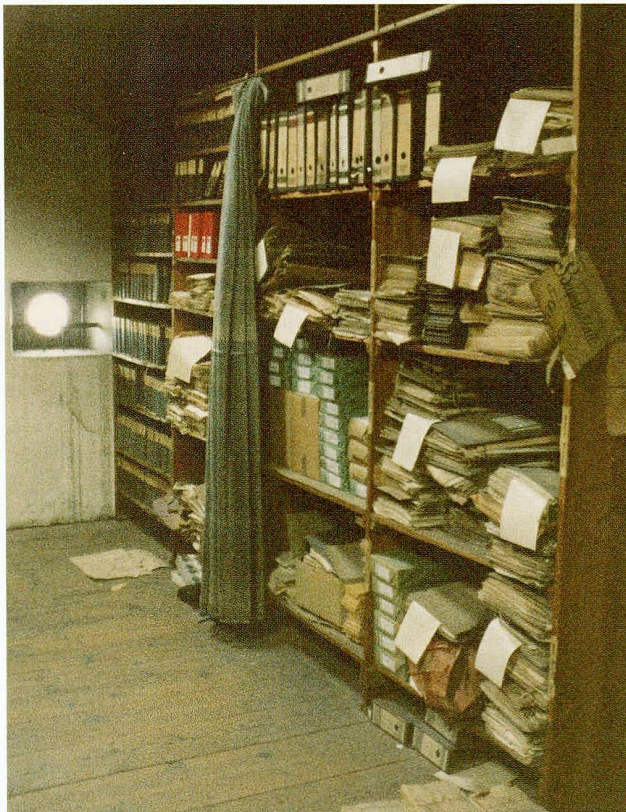
Abb. 1 1983 erhielt das Staatsarchiv im um- und ausgebauten Estrich des Regierungsgebäudes zwei Magazinräume mit einer Lagerkapazität von maximal 500 Laufmetern. Für die heikle Entrümpelung dieses Estrichs, der seit über hundert Jahren als Stauraum für Druckschriften, Akten und anderes mehr genutzt worden war, hatte im Jahr zuvor das Staatsarchiv die Verantwortung übernommen.

auch sehr langsam, stockend und nicht ohne Rückschläge. Insgesamt konnte man nach den ersten fünf Jahren der professionellen Betreuung des Staatsarchivs bilanzieren, dass die archivinterne Organisation methodisch und arbeitstechnisch gefestigt, die Arbeitsfelder abgesteckt und die Prioritäten gesetzt waren. Die konkrete Umsetzung hingegen steckte in fast allen Bereichen noch in den Anfängen oder war sogar erst im Keim angelegt. Was aus dieser Disposition in den letzten zwanzig Jahren herausgewachsen ist, sei im Folgenden für einige ausgewählte Felder in knappen Strichen skizziert.