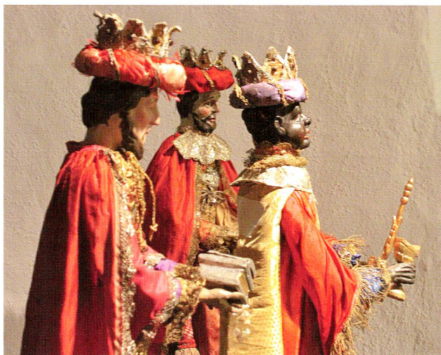
Abb. 9 Ausstellung «Vom Stern geführt. Unterwegs mit den Drei Königen». Krippenfiguren aus einer Ostschweizer Pfarrei, um 1800, Sammlung Kloster Einsiedeln.