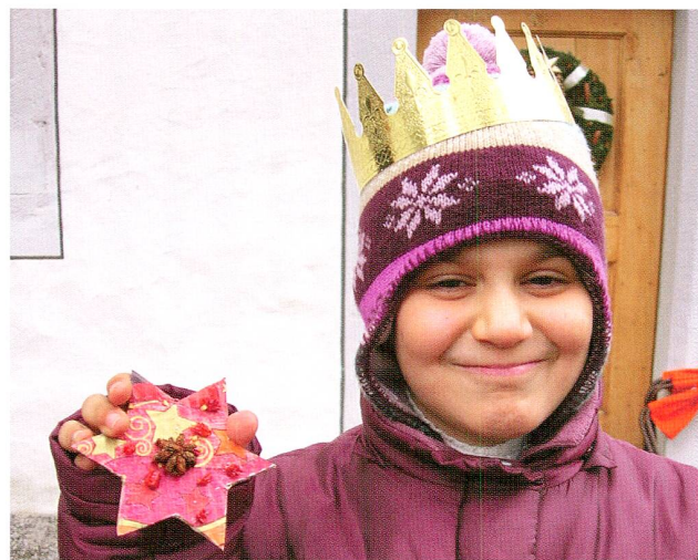
Abb. 10 «Gold, Weihrauch und Gewürzsterne» lautete das Thema des ausstellungsbezogenen Workshops. Vom Stern geführt und von den Gewürzen der Drogerie Luthiger in der Burg inspiriert, entstanden duftend-funkelnde Kleinode.

Museums wurden schliesslich die attraktiven Räumlichkeiten der Burg für Anlässe Dritter vermietet, dies auch zur Erhöhung der Eigenwirtschaftlichkeit.