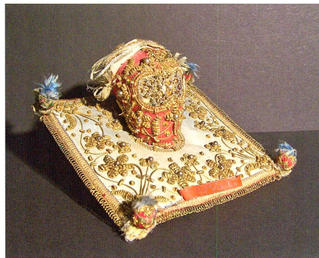
Abb. 2 Miniatur-Schädelreliquiar, 17. Jahrhundert. Privatbesitz, Höhe 5,5 cm.