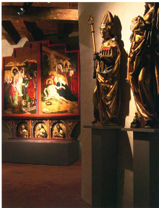
Abb. 5 Die gotischen Highlights sind neu im ersten Stock ausgestellt – nicht mehr als wissenschaftliche Schausammlung, angeleuchtet mit Tausenden von Watt, sondern stimmungsvoll inszeniert. Das gotische Tödlein schaut eindringlich hinter der Schildmauer hervor (links), während der Altar von Hünenberg nun in geschlossenem Zustand zu sehen ist, so wie er sich ursprünglich fast während des ganzen Kirchenjahres präsentierte (rechts). Auf diese Weise kann auch am meisten Originalsubstanz gezeigt werden. Im Raum, der sich der Stimmung eines gotischen Sakralraums nähert, ist gregorianischer Choralgesang zu hören. Die Besucherinnen und Besucher sollen auch emotional angesprochen werden und sich gerne im Raum aufhalten.