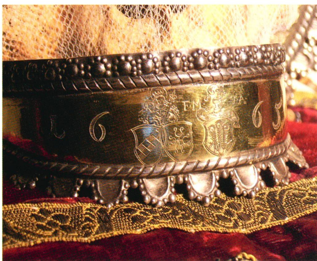
Abb. 1 Reliquienkrone aus dem Kloster Frauental, 1665. Privatbesitz. Höhe 32 cm. Gesamtansicht und Detail.