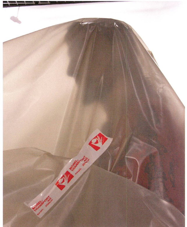
Abb. 3 Christusfigur auf dem gotischen Palmesel, einer Dauerleihgabe der Kirchgemeinde Baar, fein sauberlich eingepackt während den Umgestaltungsarbeiten.