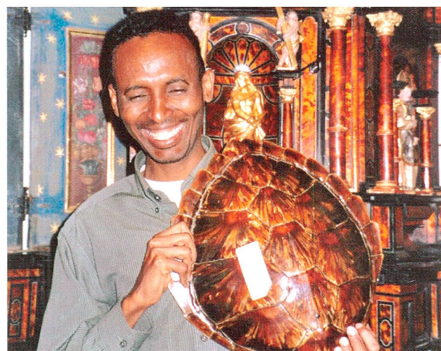
Abb. 12 Projekt «Deutsch lernen im Museum». Der junge Mann aus Somalia hat in der Burg Zug ein Stück Heimat gefunden. Der Schildkrötenpanzer stammt aus seinem Land und dient im Museum zur Veranschaulichung der Herstellung des barocken Tabernakels aus Schildpatt.