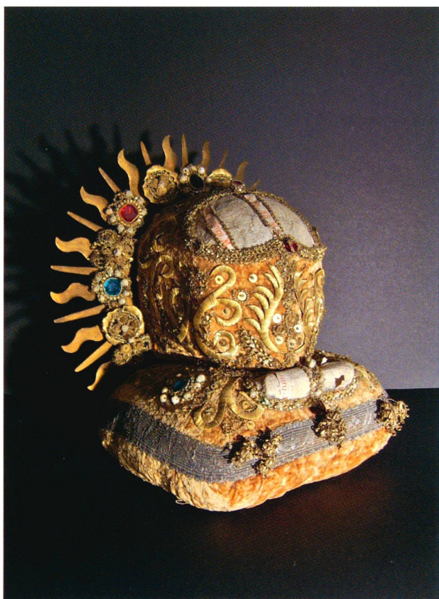
Abb. 3 Schädelreliquiar, 18. Jahrhundert. Privatbesitz. Höhe 26 cm.

Heiligenverehrung und Reliquienkult beginnen mit der Verehrung der Apostel- und Märtyrergräber in Rom in der institutionellen Entstehungsphase des Christentums und reichen über das Mittelalter mit seinem herrschaftslegitimatorischen und imperial-repräsentativen Reliquienkult (Karl der Grosse und die Pfalzkapelle in Aachen; die Sainte Chapelle in Paris als Reliquiar für die Dornenkrone Christi) bis ins Barockzeitalter, für dessen komplexe Weltdeutung und widersprüchliche Lebenserfahrung die kostbar gefasste, nun auch in der individuellen und privaten Frömmigkeit zentrale Reliquie ein Symbol von grösster Aussagekraft ist. Richtig verstanden erweisen sich die Reliquie und das Reliquiar als Schnittstelle von Tremendum und Faszinosum, Diesseitsfreude und Jenseitssehnsucht, Todesangst und Heilsgewissheit, Alltagsmüh und Glaubensfeier, Rechtgläubigkeit und Aberglaube, Gottvertrauen und Magie. Erst in diesem Zusammenhang erschliesst sich etwa auch die tiefere Bedeutung des Memento-mori-«Brauchtums», das bis in die heutige Fasnacht hineinreicht (weshalb deren Erwähnung oben nicht zufällig ist). Vom Barock führt die Linie weiter über säkularisierte Formen in der Zeit der Aufklärung und des Biedermeier wie den Napoleonkult oder die damals modische Aufbewahrung von Haarlocken und weiteren Memorabilia bis in die Gegenwart, in welcher der Handel mit Reliquien von Pop-, Sport- oder Filmstars zum ebenso einträglichen wie