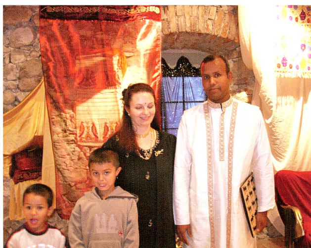
Abb. 11 Märchen verbinden Menschen aus aller Welt – und verzaubern, auch die Burg Zug. In Zusammenarbeit mit der Elternbildung der Frauenzentrale Zug wurden an zwei Sonntagnachmittagen Märchen aus sechs Ländern in der Originalsprache erzählt und dann übersetzt.

Dank der Unterstützung des Kantons und verschiedener weiterer Geldgeber sowie einem Schenkungsanteil gelangte Ende 2005 die bezüglich Qualität und Quantität bedeutendste Privatsammlung zugerischer Münzen und Medaillen, die Münzsammlung Luthiger, in den Besitz der Burg Zug. Damit konnte die Münzen- und Medaillesammlung des Museums zum wichtigsten Bestand zugerischer Prä-