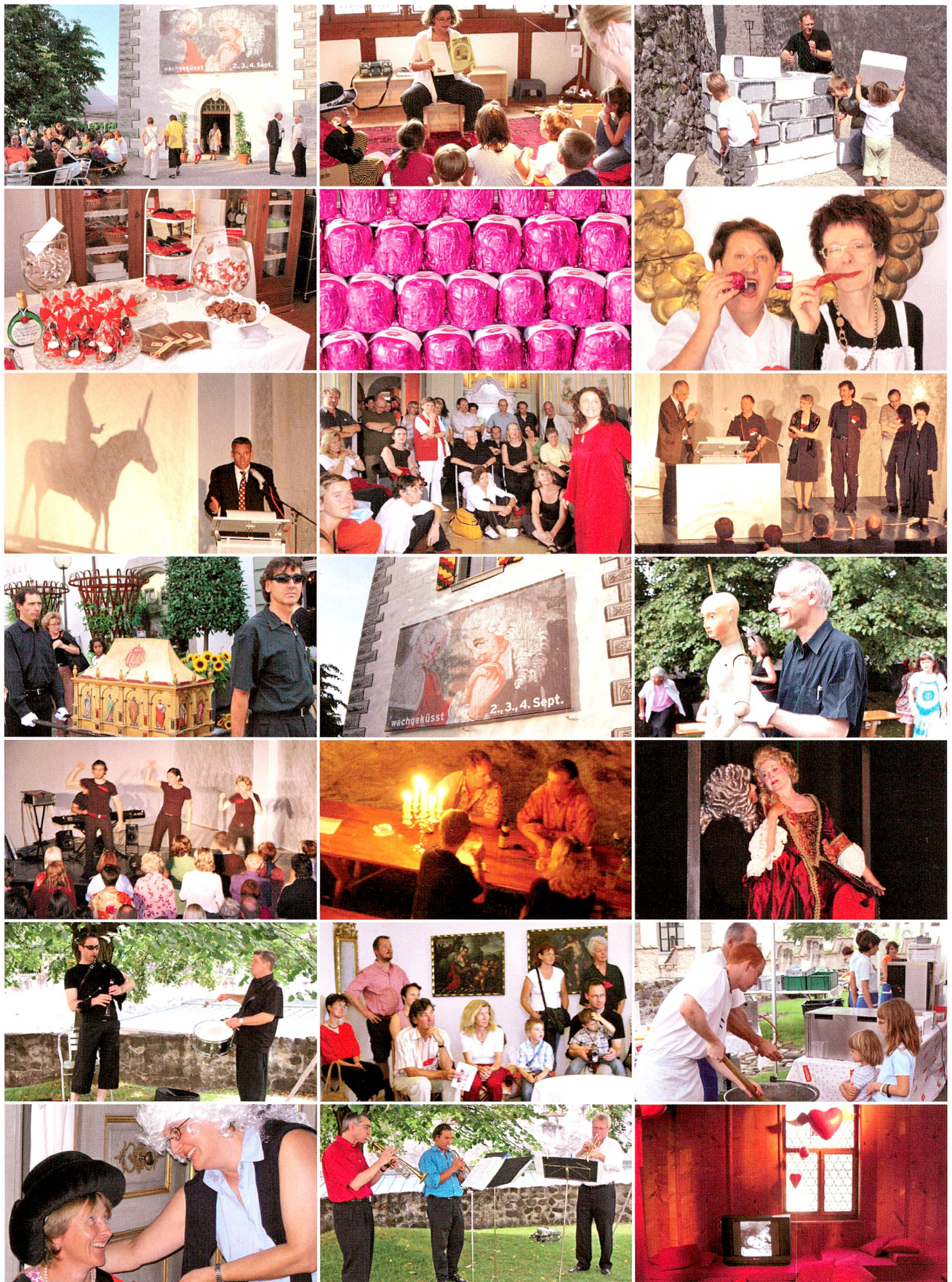
Abb. 6 Impressionen vom Fest «wachgeküsst». «Zuger Burg von Muse geküsst», «Zuger Burg für einmal ein Bienenhaus», «Zuger Dornröschen ist erwacht» überschrieben die Zuger Medien ihre begeisterten Berichte.