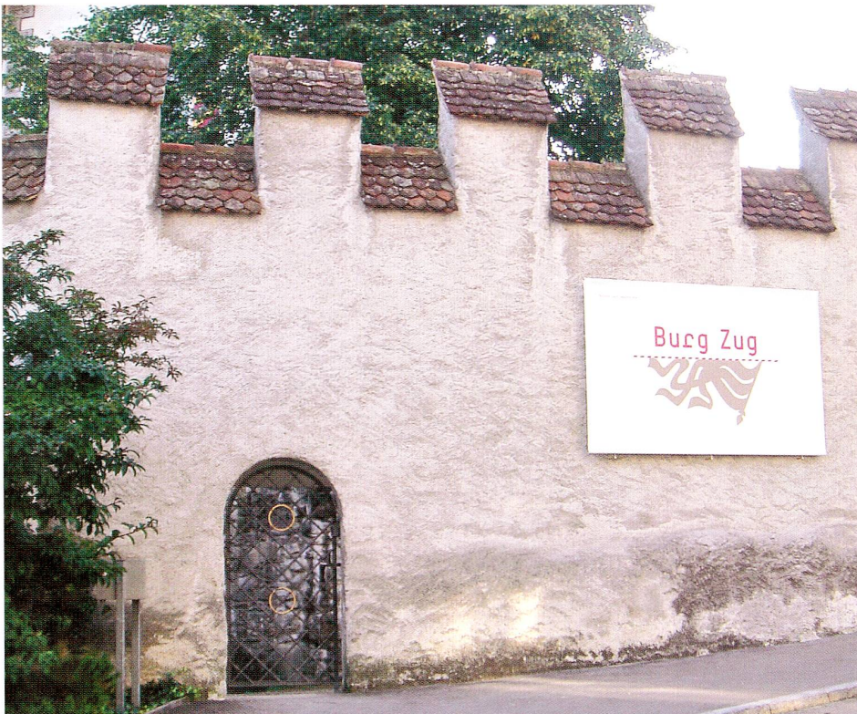
Abb. 4 Erstmals wurde die Burg auch aussen auf der Mauer «angeschrieben» bzw. mit dem neuen Logo gekennzeichnet, auf der Seite zum Burgbachplatz und hier an der Kirchenstrasse.

chen Rot als auch mit seiner modernen Typografie mit der ungewohnten «r»-Form, an der man «anhängt». Die Burg Zug möchte anregen, Gespräche und Diskussionen in Gang setzen, denn Geschichte ist immer Interpretation, Konstruktion. Wobei es die Geschichte nicht gibt, nur Geschichten . Auch darum die verschiedenen Logoelemente, die in abstrahierender oder einem Vexierbild sich nähernden Form Bezug auf Elemente nehmen, welche die Burg Zug als Gebäude oder deren Museumssammlung kennzeichnen. Diese Elemente reichen von Figuren aus der Bemalung der Eckquader des Turms bis zu den für ein kulturhistorisches Museum typischen Motiven wie Fahne, Hellebarde oder Löwe. Nicht alle von ihnen sind auf den ersten Blick gleich leicht identifizierbar, doch machen die interessanten Formen neugierig, laden ein, genauer hinzuschauen. Eben dies ist auch ein Ziel der Präsentationen des Museums. Die auf Grau und Rot reduzierte Farbigkeit schliesslich steht weniger für die begrenzten finanziellen Mittel, denn für die aus der Not gemachte Tugend, mit beschränkten Mitteln ein Optimum an Qualität zu erreichen. Sowie für die ansprechende Modernität einer alten, nun gründlich entstaubten Institution. So komplex das Corporate Design gedeutet werden kann, so unmittelbar spricht es an. Darin liegen seine Kraft und seine Qualität.