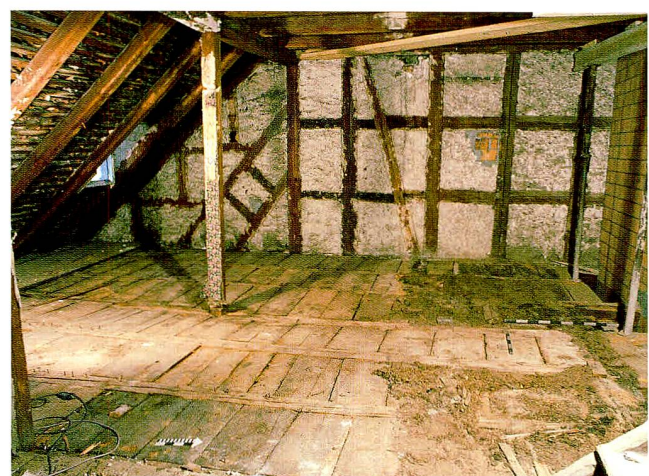
Abb. 8 Zug, Kolinplatz 5, erstes Dachgeschoss. Übersicht Südteil während der Bauuntersuchung 1996.