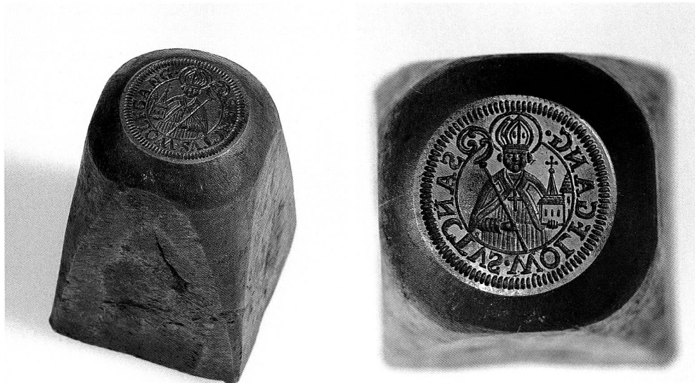
Abb. 9 Münzstempel zur Prägung der Rückseite des Zuger Schillings von 1784 (Kantonsarchäologie Zug, Ereignisnr. 508, Fundnr. 239.1020), Höhe 57,7 mm, Durchmesser der Prägefläche 22,4 mm. Gesamtansicht (links) und Prägefläche (rechts).