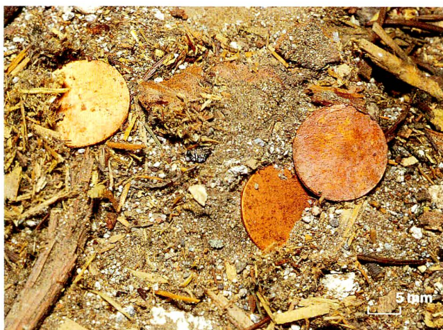
Abb. 7 Zug, Kolinplatz 5, erstes Dachgeschoss. «Schrötlinge» im Schutt auf dem Blindboden (Kantonsarchäologie Zug, Ereignisnr. 508, FK 193).