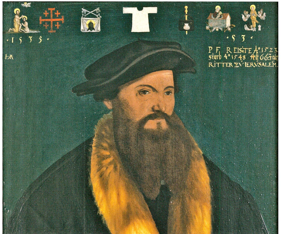
Abb. 4 Porträt des Zürcher Glockengießers Peter III. Füssli, gemalt von Hans Asper (1499–1571), datiert 1535 (Ausschnitt, Depositum im Kunstmuseum Solothurn). Die Pilgerzeichen am oberen Rand des Bildes weisen Füssli als eifrigen Wallfahrer aus.

als Ausweis der eigenen Frömmigkeit und auch als Zeugnis für den zurückgelegten Weg. 29 Das Bild der Heiligen vor Augen zu haben, mochte dem Einzelnen die Andacht erleichtern. Wer sich ein solches Zeichen an den Hut heftete, stellte sich aber auch demonstrativ unter den Schutz des Heiligen. Der mit Stab und Tasche ausgerüstete Pilger genoss schon bei seinem Aufbruch von zu Hause die Privilegien des geistlichen Rechts; wer von einem Wallfahrtsort zurückkehrte, zählte auf die Schirmherrschaft dieses mächtigen Patrons, konnte etwa die Grenzlinien in umkämpften Gebieten ungehindert passieren. Pilgerzeichen hatten zwar keine juristische Beweiskraft im engeren Sinne, wirkten aber vertrauensbildend. Damit öffnete sich den Wanderern abseits der offiziellen Herbergen wohl manche private Türe. 30