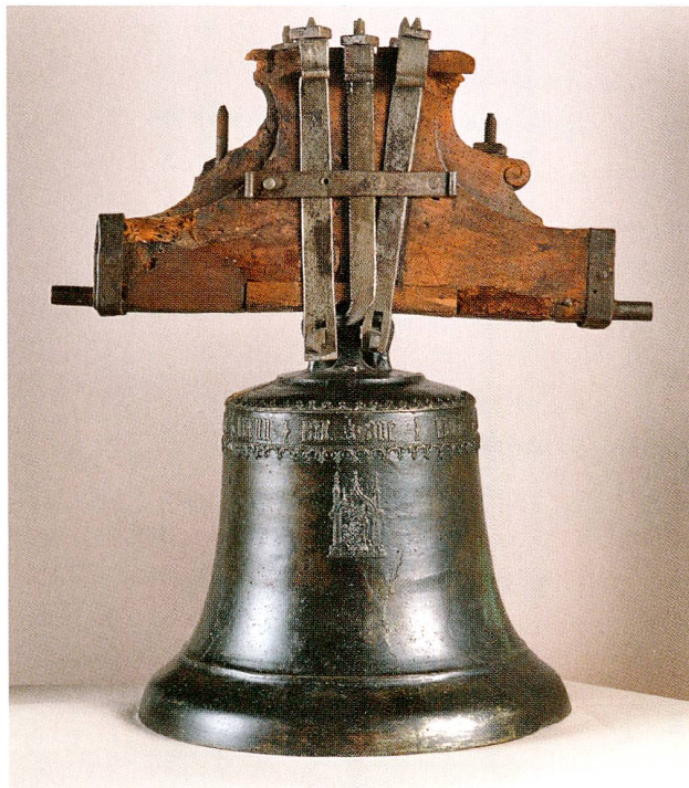
Abb. 1 Hünenberg, Kapelle St. Wolfgang. Angelusglocke von 1480, vermutlich gegossen von Peter II. Füssli in Zürich. (Depositum in der Burg Zug)

gerade vier auf diese Weise geschmückte Glocken bekannt geworden. 4 In der Pilgerzeichen-Forschung hat die Hünenberger Glocke bisher nicht die ihr gebührende Beachtung gefunden; 5 mit der vorliegenden Untersuchung soll diese Lücke geschlossen werden.