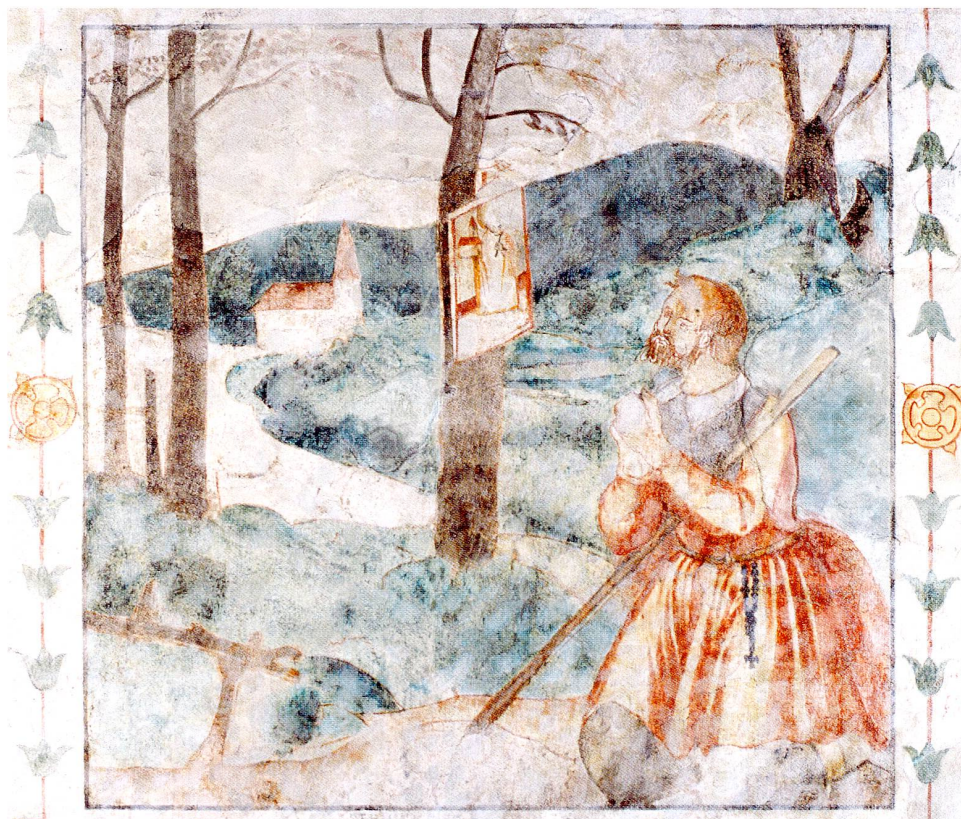
Abb. 2 Hünenberg, Kapelle St. Wolfgang. Freskenzyklus eines unbekannt Meisters zum Leben des Heiligen, zweites Viertel 17. Jahrhundert. Ein Pilger kniet am Ort der spä- teren Kirche vor einem Bild des hl. Wolfgang.

über der Reuss erbaut wurde. Gemäss der glaubhaftesten von drei Gründungslegenden hatte sich hier am Schnittpunkt wichtiger Verkehrswege zuvor spontan eine Wallfahrt zu einem Bilde Wolfgangs entwickelt. Ein frommer Pilger habe in der «Totenhalden» genannten Waldlichtung zur Abwehr des Bösen das Blatt mit einem Bildnis des Bischofs an eine Tanne aufgehängt. 6 Diese Situation wird erstmals im Gemäldezyklus im Innern der Kirche aus dem zweiten Viertel des 17. Jahrhunderts dargestellt (Abb. 2). Das damals verehrte Bild stammte – so interpretiert es be-