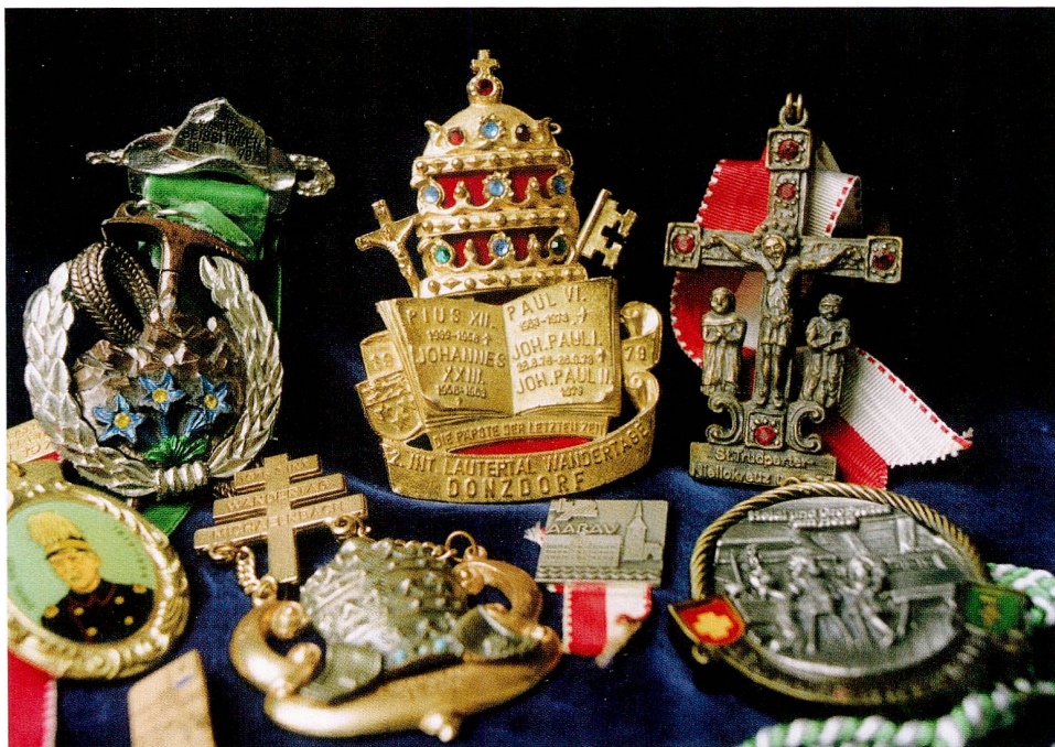
Abb. 3 Volksmarschabzeichen, zweite Hälfte 20. Jahrhundert. Niello- kreuz von St. Trudbert (rechts hinten), Papsttiara mit Petrus- Schlüssel über Buch (hinten Mitte), Papsttiara mit dreifachem Kreuz (vorne) sowie weltliche Symbole.

nuel Levinas (gestorben 1995) stammt die Formulierung: Nicht primär im Denken, sondern in der Sinnlichkeit vollzieht sich Transzendenz.