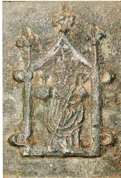
Abb. 7 (links) Pilgerzeichen aus St. Wolfgang im Salzkammergut (Oberöster- reich), um 1520. Originalgrösse 63 × 36 mm. (Nationalmuseum Laibach/Ljubljana, Slowenien).