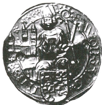
Abb. 9 Pilgerzeichen in Brakteatform aus Hermannsfeld, Gemeinde Meinigen (Thüringen). Zu Füssen des sitzenden Heiligen das viergeteilte Wappen der Grafen von Henneberg-Schleusingen. Die Umschrift lautet «S · WOLFGANG · IN · SEE · 1498». Material messingähnlich, Durchmesser ca. 35 mm. (Germanisches Nationalmuseum Nürnberg)

Der hl. Wolfgang wurde an vielen Orten verehrt, sei dies an der Stätte seines Wirkens als Bischof in Regensburg, sei dies am Wolfgangsee, wo er sich wenigstens gemäss der Legende einige Zeit aufhielt. Das Gotteshaus in Hünenberg war nicht der einzige Filiationkult, auch andernorts wurden den Gläubigen Pilgerzeichen mit seinem Bild ausgegeben. Erwähnenswert ist etwa die für die Jahre 1482–84 historisch bezeugte Wallfahrt von Bad Kreuznach, Rheinland-Pfalz; ein dort ausgegebenes Zeichen wurde auf einer Glocke in Heidesheim (Landkreis Mainz-Bingen) in Rheinland-Pfalz aufgebracht. 59 Ein anderes Zeichen hat die Form eines Brakteaten und stammt aus Hermannsfeld in der Gemeinde Meinigen, Thüringen, gefunden in Quermstedt (heute Quarmbeck) im Landkreis Quedlinburg, Sachsen-Anhalt, und datiert gemäss seiner Umschrift auf 1498 (Abb. 9). 60 Vom ersteren ist leider keine Abbildung überliefert: Es soll den Bischof stehend unter einem spätgotischen Bogen darstellen mit einem knienden Adoranten und folgt damit den uns nun schon bekannten ikonografischen Grundmustern. Das runde Zeichen von Hermannsfeld zeigt den Heiligen hingegen auf einer Thronbank sitzend. Beiden Zeichen ist gemeinsam, dass sie ein Wappen tragen, das