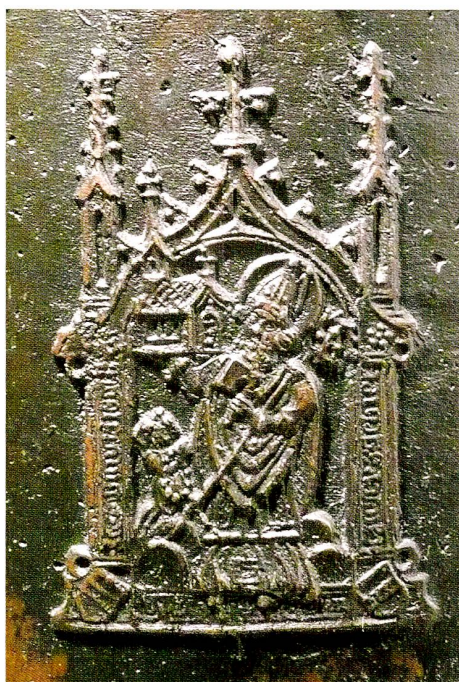
Abb. 6 (rechts) Hünenberg, Kapelle St. Wolfgang. Angelus-Glocke, Pilgerzeichen mit dem hl. Wolfgang, Typ II. Original- grösse 85 × 50 mm.