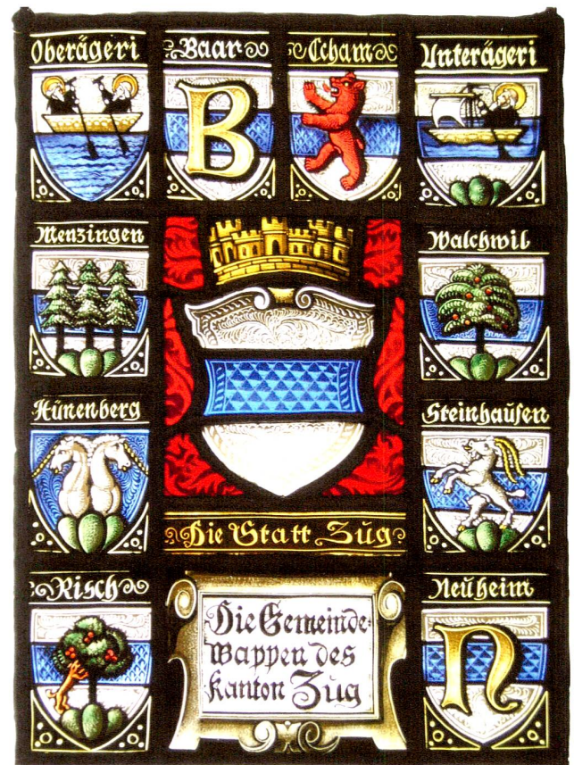
Abb. 8 Wappenscheibe mit den elf Gemeindegewappen des Kantons Zug, zweite Hälfte 19. Jahrhundert.