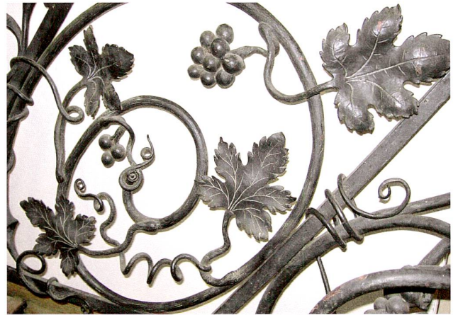
Abb. 14 Treppengeländer (Ausschnitt) aus dem Gasthaus Rathauskeller in Zug, Schmiedeisen, Schlosserei Fritz Weber AG, Zug, 1904.