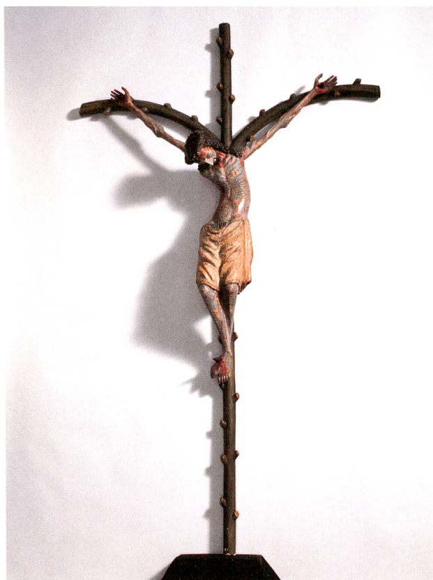
Abb. 1 Christus am Astkreuz, Holz geschnitzt, gefasst, viertes Viertel 13. Jahrhundert.