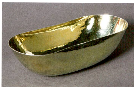
Abb. 2 Jagdschale, Silber, vergoldet, von Karl Martin Keiser (1659–1725), um 1700.

Federzeichnung mit identischer Darstellung und handschriftlichen Hinweisen zur Farbgebung (Abb. 7) diente am ehesten als Vorlage für eine Farblithografie.