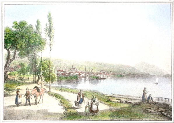
Abb. 4 Zug von Westen mit alter Chamerstrasse, kolorierte Lithografie, gezeichnet von Laurent Deroy (1797–1886), um 1840.