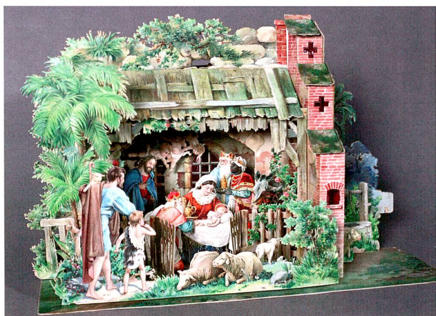
Abb. 12 Krippe aus Kartonpapier, zusammenlegbar, Anfang 20. Jahrhundert.