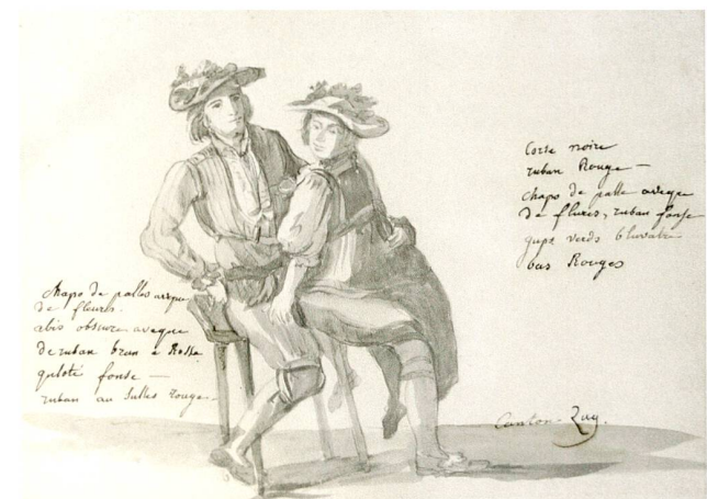
Abb. 7 Zuger Trachtenpaar, lavierte Federzeichnung, von Franz Niklaus König (1765–1832), um 1800.