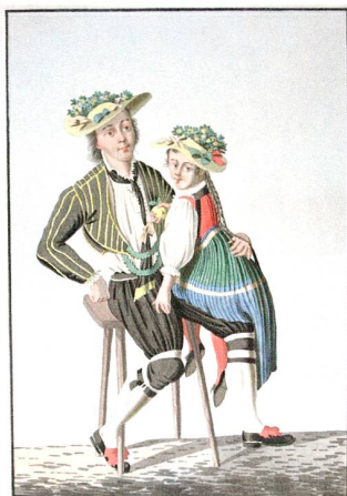
Abb. 6 Zuger Trachtenpaar. Gouache, von Franz Niklaus König (1765–1832), um 1800.