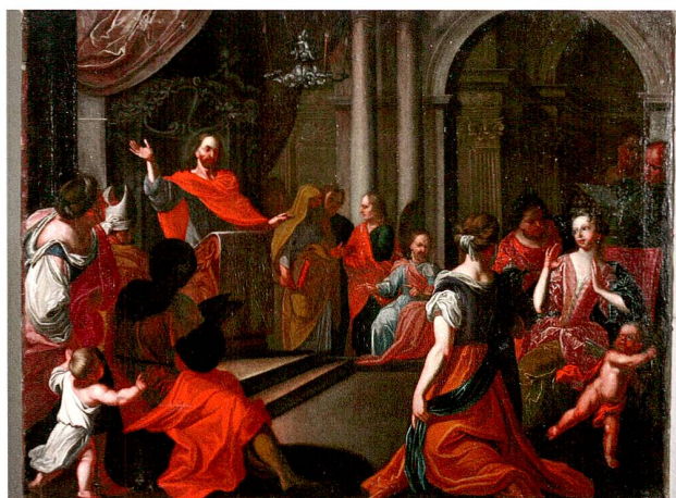
Abb. 13 Jesus im Tempel, Öl auf Leinwand, vermutlich von Johannes Brandenburg (1661–1729), um 1690.