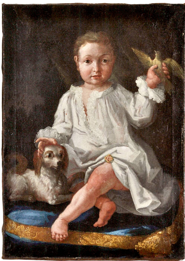
Abb. 3 Kinderporträt Jakob Bernhard Fidel Zurlauben (1761–67), Öl auf Leinwand, von Caspar Wolf (1735–83), 1762.

Die Glasgemälde-Sammlung konnte um einige Werke aus dem 19. und 20. Jahrhundert vermehrt werden, womit sich das Weiterleben der Kabinettscheiben-Tradition bis in unsere Zeit mit repräsentativen Beispielen dokumentieren lässt. Bemerkenswert ist die Wappenscheibe aus der Zeit des Historismus, welche noch die alten Gemeindewappen mit den hinterlegten Zugerfarben Weiss-Blau-Weiss zeigt (Abb. 8). Die von Paul Boesch (1889–1969) und Lothar Albert (1902–72) in unterschiedlicher Formensprache gestalteten modernen Zuger Wappenscheiben setzen den Erzengel Michael als Standespatron an die Stelle der in der Renaissance üblichen Bannerträger.