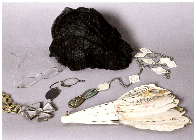
Abb. 9 Theaterrequisiten: Damenhaube, Brille, Zwicker, Halskette, Fächer, um 1920.