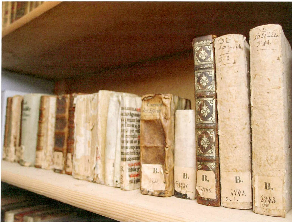
Abb. 7 Einige Bücher aus der Zurlauben-Bibliothek, wie sie sich heute im «Bücherturm» der Aargauer Kantonsbibliothek präsentieren.

der 1950er Jahre nahm der damalige Vizedirektor der Landesbibliothek, Wilhelm Joseph Meyer, die Erschliessung der «Acta Helvetica» an die Hand und liess über 22 000 Regesten, also kurze Zusammenfassungen des Inhalts mit Angaben von Datum, Entstehungsort sowie Orts- und Personennamen, zu den «Acta Helvetica» und den «Miscellanea Helveticae Historia» erstellen. Obwohl die Regesten ein beträchtliches Namenmaterial zur Personen- und Ortsgeschichte erschlossen, befriedigte diese Form der Bearbeitung die Fachwelt nur bedingt. 35