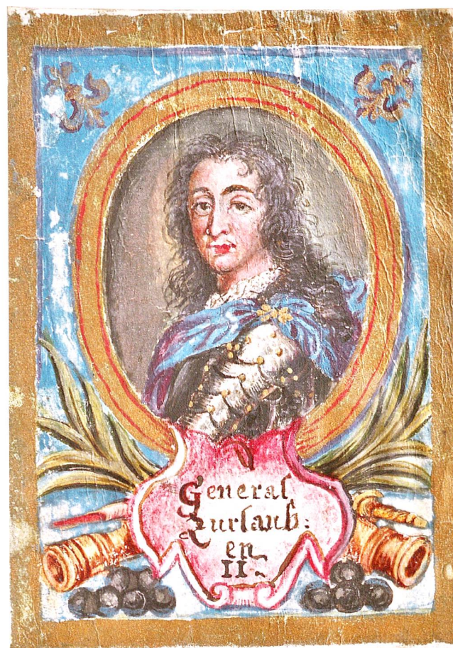
Abb. 3 Kolorierte Miniatur von Beat Fidel Zurlauben (1720–1799), Generalleutnant des Schweizer Garderegiments in französischen Diensten (Aargauer Kantonsbibliothek, MsZF 21: D).

Den Nachlass der Familie Zurlauben, wie er sich heute in der Aargauer Kantonsbibliothek präsentiert, 10 haben wir