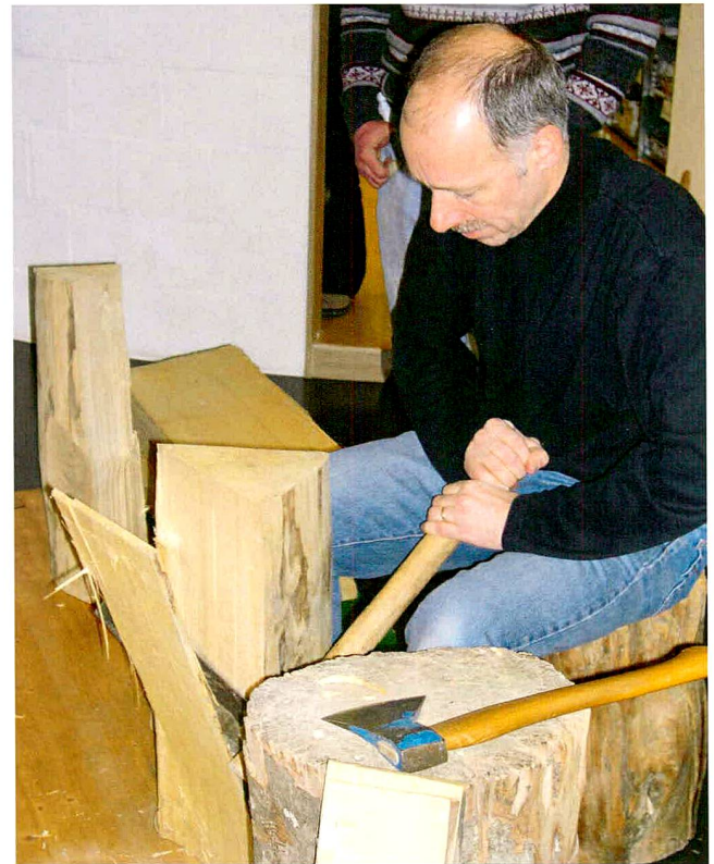
Abb. 7 Kantonales Museum für Urgeschichte(n). Demonstration der Herstellung von Weisstammenschindeln, wie sie auch vor 3000–5000 Jahren für die Häuser der Seeufersiedlungen verwendet wurden.

Für die Pfahlbauerepochen ist neben den handwerklichen Themen vor allem die Landwirtschaft ein spannendes Wirkungsfeld, da sie sich vom Beginn der Jungsteinzeit bis zum Ende der Bronzezeit stark entwickelte: Immer wieder kamen neue Kulturpflanzen hinzu, wurden neue Anbaumethoden angewendet und Geräte entwickelt. Auch Krisen und Rückschläge machen die Geschichte der menschlichen Ernährung zu einem spannenden Geschichtsthema und zeigen den alltäglichen Kampf um genügend Nahrung. Fazit ist, dass deutlich mehr Menschen Museen als bereichernde Erfahrungs- und aussergewöhn-