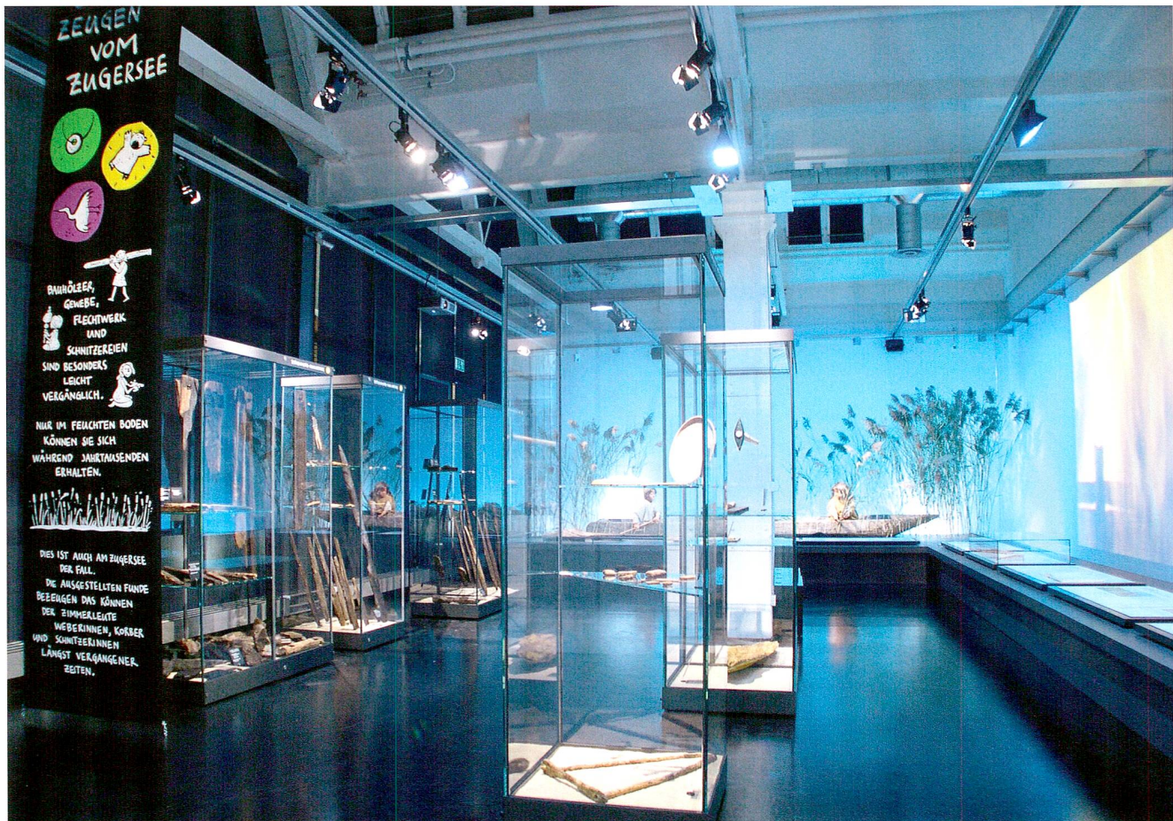
Abb. 1 Kantonales Museum für Urgeschichte(n). Museumsenerweiterung, ausschliesslich mit Funden aus den Pfahlbaufundstellen Steinhausen-Chollerpark und Cham-Eslen.

Im Museum für Urgeschichte(n) in Zug hat man das Glück, einzigartige Funde aus den Pfahlbausiedlungen bewundern zu können. Populär wurden die Pfahlbaufunde bereits mit ihrer Entdeckung im 19. Jahrhundert. In den folgenden Jahrzehnten, dem Zeitalter der Entstehung der National-