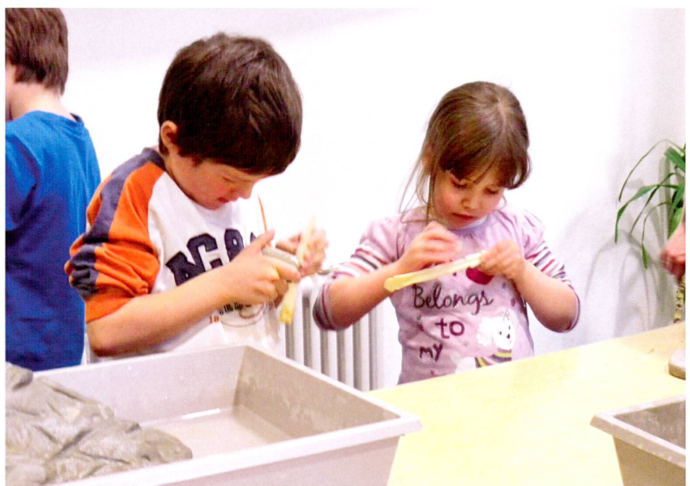
Abb. 4 Kantonales Museum für Urgeschichte(n). Kinder beim Schleifen einer Harpune aus Hirschknochen.

Innerhalb der Pfahlbauzeit, im langen Zeitraum von rund 4300–800 v. Chr., liegen verschiedene Ereignisse und Fundstellen, die für die Weltgeschichte von entscheidender Bedeutung sind: Ab 4000 v. Chr. finden sich – anfänglich vor allem in Westeuropa, später auch anderenorts – Megalithen. Die erste Bauetappe von Stonehenge (England) beginnt kurz vor 3000 v. Chr., und ungefähr um dieselbe Zeit erfand man die Schrift in Ägypten und Mesopotamien. Wenige Jahrhunderte später wurden die Pyramiden von Gizeh errichtet. In die Bronzezeit können um 1800 v. Chr. die Siedlungsphasen der von Homer besungenen Stadt Troja (am Südende der Dardanellen in der heutigen Türkei) datiert werden. Um 1628/27 v. Chr. schliesslich besiegelte der Vulkanausbruch von Santorin in