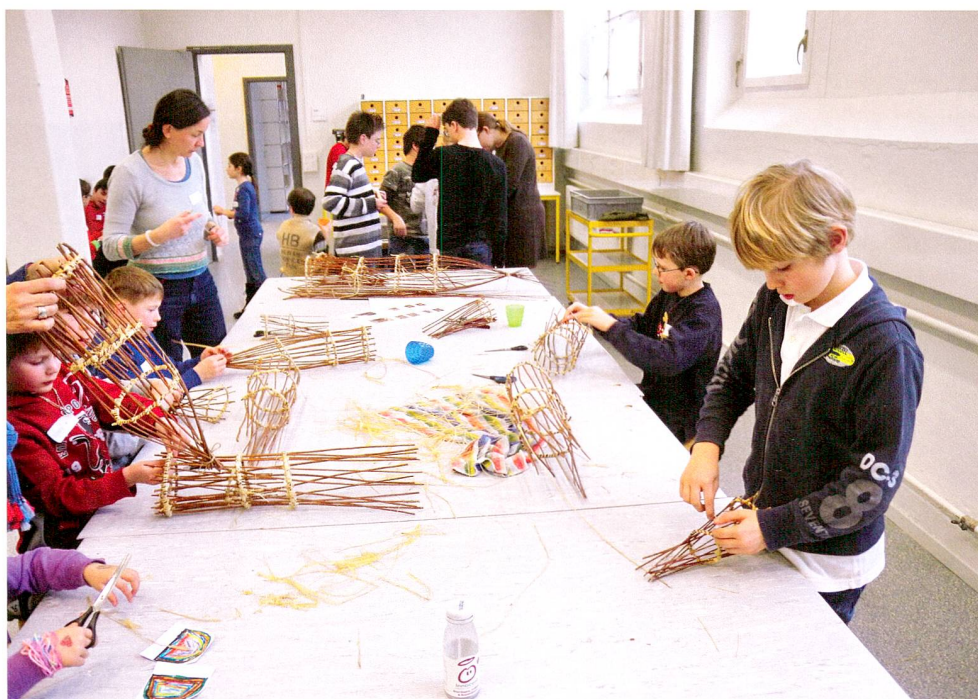
Abb. 5 Kantonales Museum für Urgeschichte(n). Workshop mit dem Ziel, aus Weidenruten eine Fischreuse herzustellen.

Die im Museum für Urgeschichte(n) bereits seit Längerem ausgestellten Objekte der Fundstelle Zug-Sumpf mit Weltkulturerbe-Status sind auch in Zukunft ein bedeutendes Fundensemble und aus der Dauerausstellung nicht mehr wegzudenken. Andererseits werden die vielen gut erhaltenen Holzfunde aus der zweiten Weltkultur-Fundstelle Zug-Riedmatt nach ihrer Konservierung und Restaurierung das Spektrum an besonderen Exponaten gewichtig bereichern. Angesichts der vielen Ausgrabungen von Seeufersiedlungen in den letzten zehn Jahren ist der Zuwachs an sensationellen Funden so oder so gewaltig. Zu dieser Kategorie zählen auch die Funde aus der Ausgrabung Steinhausen-Chollerpark. Es handelt sich zwar nur um Schwemmgut, aber unter den geborgenen Holzobjekten gab es einige Neuentdeckungen – bis 15 m lange Trapezkonstruktionen – und Dutzende von Paddeln, wie sie bisher nur sehr selten geborgen werden konnten. Der kulturelle Wert der wissenschaftlich sehr wertvollen Gegenstände sprach für die Präsentation im Rahmen der Dauerausstellung. Allerdings fehlte der Platz. Dank einem Beschluss des Zuger Kantonsrats konnte das Museum 2003 um einen Raum erweitert werden.