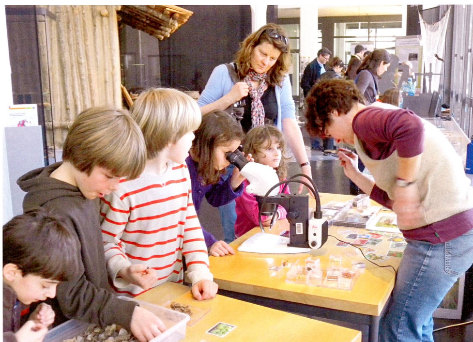
Abb. 6 Kantonales Museum für Urgeschichte(n). Präsentation, wie Botanikerinnen und Botaniker die organischen Reste aus den Seeufersiedlungen bestimmen können.