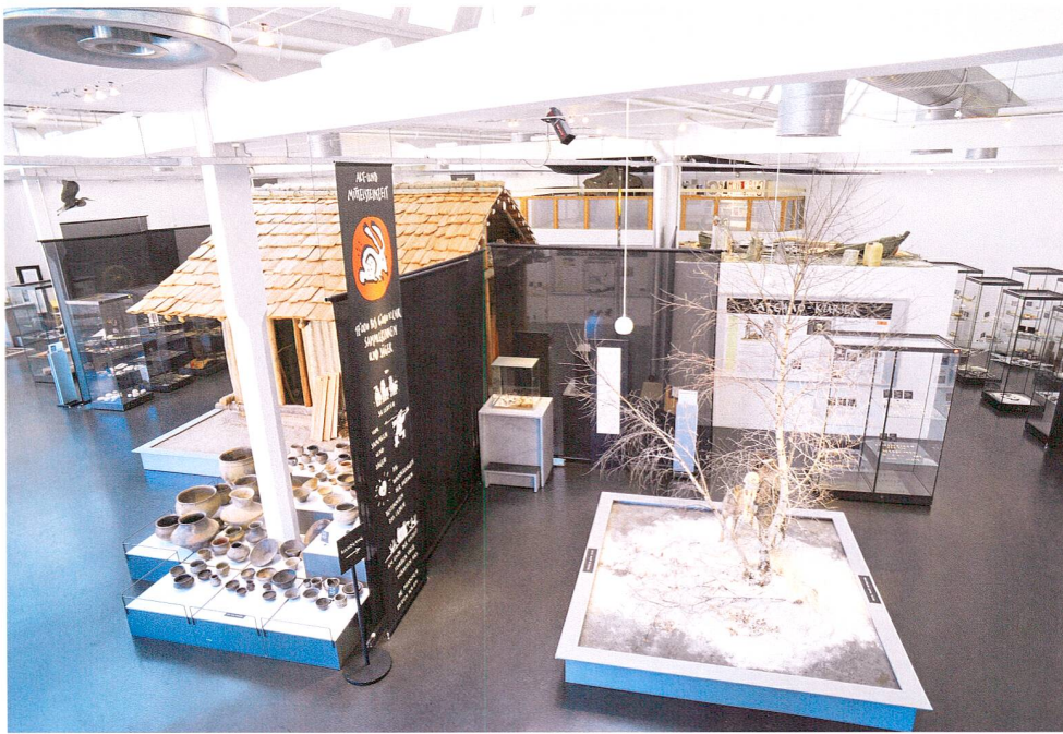
Abb. 3 Kantonales Museum für Urgeschichte(n). Überblick über die Dauerausstellung mit dem rekonstruierten Pfahlbauhaus im Zentrum.

jungem Mutter, die ihr Kind stillt, sowie von zwei Kindern in einem Einbaum beim Schilfschneiden.