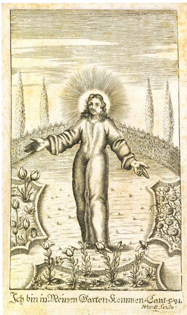
Abb. 2 Jesus im Blumengarten. Kupferstich von Nikolaus Hautt (geboren 1641) aus Luzern. Frontispiz im Buch «Catholischer Blumen-Garten» des Zuger Pfarrers Johann Kaspar Lang (1631–1691), das 1673 in Zug bei Jakob Ammon gedruckt wurde.

Ammons Verbindungen zu Luzern und Einsiedeln mit der Abbildung für den «Catholischen Blumen-Garten» beauftragt. 37 Der Druck enthält eine Widmung Ammons an die Regierungen der katholischen Orte. Diese Huldigung der Eidgenossenschaft als Paradiesgarten sollte vermutlich – wie das Frontispiz – zum Kauf des Buches anregen.