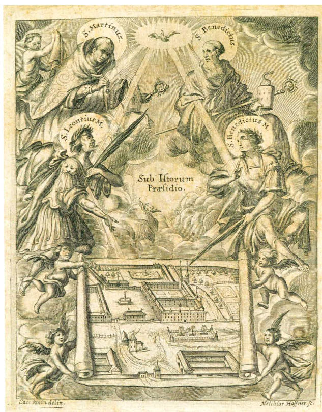
Abb. 1 Die Schutzheiligen des Klosters Muri. Kupferstich, gezeichnet vom Zuger Künstler Jakob Kolin (1634–1694), gestochen von Melchior Hafner aus Augsburg. Frontispiz im Sammelwerk «Moralische Lob- und Ehren-Predigen» von Plazidus Zurlauben, das 1691 in Zug bei Heinrich Ludwig Muos gedruckt wurde.

Angesichts dieser schwierigen Ausgangslage ist es erstaunlich, dass einige der ältesten Zuger Drucke kunstvolle Abbildungen enthalten. So enthält das Sammelwerk «Moralische Lob- und Ehrenpredigen» von Plazidus Zurlauben (1646–1723), Abt des Klosters Muri, das 1691 bei Heinrich Ludwig Muos (1657–1721) 7 in Zug gedruckt wurde, eine ausdrucksstarke Darstellung der Schutzpatrone des Klosters (Abb. 1). Sie zeigt über einer Ansicht des Klosters Muri die heiligen Martin und Benedikt sowie die Märtyrer Leontius und Benedikt. 8 Das Quartett der Schutzpatrone wirkt zusam-