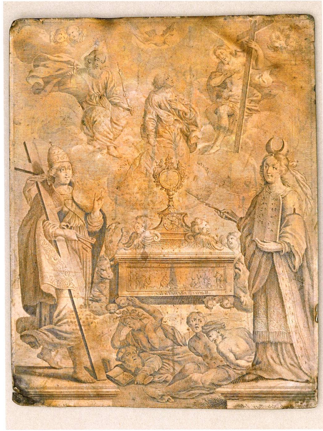
Abb. 5 Kupferplatte zum Frontispiz im Andachtsbuch « Motus perpetuus », hergestellt von Philipp Kilian (1628–1693), einem bekannten Augsburger Kupferstecher. Die originale Kupferplatte befindet sich in der Bibliothek Zug.

durch parallel verlaufende Säulengänge begrenzt wird, wobei der mittlere nach hinten versetzt ist. Die Säulen links und rechts sind aus den personifizierten alten eidgenössischen Orten gebildet. Der mittlere Säulengang ist beidseits mit einem Turm abgeschlossen und erscheint durch ein grosses Bild über dem Eingang zweistöckig. Unten bewacht von einem Hund, oben überdacht von Phoebus und allegorischen Figuren, führt der mittlere Säulengang nach hinten in einen Garten mit Bergen im Hintergrund. Vorne auf der Bühne lädt ein höfisch gekleideter Vorredner mit gelüftetem Federhut, Hand auf dem Herzen und Knicks zum Schauspiel ein. Die Leser des Schauspiels werden mit der Abbildung quasi begrüsst und können sich die Vorgänge auf der Bühne besser vorstellen. Dadurch wird das Leseerlebnis aufgewertet.