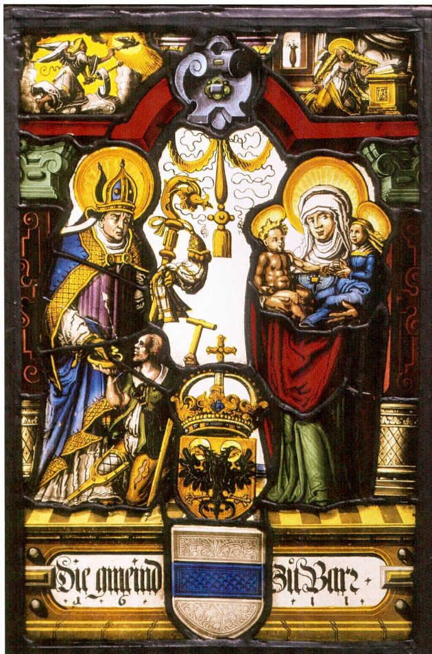
Abb. 1 Figurescheibe der Gemeinde Baar mit dem hl. Martin und der hl. Anna selbdritt, im zweiseitigen Oberbild Verkündigung an Maria. Glasmalerei, unbekannter Zuger oder Schwyzer (?) Meister, datiert 1611.

Erwähnenswert sind neben dem traditionellen Zuwachs an Objekten aus den Bereichen «Glasmalerei» (Abb. 1) und «Hauswirtschaft» (Abb. 2, 3 und 6) ausgemusterte Ausrüstungsteile und Waffen sowie weiteres nicht mehr benötigtes Material der Stadtpolizei Zug. Als gross-