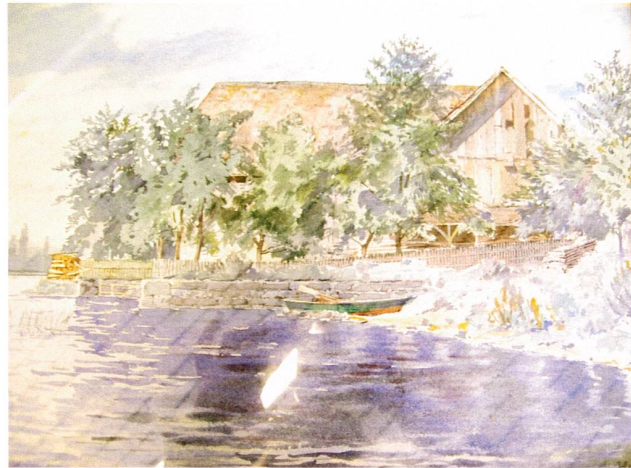
Abb. 7 Ehemalige städtische Ziegelhütte an der Artherstrasse 30 in Zug, abgebrochen 1929. Aquarell, von Hans Süffert (1868–1945), Basel, um 1900.