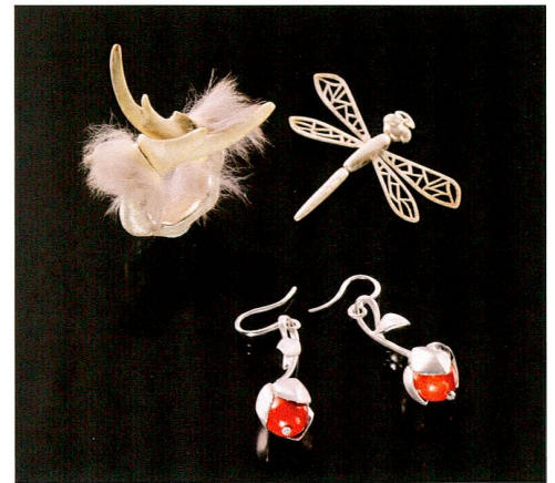
Abb. 8 Schmuckstücke von Solvai Clematide, 2010–2013.

Langem auf dem Platz Zug gewünschte Industriemuseum soll im Theilerhaus als «Plattform für Industrie- und Technikgeschichte Zug» in Form eines Kooperationsprojekts zwischen dem IPL und dem Museum Burg Zug eingerichtet werden. Das Ziel dieser Plattform ist es, Jugendliche vermehrt für technische Berufe zu begeistern und sie anhand von Ausstellungen und Experimentierstationen mit Technik und dem industriekulturellen Erbe von Zug vertraut zu machen.