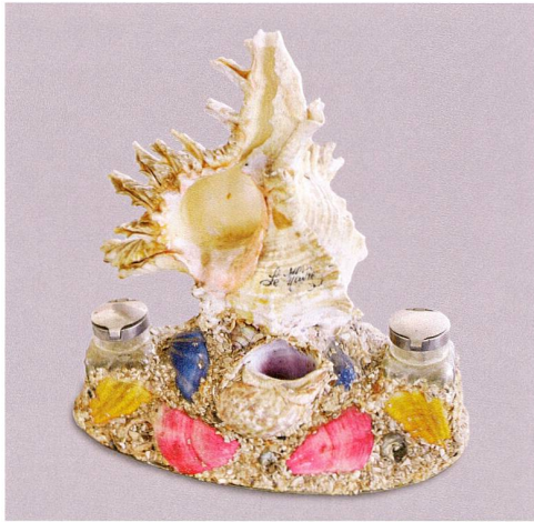
Abb. 2 Schreibgarnitur, aus Muscheln gebaut, mit zwei Tintenfassern. Erste Hälfte 20. Jahrhundert.