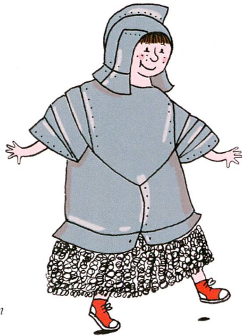
Abb. 6 Comicfigur Lili, gestaltet von Mara Berger.

Zuger Gemeinden ein, im Turnus Einblicke in ihre ortsgeschichtlichen Sammlungen oder in die Geschichte ihrer Gemeinde zu präsentieren.