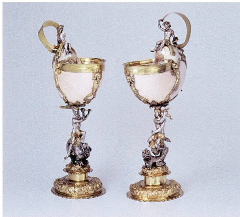
Abb. 7 Nautiluspokal-Paar von Melchior Maria Müller, 1670–1690.