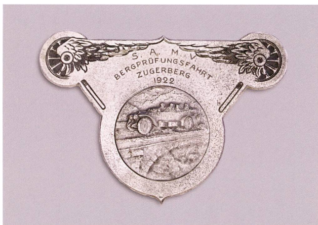
Abb. 9 Plakette «Schweizerischer Automobil- und Motorfahrer-Verband: Bergprüfungsfahrt Zugerberg». Metalllegierung, datiert 1922.