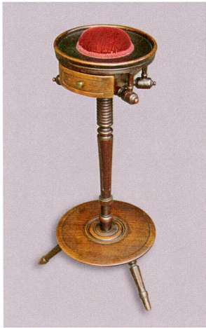
Abb. 6 Nähstock, Laubholz, gedrechselt, zweite Hälfte 19. Jahrhundert.