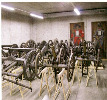
Abb. 2 Sammlungsdepot des Museums Burg Zug im Choller. Kanonen und Grabkreuze.