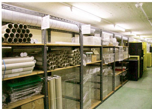
Abb. 1 Lager für Ausstellungsmaterial im alten Kantonsspital.

Vor 35 Jahren wurde die Burg als ältestes historisches Gebäude der Stadt vor dem Abbruch bewahrt, sorgfältig untersucht und restauriert. Das historische Museum von Stadt und Kanton Zug fand dort gemäss dem Wunsch des letzten privaten Besitzers seine Bleibe. Doch im Verlauf von mehr als einer Generation verändert sich die Welt, neue Gesetze werden erlassen, die Gesellschaft und die Erwar-