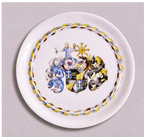
Abb. 4 Wappenteller mit Familien- wappen Bossard, zum 75. Geburtstag von Louis Bossard-Hildebrand (1864–1957). Porzellan, bemalt, von Hildegard Schwerzmann (1897–1976), Zug, datiert 1939.