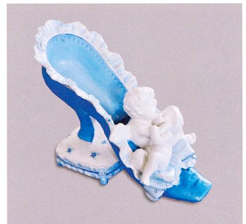
Abb. 5 Miniatur-Damenschuh mit zwei Amoretten. Porzellan, bemalt, erste Hälfte 20. Jahrhundert.