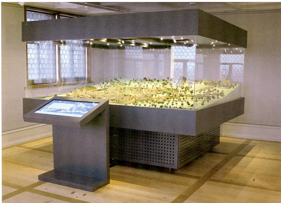
Abb. 5 Museum Burg Zug. Historisches Stadtmodell mit Stadtentwicklung auf Touchscreen.