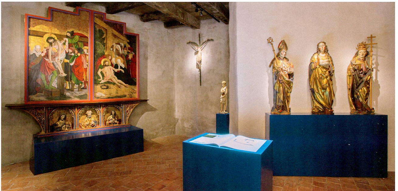
Abb. 4 Museum Burg Zug. Raum für sakrale Kunst mit multimedialem Buch.

In der kleinräumigen Burg werden in den historischen Räumen, welche noch viel von der ursprünglichen Architektur bewahrt haben, passende Themen präsentiert. In den neutraleren Räumen, den sogenannten thematischen Räumen, sind wichtige Aspekte der Zuger Kulturgeschichte, welche sich in der Sammlung schwerpunktmässig niedergeschlagen haben, dargestellt (Abb. 4). Da sich in der Kulturgütersammlung auch ganze Ensembles von Handwerk und Gewerbe befinden, wurden die Drogerie Luthiger und die Schuhmacherwerkstatt Blum möglichst authentisch nachgestellt. Im Raum «Stadt und Kanton kennenlernen» zeigen ein Stadtmodell aus den 1960er Jahren sowie dessen virtuelle Ergänzung auf einem Monitor die Entwicklung der Stadt Zug vom Mittelalter bis zum heutigen Tag auf (Abb. 5). Auf einem Touchscreen lässt sich ein Schnellgang durch die Kantonsgeschichte nachvollziehen, und in einem eigens mit Monitor, Vitrine und Sockeln eingerichteten Bereich lädt das Museum die