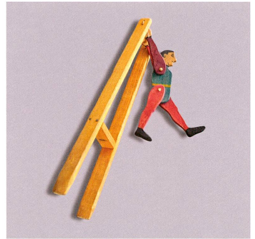
Abb. 3 Turnender Mann am Reck. Spielzeug, Holz, bemalt, erste Hälfte 20. Jahrhundert.