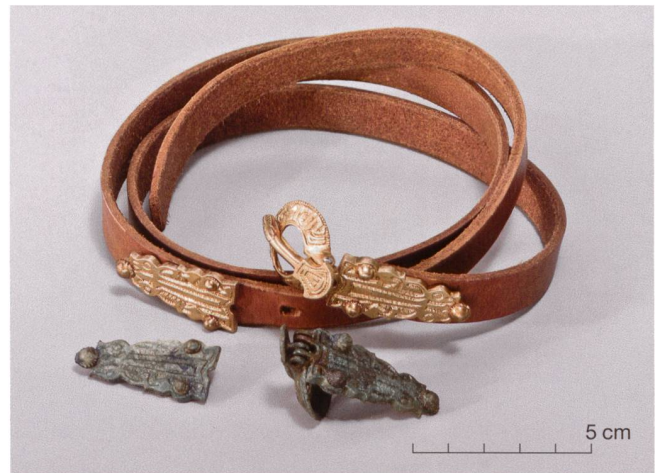
Abb. 6 Originalfunde einer frühmittelalterlichen Gürtelgarnitur aus Grab 101 in Baar-Früebergstrasse (vorne) und Replik mit Lederband (Replik hergestellt von Markus Binggeli, Bern).

Emotionaler Zugang und wissenschaftliche Glaubwürdigkeit reichen aber nicht. Was im Museum gezeigt und vermittelt wird, muss auch dem aktuellen Stand der archäologischen Forschung entsprechen. In den Medien wird regelmässig über neue Ausgrabungen und archäologische Entdeckungen berichtet. Entsprechend aktuell muss auch das Museum sein und immer wieder die notwendigen Korrekturen und Updates vornehmen. Oft handelt es sich nicht nur um neue Entdeckungen, vielmehr liefert die moderne Forschung neben der Bestimmung und Datierung der Funde immer mehr Erkenntnisse über komplexe historische Zusammenhänge wie Bevölkerungsentwicklung, soziale Verhältnisse, Krankheiten und Gesundheit, ökologische Aspekte, wirtschaftliche Entwicklungen, Konsum und Handel usw. Dank moderner Analysen sind heute differenzierte Aussagen dazu möglich. Es liegen also immer mehr detaillierte Informationen und Kenntnisse über ein einzelnes Fundobjekt, eine Fundstelle und schliesslich über eine ganze Epoche vor. Ziel des Museums ist es, seinem Publikum diese neuen Kenntnisse und Interpretationen in verständlicher und unterhaltsamer Weise zu vermitteln. Das ist keine leichte Aufgabe, nicht zuletzt, weil die Vermittlung sowohl die