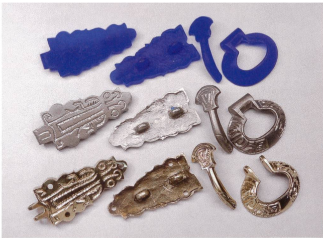
Abb. 5 Für die originalgetreue Nachbildung einer frühmittelalterlichen Gürtelgarnitur wurden zuerst ein blaues Feilwachsmodell (oben), dann ein Modell aus einer Blei-Zinn-Antimon-Legierung (Mitte) und schliesslich die Replik aus Bronze (unten) hergestellt.

senschaftlich korrekt. Archäologische Funde sind jedoch oft mit Vorstellungen von Abenteuer und Mythen behaftet, was die Besucherinnen und Besucher eher emotional anspricht. Dies ist Chance und Herausforderung zugleich. Gleichzeitig erwartet das Museumspublikum, dass die echten Zeugnisse der Vergangenheit wissenschaftlich gründlich und seriös erforscht sind und ihm ein wahrhaftiges Bild der Vergangenheit präsentiert wird. Diesem Anspruch muss das Museum gerecht werden, denn nur dann wird es als Institution respektiert, das die einzigartigen Spuren der Vergangenheit aufzubewahren hat. Und es wird auch akzeptiert, dass viele der jahrtausendealten fragilen Funde vor Hitze, Kälte, Feuchtigkeit und dem Schweiß der Hände geschützt werden müssen und nur hinter Glas gezeigt werden können.