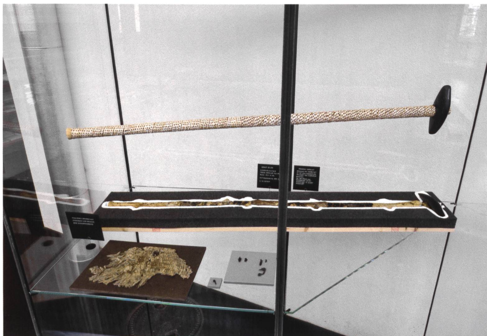
Abb. 1 Original (unten) und Replik (oben) der Prunktaxt aus der Seeufersiedlung Cham-Eslen, um 4200 v. Chr. (Replik hergestellt von Hannes Weiss, Aeugst).

Für die Herstellung der hochwertigen Repliken sind ein enger Kontakt zu Fachpersonen der Experimentalarchäologie und eine Zusammenarbeit mit der Forschung von grosser Bedeutung. Sowohl aus Experimenten als auch aus Forschungsprojekten resultieren immer wieder originalgetreue Repliken, die auch die Herstellungstechniken sehr anschaulich zeigen.