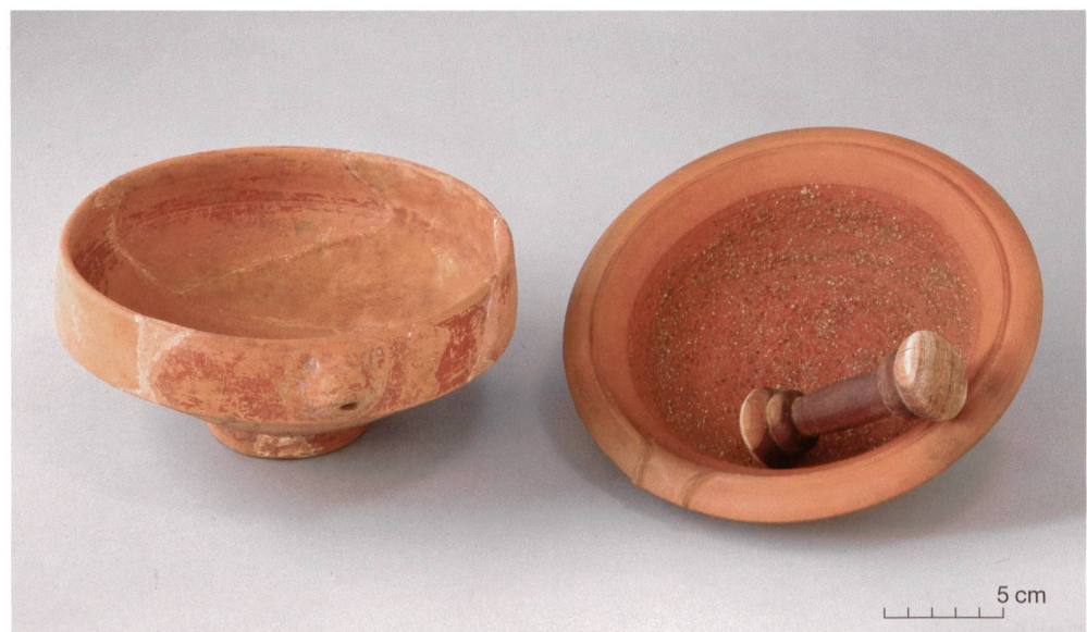
Abb. 2 Originale römische Reibschüssel (links) und Replik mit Mörser (rechts) zum Zerreiben und Mischen von verschiedenen Würzmischungen (Replik hergestellt von Hannes Weiss, Aeugst).

Wie einleitend erwähnt, unterhält das Museum für Urgeschichte(n) eine grosse Replikensammlung, die Objekte aus allen Epochen von der Altsteinzeit bis zum Frühmittelalter umfasst. Die Schwerpunkte liegen bei der sogenannten Pfahlbauzeit und der römischen Epoche. Grund dafür sind in erster Linie die vielen Fundstellen bzw. Ausgrabungen mit einer grossen Fundmenge aus diesen Epochen im Gebiet des Kantons Zug. Entsprechend gross sind das Wissen und die Vielfalt der Themen, die vermittelt werden können. Dies war nicht zuletzt ausschlaggebend, dass im Kanton Zug 2011 drei