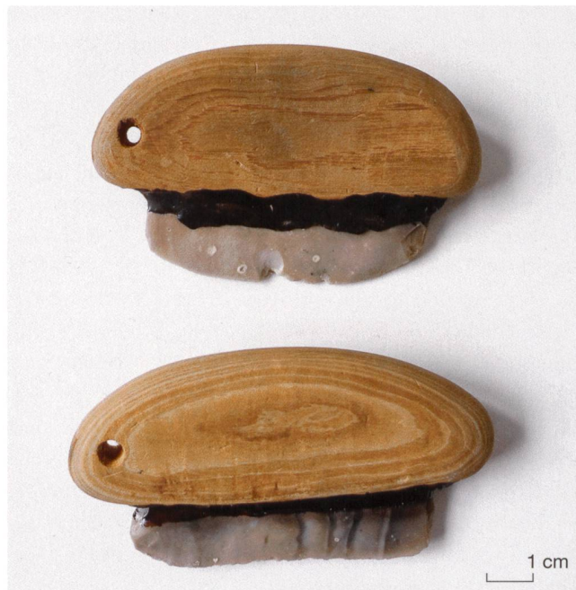
Abb. 3 Nachbildungen von jungsteinzeitlichen Messern aus einer Feuersteinklinge, einem faustgrossen Griff aus Pappelrinde und Birken-teer (hergestellt von Jürgen Junkmanns, Erfstadt-Bliesheim D).

Herstellungstechniken werden am eindrucklichsten anhand von Repliken vermittelt, welche die einzelnen Produktionsschritte vom Rohstoff über Halbfabrikate bis zum fertigen Gegenstand zeigen. Das Museum lässt deshalb immer wieder Halbfabrikate anfertigen. Darüber hinaus umfasst die Sammlung zahlreiche, in der Urgeschichte verwendete Rohstoffe wie beispielsweise Hirschknochen, Geweih und Feuerstein, die einem heutigen Menschen eher fremd sind. In einem Workshop können Kinder zum Beispiel ein Feuersteinmesser