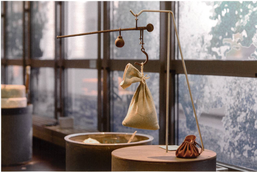
Abb. 8 Interaktive Station zum Thema «Wägen» mit der Nachbildung einer römischen Balkenwaage.

Sinne nicht nur bereichernde Teile der Ausstellung, sondern auch Anstoss zum Dialog. Es ist viel schwieriger, sich über Kunstgegenstände oder ein «fremdartiges» Objekt im Museum zu äussern, als über Gegenstände des Alltags zu reden. Am leichtesten fällt es, wenn bei einer Replik Werkstoff, Oberfläche, Form und Verzierung erkennbar sind und so einfache Anknüpfungspunkte für ein Gespräch bilden. Entwickelt sich bei der Vermittlung ein Dialog mit Fragen und Gegenfragen, so ist dies unmittelbarer Ausdruck der gewünschten Auseinandersetzung mit den Objekten und dem damaligen Leben. Ideen und Vermutungen, aber auch eigene Erfahrungen aus dem Publikum sollten deshalb, wenn immer möglich, aufgegriffen werden. Dieser offenere, aber auch intensivere Umgang mit Geschichte wird meist sehr geschätzt.