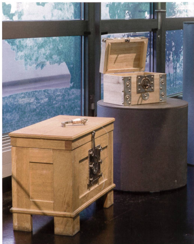
Abb. 7 Interaktive Station zum Thema «Römische Schlösser» mit zwei nachgebildeten Truhen mit unterschiedlichen Schlüsseln und Schliessmechanismen (Nachbildungen hergestellt von Christian Maise, Laufenburg).

Die Funde als Zeugen der Vergangenheit sind wie einzelne Puzzleteile der Geschichte. Erst durch die Abfolge und