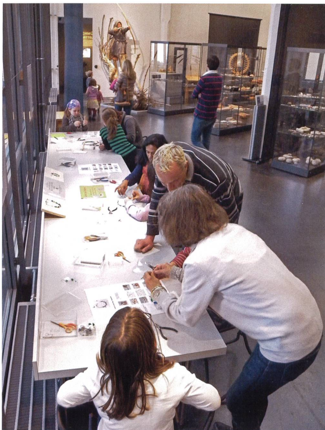
Abb. 7 Offenes Atelier als fester Bestandteil im Museum. Herstellen urgeschichtlicher Souvenirs inmitten der Ausstellung.

Einige Sonderausstellungen enthielten auch partizipative Elemente im Sinne einer Kontribution. Bei der Sonderausstellung «Der Löffel» von 2006 brachten über fünfzig Personen eigene Löffel mit dazugehörigen Geschichten ins Museum, die dann Teil der Ausstellung wurden (Abb. 8). In der Ausstellung «Mercur & Co.» im Jahr 2010 waren Besucherinnen und Besucher dazu aufgefordert, einen Hausaltar ihren Bedürfnissen entsprechend neu zu arrangieren, mit eigenen Figuren zu ergänzen oder Wünsche in den «Götterbriefkasten» zu werfen. Diese wurden bei der Finissage in einem römischen Ritual verbrannt und wurden so Teil des Museumsprogramms.