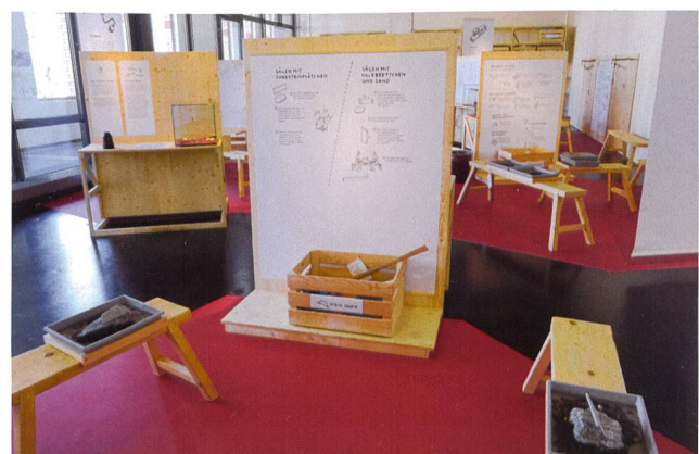
Abb. 6 Pfahlbauwerkstatt der Sonderausstellung «Einfach tun».