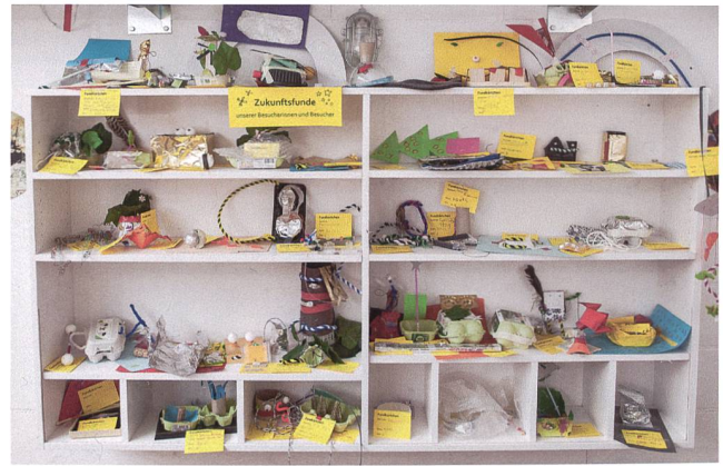
Abb. 10 und 11 «Museum der Zukunft» auf der Kindergalerie. Eine wachsende Ausstellung mit von Kindern gestalteten Exponaten.

ausstellenden Kinder waren sehr stolz auf «ihre» Ausstellung und sind weiterhin häufige Gäste an Museumsanlässen.