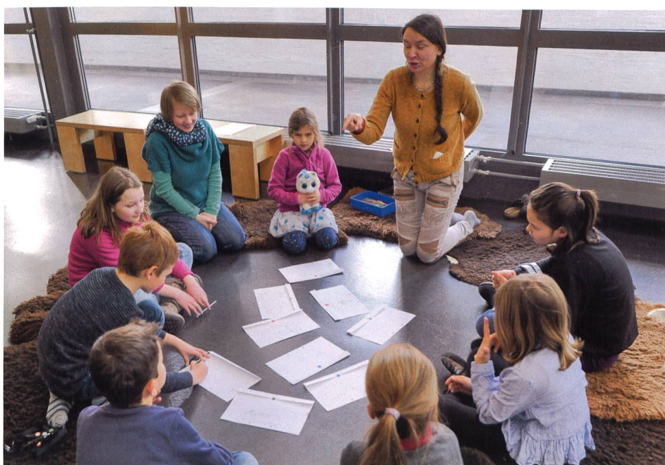
Abb. 1 Kinder des Ferienworkshops «Hosensackmuseum» diskutieren darüber, warum sie gerne Museen besuchen.

Die kulturelle Teilhabe ist kein neues Konzept in der Museumslandschaft. Je nach Intensität der Teilhabe reagiert das Publi-