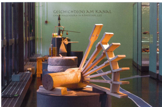
Abb. 5 Interaktive Station in der Sonderausstellung «Geschichten am Kanal». Mühlrad zum Zusammensetzen.

Von Anfang an sorgten aber Anlässe und Gruppenangebote wie Kindergeburtstage (Abb. 4) dafür, dass sich dem Publikum durch Mitmachangebote das Leben in der Vergangenheit interaktiv erschliessen konnte. Zum Beispiel, indem es in der Werkstatt steinzeitliche Werktechniken ausprobieren und dabei eine Vorstellung davon bekommen konnte, wie anstrengend, aber auch wie raffiniert das Arbeiten in der Steinzeit war. In den letzten Jahren wurde die Interaktion für die Vermittlung immer wichtiger. 10 Sonderausstellungen wurden mit interaktiven Elementen ausgestattet. Repliken römischer Glocken, eine Getreidemühle zum Ausprobieren und ein Mühlrad zum Zusammensetzen ermöglichten 2015 beispielsweise einen handfesten Zugang zur Ausstellung «Geschichte(n) am Kanal» (Abb. 5). Diese Elemente waren primär für Kinder gedacht, wurden aber auch von Erwachsenen gerne genutzt. Das zeigte sich insbesondere in der interaktivsten aller Ausstellungen «Einfach tun» im Jahr 2014, in deren Werkstatt, dem eigentlichen Kernstück, viele pfahlbauzeitliche Handwerkstechniken erprobt werden konnten (Abb. 6).