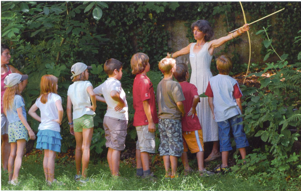
Abb. 4 Kindergeburtstag im Museum. Spielerisches Erleben der Steinzeit durch Ausprobieren und Mitmachen.

tät und trägt so zur kulturellen Vielfalt der Schweiz bei.» 8 Und er bzw. sie setzt sich auch mit der eigenen Identität auseinander – zumindest im Museum für Urgeschichte(n).