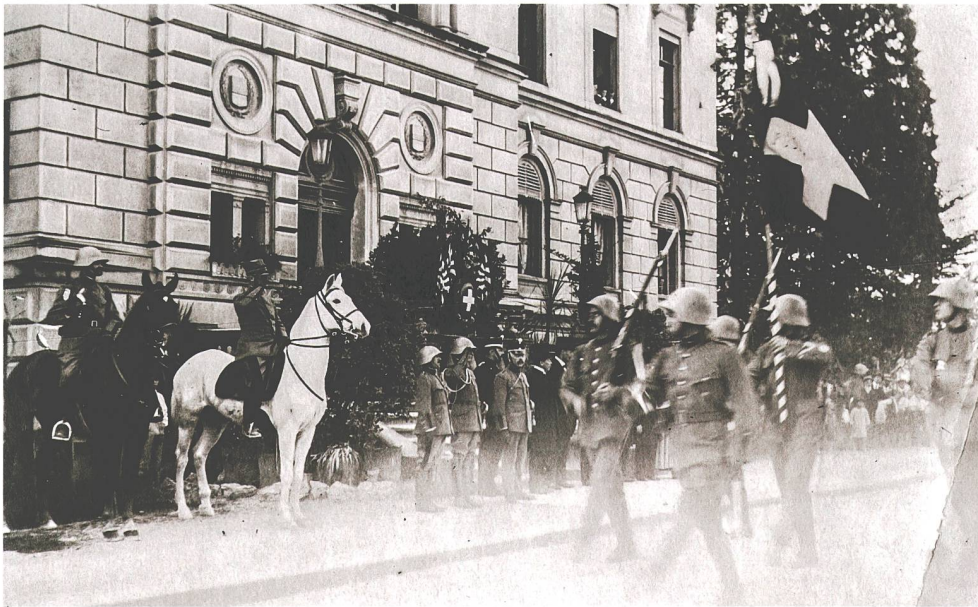
Abb. 5 Defilee des Zuger Füsiliertbataillons 48 vor dem Regierungsgebäude in Zug am 15. Mai 1919.

Am Mittwoch, 14. Mai 1919, marschierte das Bataillon ohne die Füs Kp II/48 über Horgen und Sihlbrugg nach Zug. Die Füs Kp II/48 stand noch auf der Kasernenwache und wurde erst am folgenden Tag durch das jurassische Inf Rgt 9 unter dem Kommando von Oberstleutnant Henri Guisan, dem späteren General, abgelöst. Im Gegensatz zum ruhigen Ordnungsdienst der Zuger kamen die Jurassier dann aber mehrfach zum Einsatz. 34 Auf ihrem Marsch ins heimatliche Zug wurden die 48er im beflaggten Baar vom Einwohnerrat zu einem Ehrentränk eingeladen. In Zug wurden sie mit Böllerschüssen und einem Blumenregen empfangen. Am folgenden Tag inspizierte der Kommandant der 4. Division, Oberstdivisionär Emil Sonderegger, auf der Allmend das Zuger Bataillon, das anschliessend vor dem Regierungsgebäude in Anwesenheit des Zuger Regierungsrats in corpore vor dem Regimentskommandanten defilierte (Abb. 5). Im anschliessenden, vom Regierungsrat spendierten Empfang der Offiziere im Hotel Ochsen dankte Landammann Alois Herrmann den Zuger Soldaten für ihren Einsatz sowohl im Grenzdienst als auch im eben abgeschlossenen Ordnungsdienst. Am Samstag, 17. Mai, wurde das Zuger Füs Bat 48 aus seinem letzten Aktivdienst entlassen.