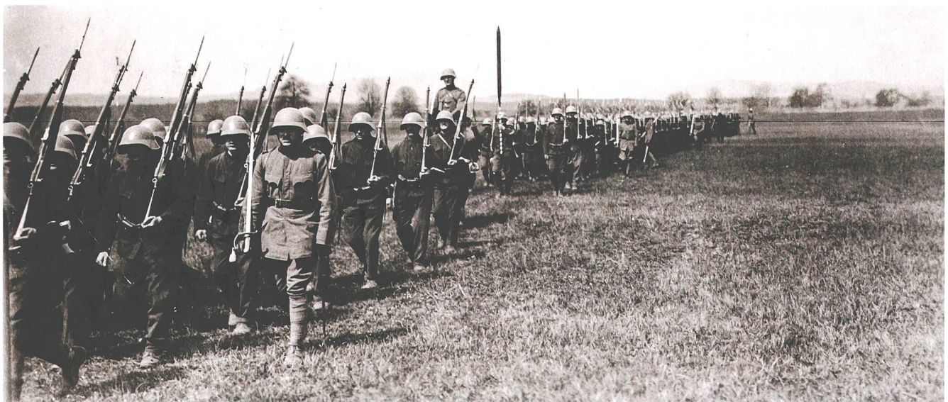
Abb. 1 Das Zuger Füsilierbataillon 48 beim Exerzieren.

Schon die Zeitgenossen erkannten, dass die alliierten Staatsmänner in der Aufgabe versagten, einen dauerhaften Frieden zu errichten. Selbst in Zug wurde das Diktat der Siegermächte als «Gewaltfriede», «Diktatfriede» und «Machtfriede der Entente» verurteilt. 2 Mit dem Versailler Friedensvertrag wurde gleichzeitig der Völkerbund geschaffen, dem zuerst aber nur Siegermächte und neutrale Staaten angehörten, was das «Zuger Volksblatt» veranlasst, in einem Leitartikel den Völkerbund als «ein Macht- und Unterdrückungstrust der Sieger gegen die immer noch gefürchteten Besiegten» zu disqualifizieren. 3 Die Völkerbundssatzungen sahen im Rahmen der kollektiven Sicherheit gegen Friedensbrecher keine Neutralität mehr vor. Am 13. Februar 1920 anerkannten aber die Siegermächte in der «Londoner Erklärung» die