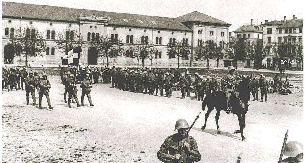
Abb. 4 Wachtaufzug des Zuger Füsilierbataillons 48 in der Kaserne Zürich während des Ordnungsdiensts Anfang Mai 1919.

Sonderegger. 29 Am 7. Mai übernahm das Zuger Bataillon den Ordnungsdienst und rückte morgens um 10 Uhr mit klingendem Spiel in Zürich ein (Abb. 3). Der Stab, die Füs Kp II/48 und die Mitr Kp III/20 wurden in der Kaserne einquartiert, die Füs Kp I/48 im Seefeldschulhaus, die Füs Kp III/48 im Wolfbachschulhaus und die Füs Kp IV/48 im Röslichschulhaus. Der Ordnungsdienst bestand lediglich aus der Bewachung der Kaserne (Abb. 4), die jede Kompanie im Zweitagesturnus übernahm, sowie aus einem etwas theatralisch inszenierten täglichen Wachtaufzug. Die nicht im Wachtdienst eingesetzten Kompanien betrieben weiter Ausbildung und übten vor allem auf den Schiessplätzen den scharfen Schuss. In der dienstfreien Zeit, vor allem am Abend, konnten sich die Zuger in geführten Gruppen im kulturellen Leben der Stadt Zürich umsehen und das Landesmuseum oder Vorstellungen im Stadttheater besuchen.